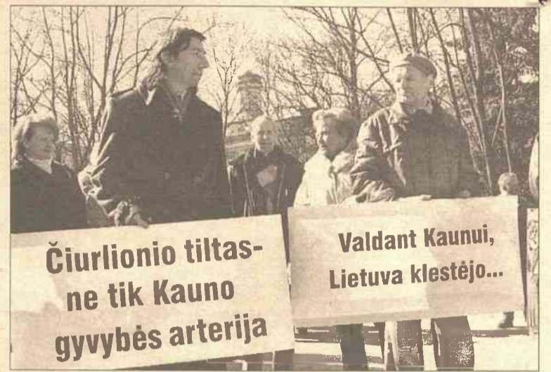
Kownianie są przekonani, że za czasów „rządów” ich miasta (międzywojenne dwudziestolecie) życie na Litwie było wspaniale