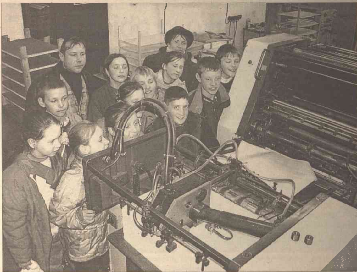
Wczoraj redakcję „Kuriera Wileńskiego” odwiedziła delegacja ze szkoły podstawowej w Szklarach w rejonie trockim. Uczniowie 5,6 oraz 7 klasy zapoznali się z procesem powstawania dziennika. Sporo emocji gościom przyniosło również zwiedzenie drukarni. Żegnając się delegacja ze szkoły podstawowej w Szklarach wyraziła sporo uznania dla ciężkiej pracy dziennikarzy.

Powiedział on, że powiewanie podczas meczu flagą Palestyny oraz imitowanie przez niektórych kibiców swym strojem lidera Yassera Arafata