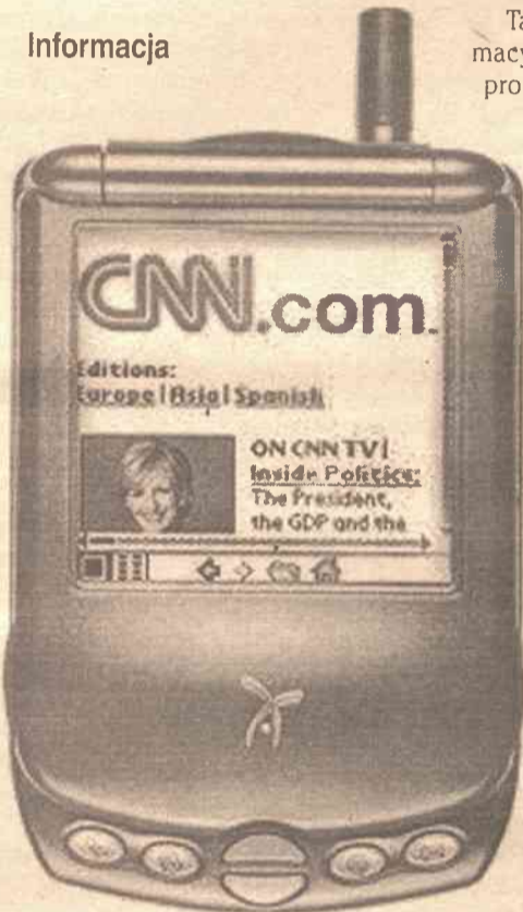
Palmtop z dostępem do internetu daje nieograniczone możliwości przekazu informacji

Czym jest informacja, wie każdy. Jest to porcja wiedzy, która ma większy lub mniejszy wpływ na nasze posunięcia. Sęk w tym, aby mieć dostęp do tych najistotniejszych danych w każdym miejscu i o każdej porze. Rozwiązanie nasuwa się samo – przenośny komputer z dostępem do jak największych zasobów informacji. Jeśli przenośny to najlepiej palmtop. Jeśli informacja to Internet. Jak więc korzystać z niego na palmtopie? Metody są dwie.