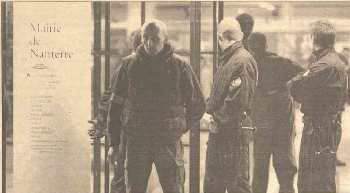
Na miejsce zajścia przybyło ponad 150 funkcjonariuszy oraz kilkanaście pojazdów policyjnych

Sprawcę strzelaniny udało się złapać i obecnie przebywa w areszcie – przekazał Decoloredo. Na ra-