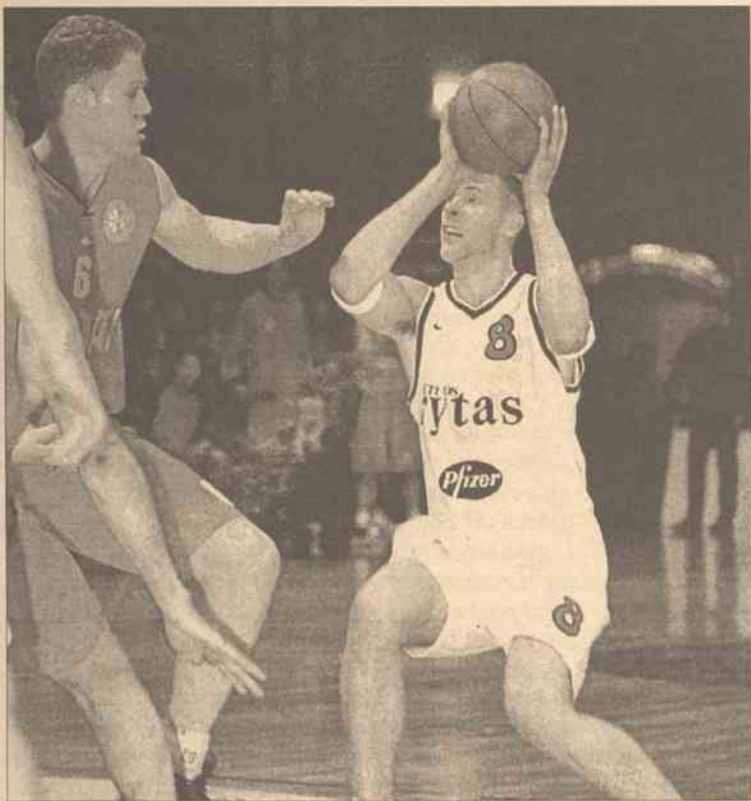
Koszykarze „Lietuvos rytas” (światłe stroje) często nie trafiali z bardzo wygodnych pozycji.

Koszykarze drużyny „Lietuvos rytas” Wilno przegrali rewanżowy mecz 1/4 finału Pucharu Saporty z izraelskim zespołem „Hapoel Migdal” Jeruzolima 65:75 i nie awansowali do następnej rundy tych rozgrywek.