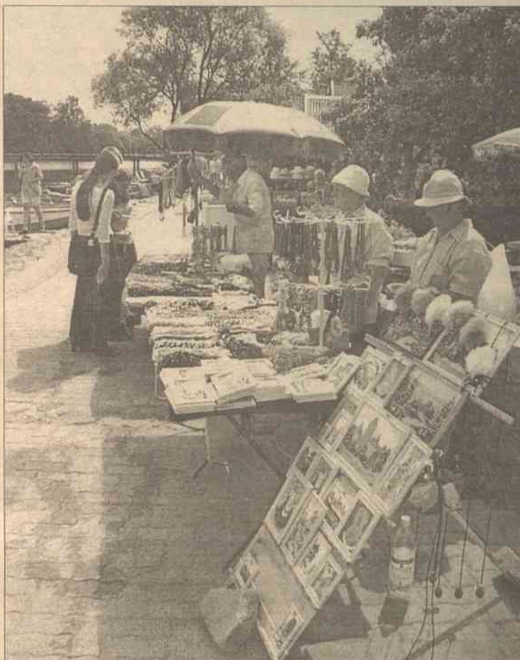
Wraz z rozpoczęciem sezonu wypoczynkowego ludzie łatwiej znajdują zatrudnienie w Trokach i okolicach

— Jest to program polegający na zatrudnieniu specjalistów dowolnej dziedziny, rozpoczynających swą karierę zawodową. W myśl tego programu pracodawcy zatrudniającego młodego specjalistę Giełda Pracy kompensuje minimalne wynagro-