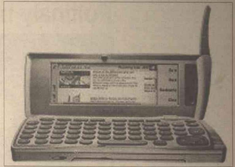
Na telefon komórkowy z internetem nie stać zwykłego zjadacza chleba

Nadeszła jednak era palmtopów, a wraz z nią – możliwość całkowitej mobilności informacji. Teraz możliwe jest odczytanie otrzymanej poczty w każdym praktycznie miejscu – w pociągu, na parkingu, a jeśli to dla kogoś za mało – dzięki niektórym hermetycznym „etui” na palmtopy – nawet pod wodą.