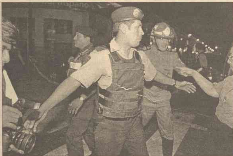
Wybuch wstrząsnął Limą w środę wieczorem