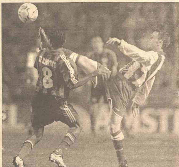
Swoją szansę awansu wykorzystali piłkarze Bayeru Leverkusen (ciemne stroje), którzy na wyjeździe poradzili sobie z Deportivo

Trener Deportivo Javier Irureta dał odpocząć niektórym swoim kluczowym zawodnikom, a ci, którzy wybiegli w podstawowym składzie, nie byli tak umotywowani jak