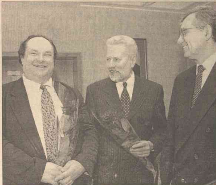
Wczoraj w Sejmie zostali zaprzysiężeni trzej nowi sędziowie Sądu Konstytucyjnego: (od lewej) Armanas Abramavičius, Kęstutis Lapinskas i Zenonas Namavičius. Ich kandydatury zgłosili prezydent, przewodniczący Sejmu i przewodniczący Sądu Najwyższego. Nowi sędziowie zastąpią w Sądzie Konstytucyjnym przewodniczącego Vladasa Povilionisa oraz sędziów Teodorę Staugaitienę i Zigmąsą Levickisą.