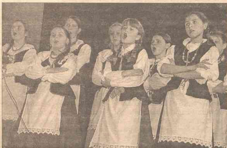
Na ludowo wystąpiła ekipa Szkoły Średniej im. J. I. Kraszewskiego