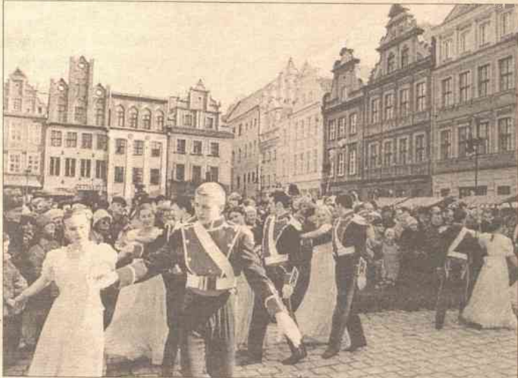
Na scenie czy na bruku — mazur wszędzie zbierał tłumy