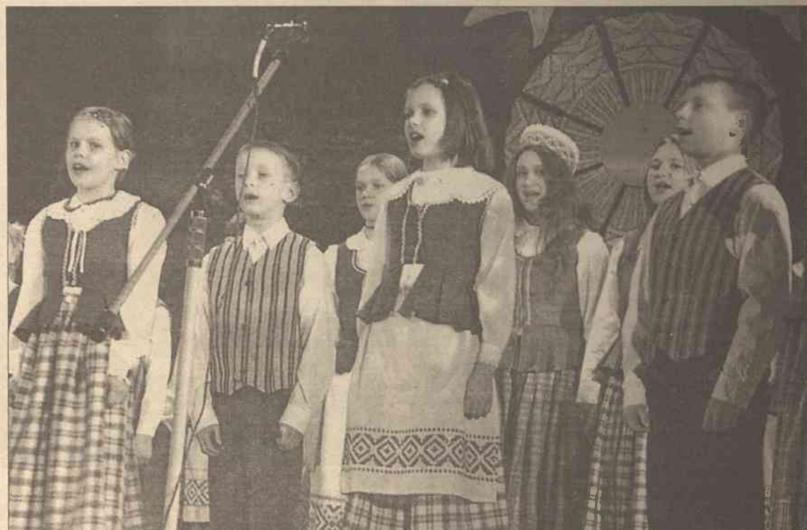
Wychowankowie Wileńskiej Szkoły-Internatu nr 3 zademonstrowali nie tylko talenty muzyczne, ale i lingwistyczne