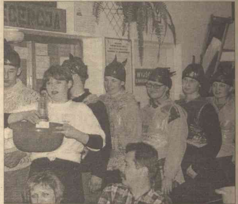
„Chrzcziny” nowicjuszy były bardzo pomysłowe i wesołe

Po powrocie do schroniska żaden zespół, mimo zmęczenia po pracowitym dniu, nie udał się na spoczynek. Wszyscy zebrali się razem, by „ochrzcić” nowo przyjętych członków zespołu, dla których ten wyjazd był pierwszy. Przede wszystkim każdego ubrano stosownie do mody XXI wieku. Następnie każdy musiał wykonać przeróżne