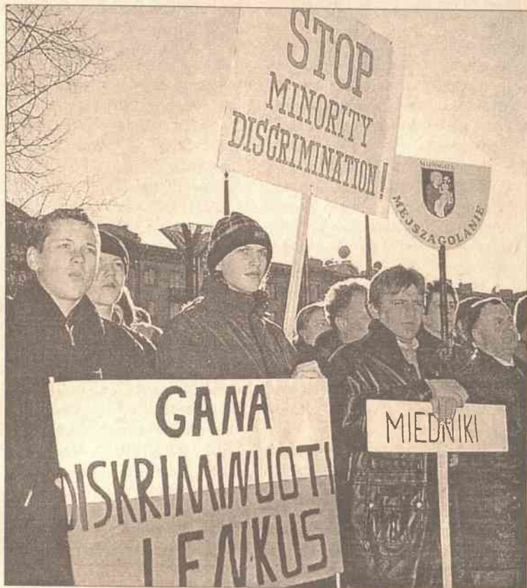
Na wiec przybyli z całej Wileńszczyzny