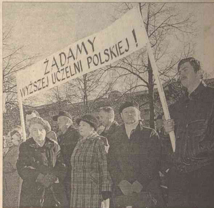
Wyższa uczelnia dla naszych dzieci i wnuków – mówili Polacy na wsiach