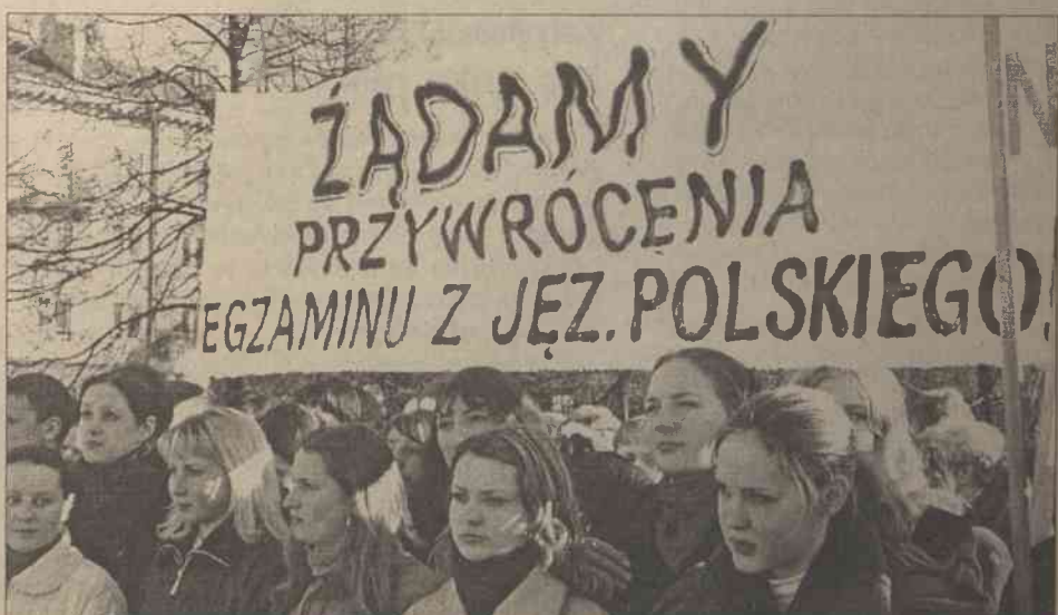
Maturzyści szkół polskich nie boją się jeszcze jednego egzaminu