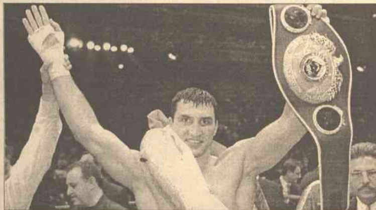
Ukraiński bokser Władimir Kliczko obronił tytuł mistrza świata w wadze ciężkiej organizacji WBO, pokonując w Stuttgarcie przez nokaut w ósmej rundzie Fransa Bothę z RPA. Była to pięćdziesiąta zawodowa walka Bothy i jego szósta porażka. Kliczko ma na koncie 39 pojedynków, z których przegrał tylko jeden