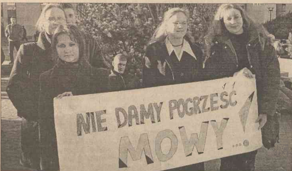
Słowa Roty zawsze wzruszają