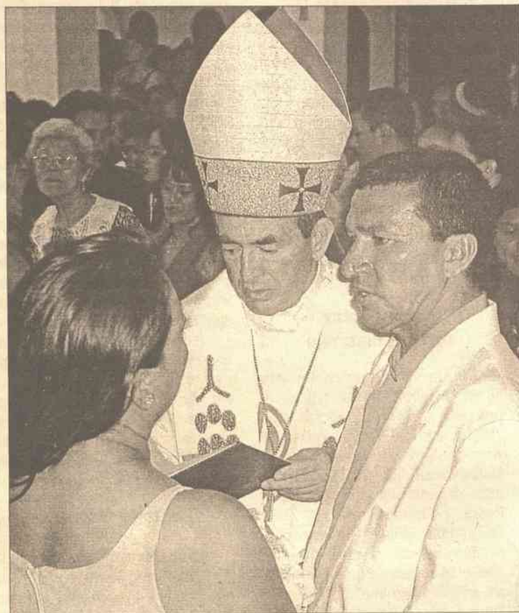
Zamordowany arcybiskup (pośrodku) wielokrotnie krytykował lewackich partyzantów za ich ataki i porwania ludzi