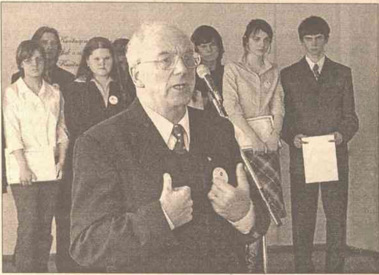
Ambasador Jerzy Bahr na olimpiadzie poznał jeszcze jedną kartę życia Wileńszczyzny