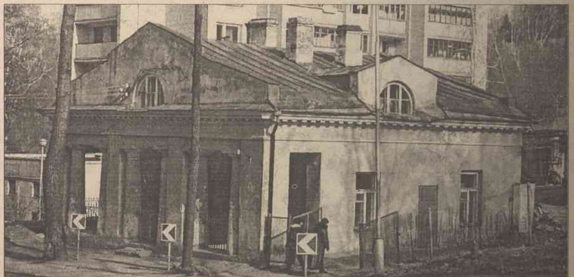
Strażnica na Lipówce z 1819 r.

Po włączeniu Litwy i Wilna do Rosji w latach 1799-1800 władze rosyjskie na rogatkach miasta, u wylotu głównych dróg zaczęły budować strażnice.