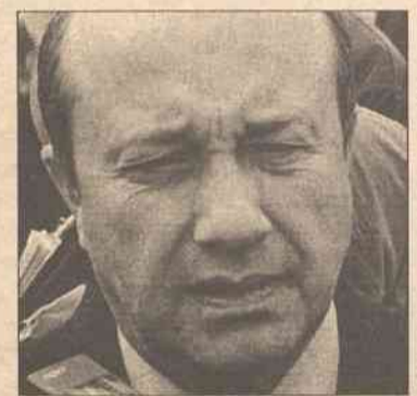
Jeden dzień ministra w Wilnie

W swoją kolej Rosjanie się obawiają, że po wprowadzeniu wiz ta