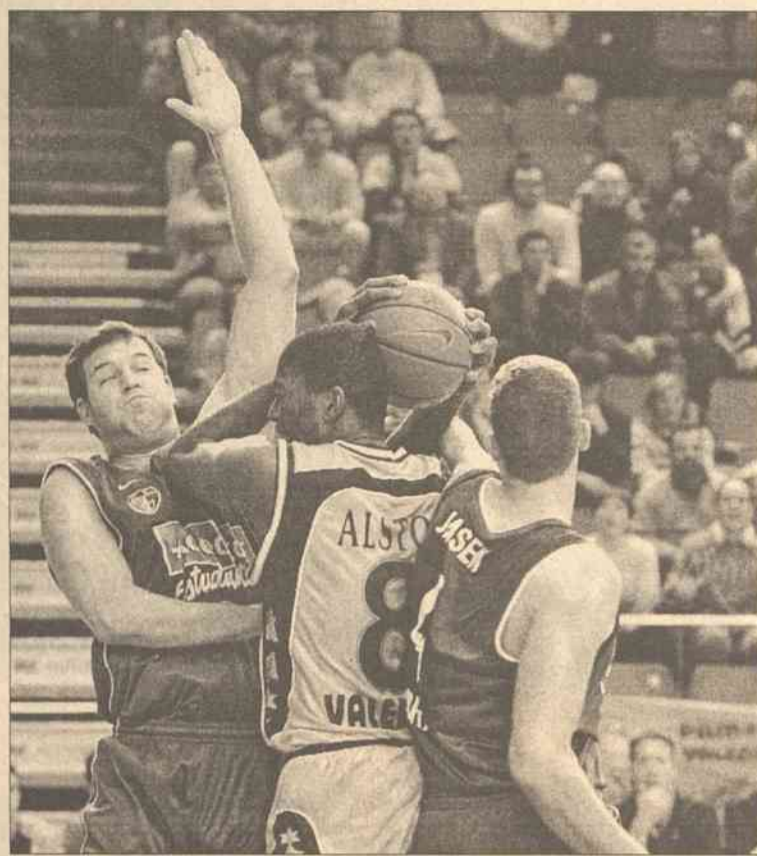
W bratobójczym dwumeczu hiszpańskich zespołów „Pamesa” Walencja (światłe stroje) dwukrotnie pokonali „Adecco Estudiantes” Madryt 80:77 i 89:68

„Lietuvos rytas” Wilno w rewanżowym meczu 1/8 finału Pucharu Saporty pokonał na własnym parkiecie chorwacki zespół „Croatia Osiguranje” Split 84:70 (22:17, 17:20, 10:16, 35:17) i awansował do następnej rundy.