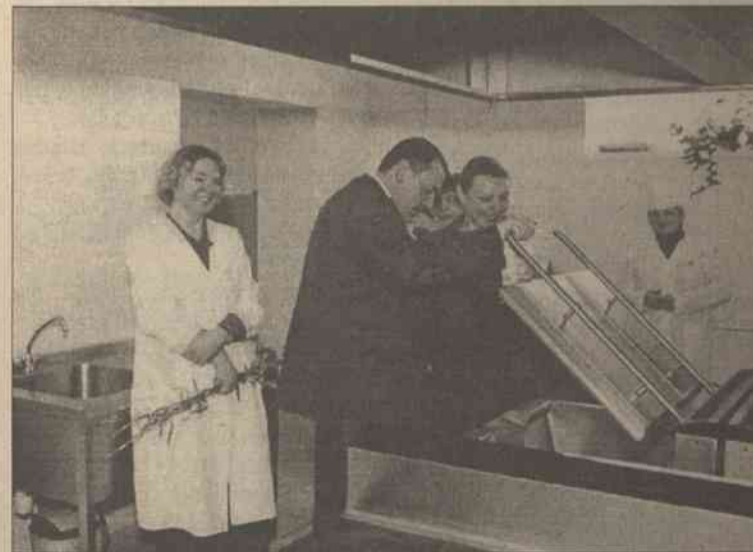
Goście obejrżeli każdy zakątek

pozbawiają ich dachu nad głową również oszuści. Niejako zastępczym wyjściem dla nich jest zamieszkanie w domu opieki. Wice-mer rejonu wileńskiego Paramonera dla „K. W.” powiedziała, że w stołecznym rejonie nie ma specjalnych domów opieki. Gdy zaś specjaliści