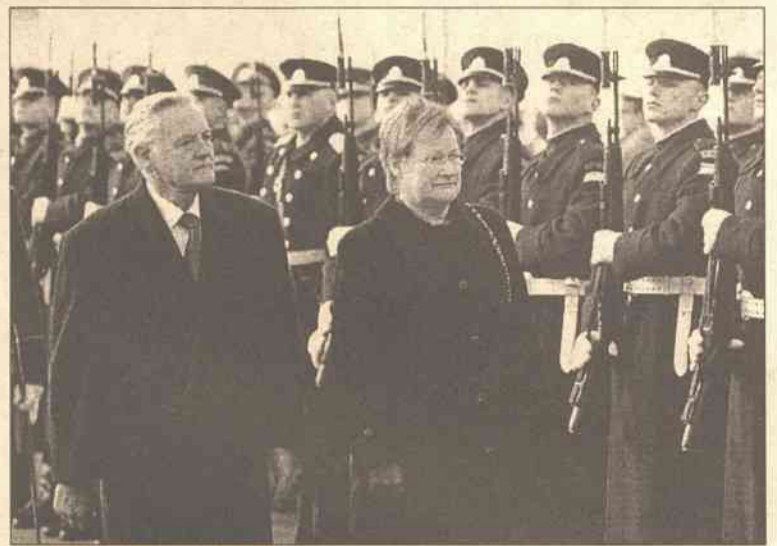
Po raz pierwszy Tarja Halonen w charakterze prezydenta

Litwa, zdaniem pani prezydent, zrobiła bardzo duże postępy w swej „pracy unijnej”. Natomiast dla Finlandii poszerzenie Europy jest sprawą priorytetową. Kraj ten bowiem uważa, że proces poszerzenia Unii Europejskiej jest korzystny dla samej Unii. Jednak, Finlandia trzyma się tej zasady, iż postępy każdego kraju-kandydata powinny być oceniane z osobna. Pani prezydent po-