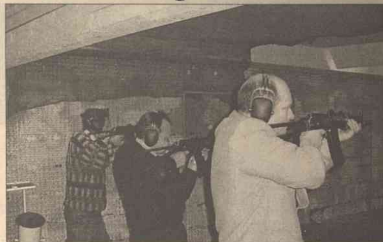
Każdy uczestnik będzie długo wspominał swe osiągnięcia na turnieju