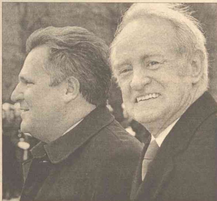
„Jestem wdzięczny prezydentowi Rauowi za jego jasną deklarację” — powiedział Kwaśniewski.

Prezydent Niemiec Johannes Rau zadeklarował nieustające poparcie RFN dla obecności Polski w UE — powiedział prezydent Aleksander Kwaśniewski po rozmowach z Rauem.