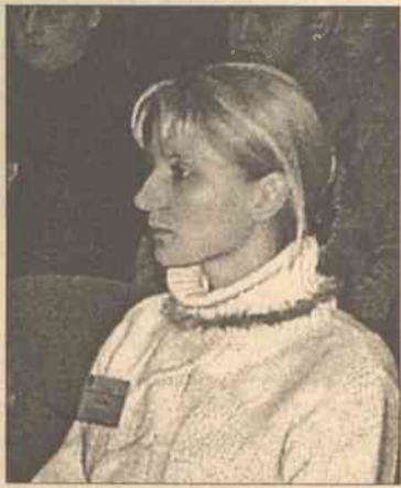
Myślę, więc jestem

Kocham Wilno. Tam wszystko wydaje się takie swojskie, piękne, nawet kurz i brudny śnieg nie przeszkadzają... Zdarza się czasami, że