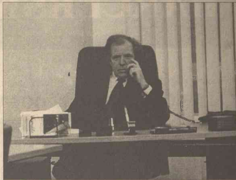
G. Brauns mieszka na Litwie już dziesięć lat

Brak specjalistów od języków obcych, a szczególnie angielskie-