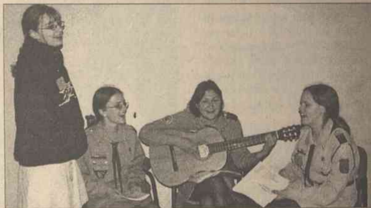
... bo wszyscy harcerze, to jedna rodzina