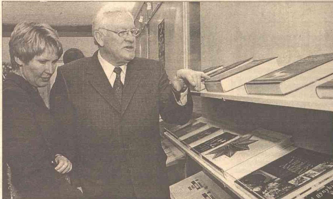
Premier Algirdas Brazauskas i minister kultury Roma Dovydeniene na III Wileńskich Targach Książki w „Litexpo” mieli sporo do omówienia

Wśród pierwszych stoisk, które odwiedził Brazauskas, były stoiska ARS POLONA, Zespołu Literackiego Instytutu A. Mickiewicza, Instytutu Polskiego w Wilnie i wydawnictwa „Strofa”, które wydaje utwory pisarzy polskich po litewsku.