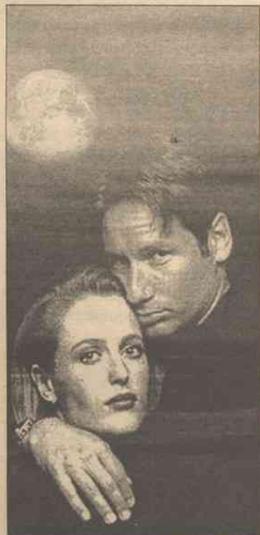
David Duchovny także wierzy w latające spodki

– Bez wątpienia, każdy z nas czegoś się lęka, ma w sobie różnorodne instynkty, i miłości, i agresji, i śmierci. Nie zawsze możemy opanować te wszystkie instynkty, uporządkować je w sobie. Jeżeli człowiek jest bardzo wrażliwy i ma jakieś osobiste problemy, to w tym przypadku owe instynkty agresji czy też strachu przed śmiercią stają się prawdziwe i prawie niemożliwe do okiełznania, jeżeli jest to osoba o słabych nerwach – tłumaczy psychiatra, – zaczyna interesować się filmami grozy, często odwiedza groby, niekoniecznie rodzinne. Bez wątpienia, tych ludzi przerażają groby, ale jednocześnie