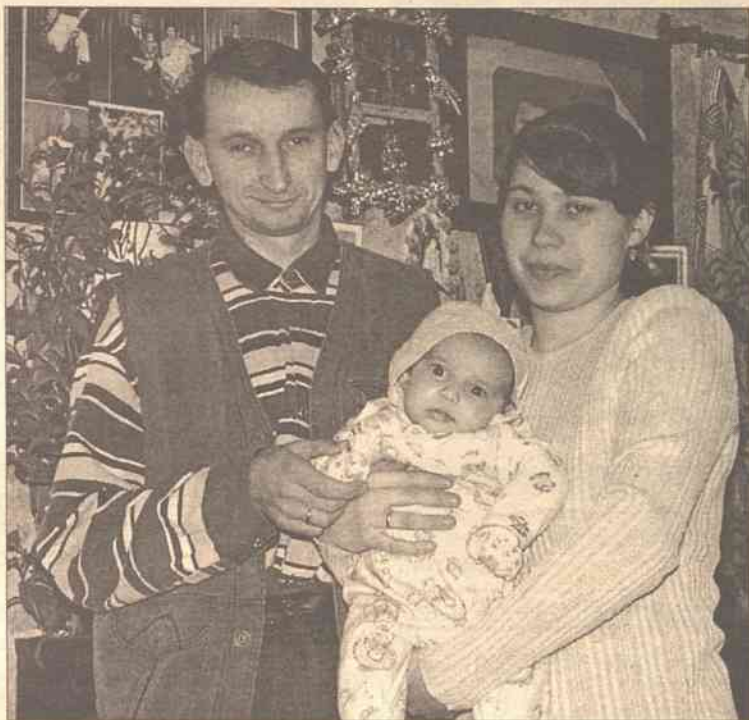
Mama, tata i ja