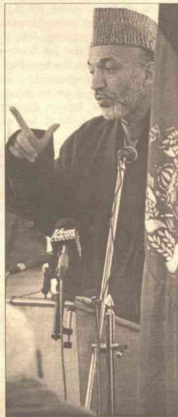
Dzisiaj Karzaj złoży wizytę w Pakistanie

Wielu lokalnych przywódców afgańskich - w tym liczne grupy kla-