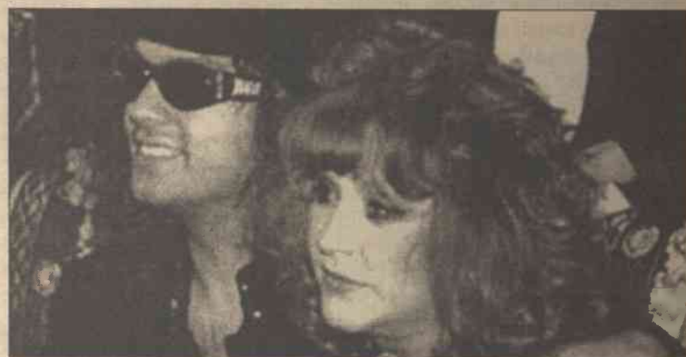
Głośna para z szokującą różnicą wieku

Być może, niewiele, bo nie ma statystyki na ten temat, jednak zwiększyła się liczba związków, w których kobieta jest starsza od partnera. Gdy w małżeństwie mężczyzna jest starszy nawet o 10 lub więcej lat, to nie wzbudza takiej sensacji, jak w przypadku kobiety starszej od partnera. Przyczyn można szukać w pewnych zmianach społecznych i obyczajowych. Dziś kobieta dojrzała jest bardziej zadbana, wygląda młodo i pociągająco, co, zapewne, początkowo myli pretendentów do jej serca. Przecież nikt nie rozpoczyna rozmowy z przedstawicielem płci odmiennej od pytania o wiek. Odczuwamy zainteresowanie, jesteśmy zauroczeni czy zafascynowani, a dopiero potem zdajemy sobie sprawę z wieku, pozycji społecznej itd. naszej wybranki. Błędne jest również rozumowanie, że małżeństwo z dużą różnicą wieku ma mniejsze szanse powodzenia. Z pewnością, takie małżeństwa są narażone na problemy jak każde inne. Tradycyjna i tolerowana różnica