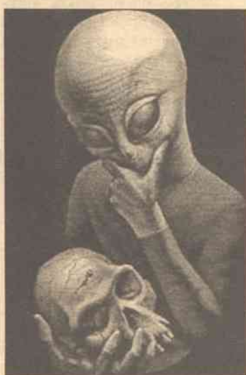
Może kosmici chcą tylko lepiej nas poznać?

zdają sobie sprawę z tego, że tylko to może pomóc w opanowaniu im tej bestii, tkwiącej w głębi ich duszy i świadomości, a kosmici mogą być ucieczką przed śmiercią –