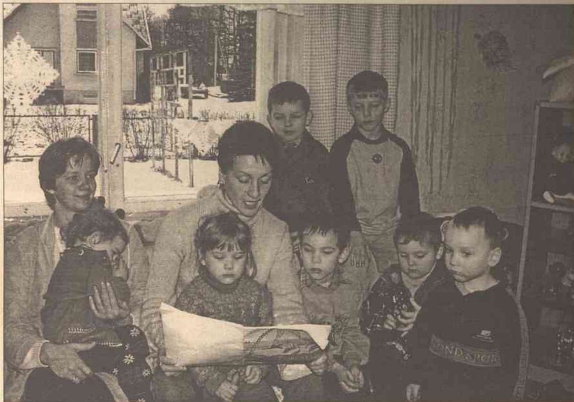
Wszystkie dzieci lubią bajki

stąpiliśmy próg przedszkola, właśnie poznawali kolejne przygody Robinsona.