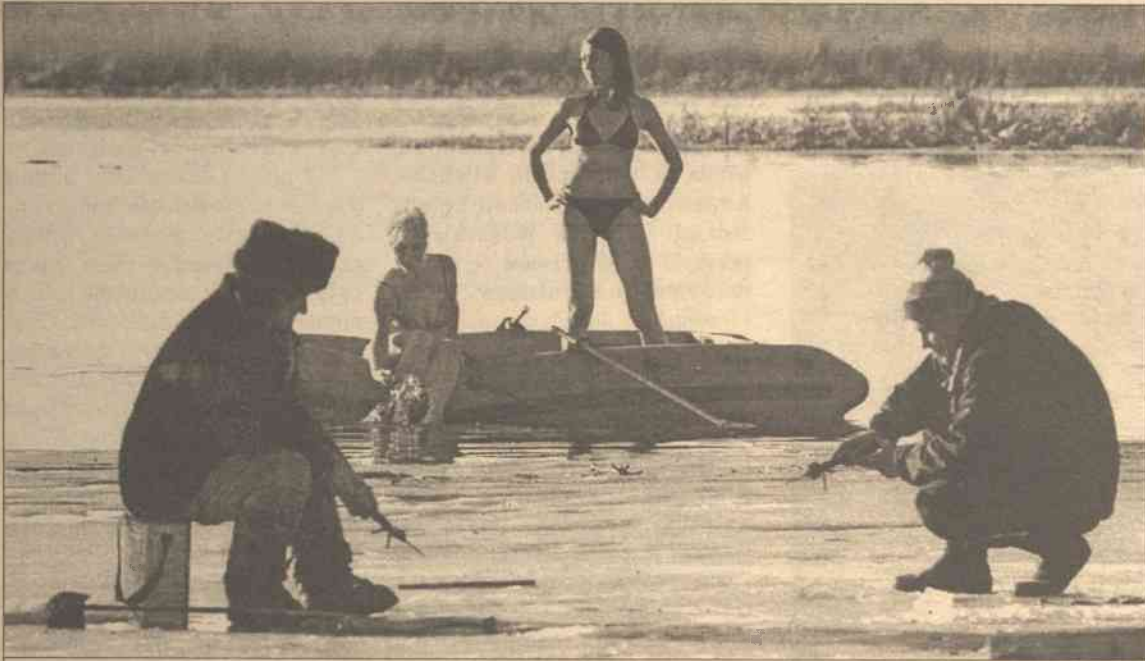
Mężczyźni wędkują, podczas gdy młode kobiety używają kąpeli słonecznej nad jeziorem w okolicach Mińska. Ostatnio na Białorusi pogoda jest po prostu wspaniała! Zaskakująco wysoka temperatura jak na panującą porę roku, czyli ponad 17 stopni powyżej zera według skali Celsjusza.