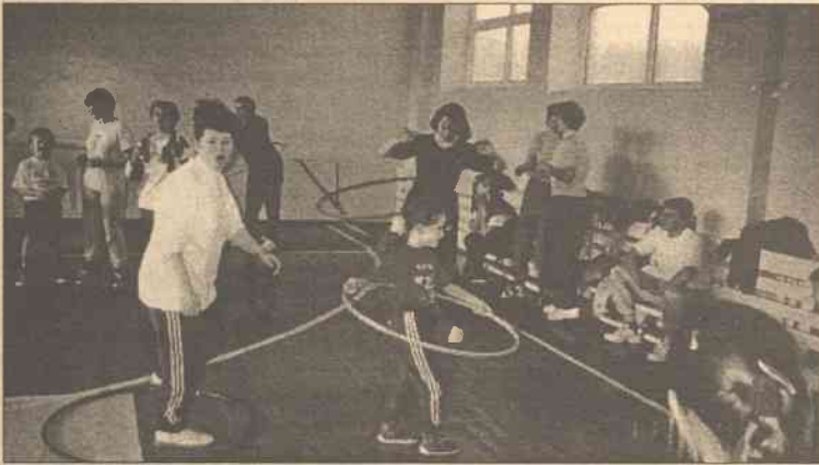
Dla mam przygotowano ciekawy konkurs: ćwiczenia z obręczami

W sobotę, 26 stycznia, w Solecznickiej Szkole Średniej im. J. Śniadeckiego po raz trzeci odbyła się „Rodzinna Olimpiada Sportowa – 2002” wśród uczniów klas 1:2, 3:4 oraz ich rodziców. Rodzice byli bardzo aktywni, bo do szkoły szli całą rodziną: mama, tata i dziecko.