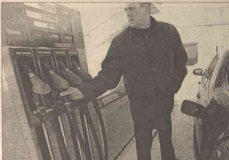
Na stołecznych stacjach paliwowych "Lietuva Statoil" po wcieleniu projektu liczba kradzieży paliwa zmniejszyła się o 63 proc.

Projekt prewencji przestępczości "Voratinklis" ("Pajęcza sieć") został uznany za doskonały przykład współpracy instytucji komercyjnych z policją. Wciągnięto go do tworzonej przez samorząd wileński koncepcji bezpiecznego miasta.