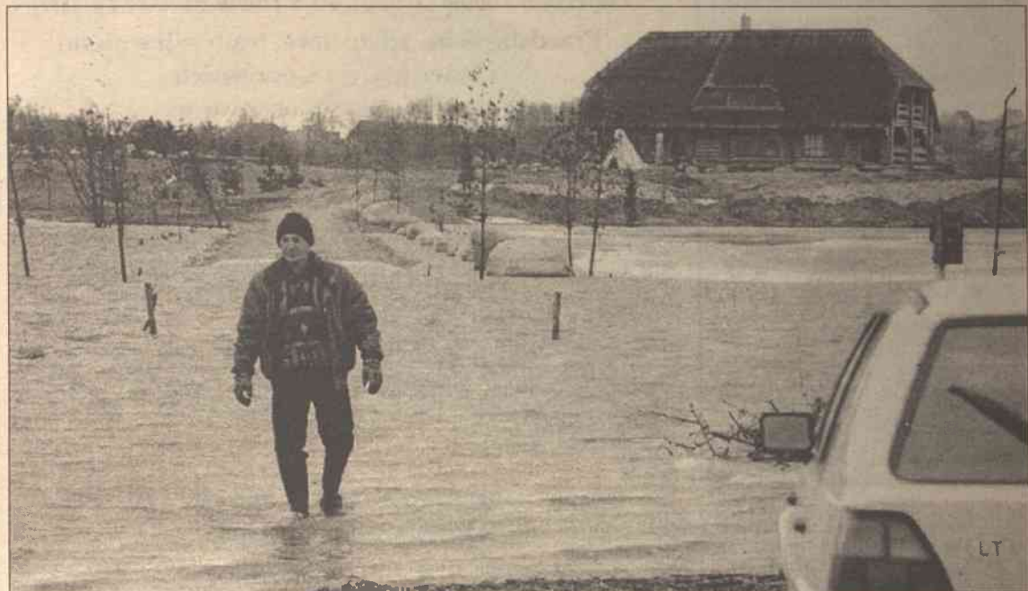
Dobra wiadomość dla mieszkańców Lankupiai (rej. Kłajpedzki) – poziom wody w rzeczce Minija, wpadającej do Niemna, obniżył się o jeden centymetr... Na zdjęciu – wezbrana Minija koło Gargzd