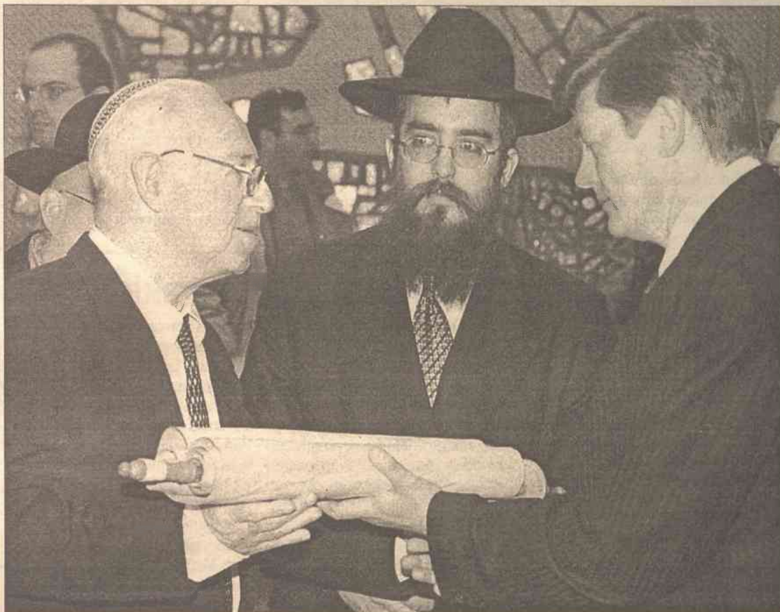
Przekazanie żydowskich pism świętych przez marszałka Sejmu Artūrasa Paulauskasa przewodniczącemu jerozolimskiego centrum „Hechal Shlomo” Shlomo Mosche Moskovic'owi

Wiceminister Melchior powiedział, że naród i państwo izraelskie są wdzięczni Litwie za zwrot pism: „Krok ten jest dobrym gestem na drodze budowania dobrych stosunków przyszłościowych w oparciu o prawdę historyczną” –