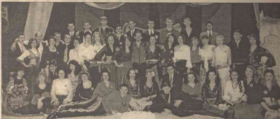
50 dwunastoklasistów Niemeczyńskiej Szkoły Średniej