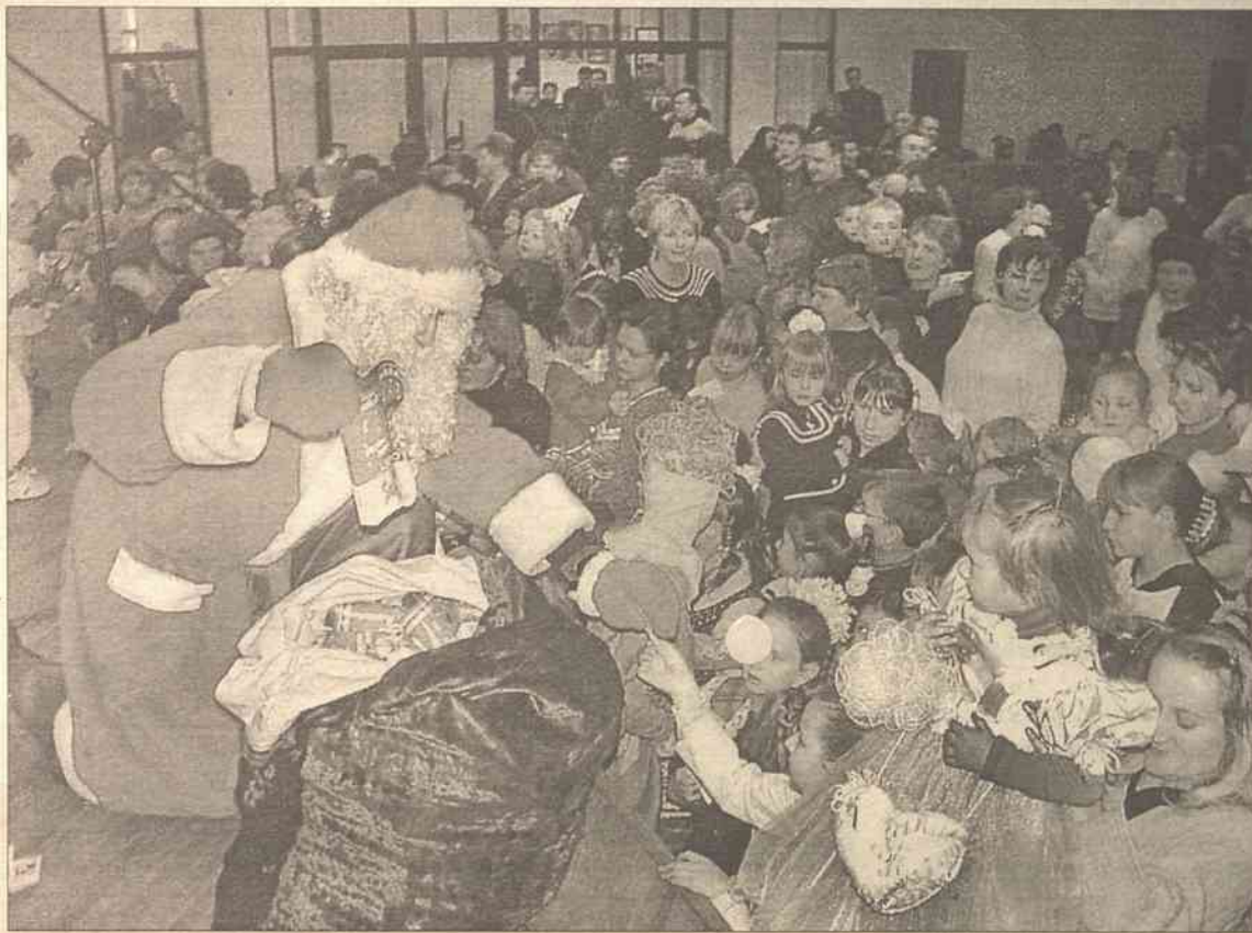
Poranek świąteczny sprowadził ponad 800 dzieciaków