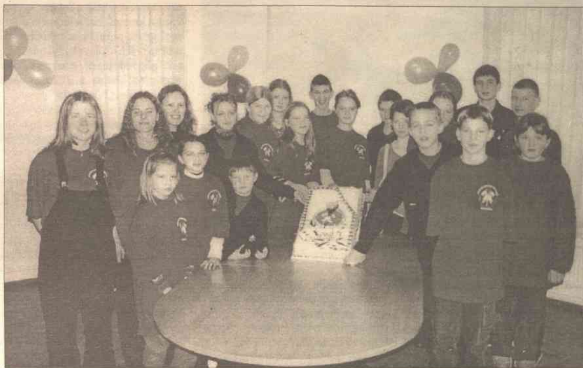
... Jest nas więcej: z Wilna, Kowna, Niemenczyna...

Pod numerem telefonu 8-800 20808 można nieodpłatnie, anonimowo o dowolnej porze informować policję o ludziach, wydarzeniach bądź przestępstwach, związanych z nielegalnym handlem narkotykami.