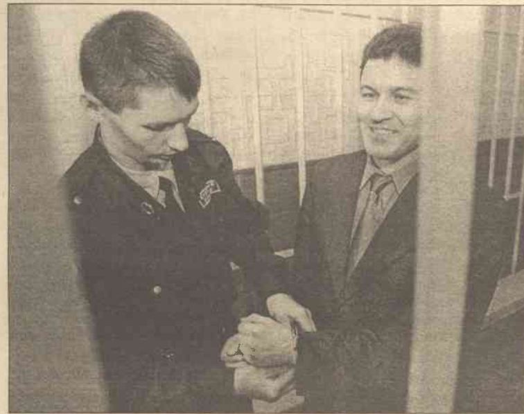
Zatrzymany w 1997 roku Pasko (po prawej) był oskarżony o ujawnianie tajemnicy państwowej na temat gotowości bojowej rosyjskiej Floty Pacyficznej japońskim mediom

Sąd wojskowy we Władywostoku w Rosji skazał we wtorek dziennikarza wojskowego Grigorija Pasko na cztery lata więzienia i degradację, jednak uwolnił go od głównego zarzutu – zdrady tajemnic państwowych.