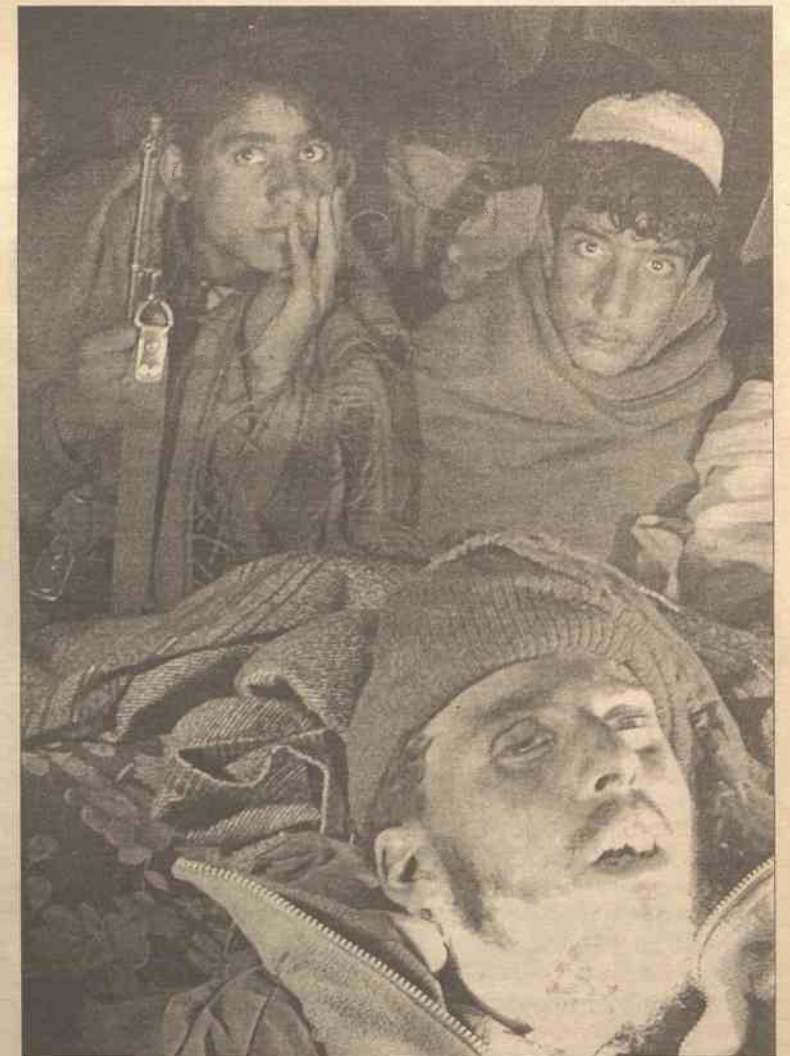
Amerykańska organizacja pozarządowa „Dom Wolności” opublikowała w niedzielę coroczny raport dotyczący wolności na świecie. Organizacja ogłosiła listę 11 krajów, które według niej są najmniej liberalne. Trafili na nią Afganistan, do niedawna rządzony przez ortodoksov islamskich – talibów. Na pozostałych miejscach znalazły się: Birma, Kuba, Gwinea Równikowa, Irak, Korea Północna, Libia, Arabia Saudyjska, Sudan, Syria i Turkmenistan.

chłodzenia organizmu zmarły trzy osoby, zaś 44 inne zostały przewiezione do szpitala. Grudzień w Moskwie był wyjątkowo chłodny z temperaturami dochodzącymi do 20 stopni Celsjusza poniżej zera. Ofiarami mrozów padają najczęściej osoby bezdomne, w większości wykazujące ślady spożycia alkoholu.