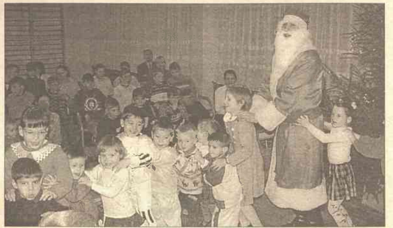
Święty Mikołaj zaprosił dzieci do zabawy