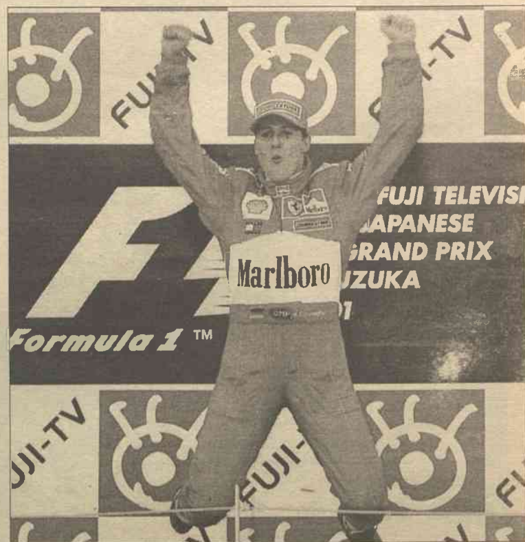
Rok 2001 przyniósł wiele zwycięstw i powodów do radości dla niemieckiego mistrza kierowcy Michaela Schumachera