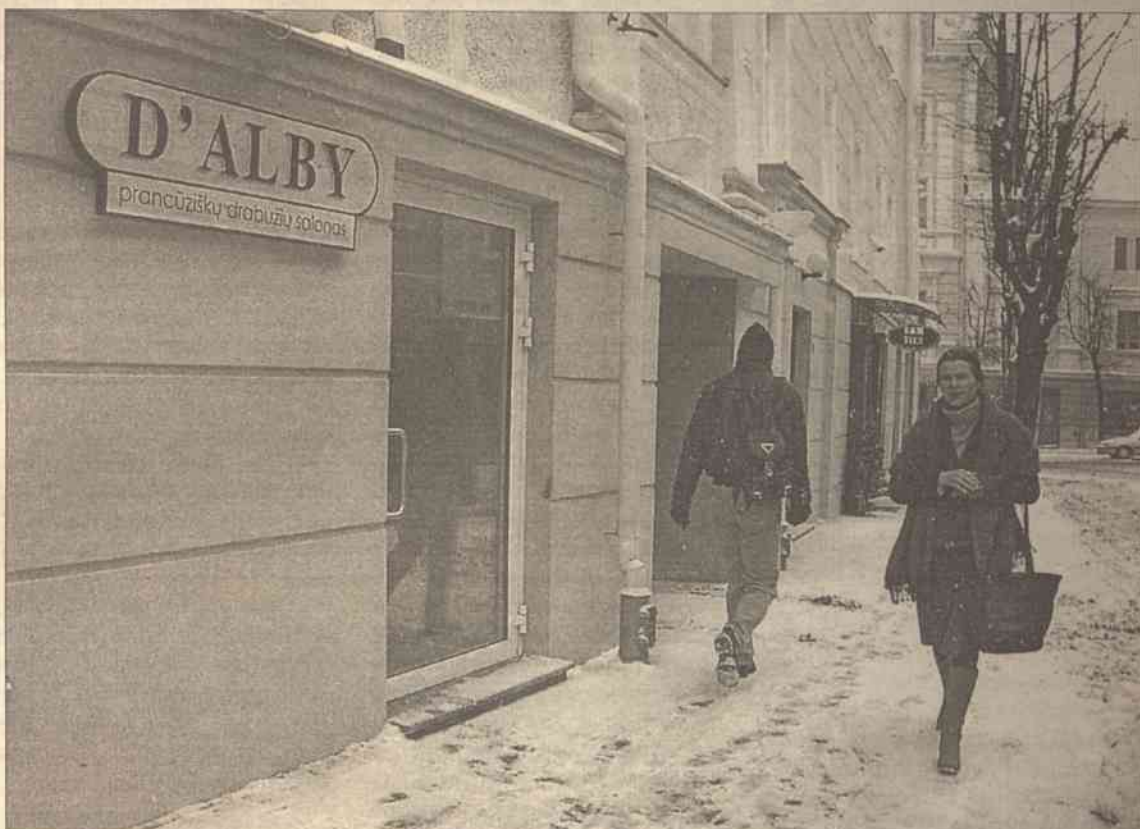
Na ulicy Hetmańskiej (Etmoniu) zawsze przytulnie