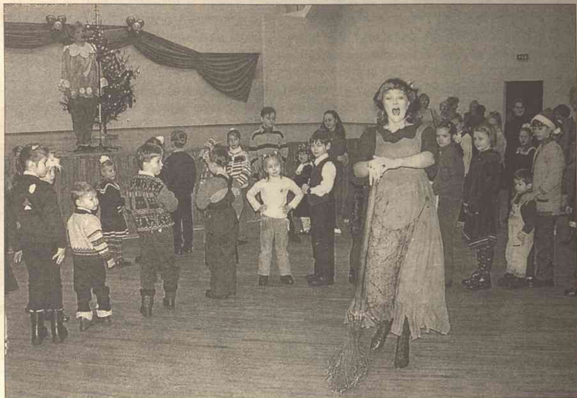
A na scenie ciągle zmieniały się postacie z dobrze znanych bajek