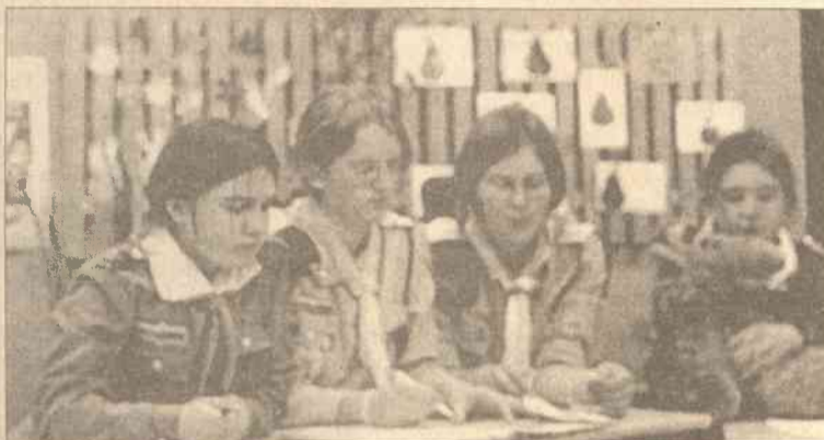
Na Radzie Programowej został opracowany ważny dokument — regulamin drużyny, który ułży w prowadzeniu pracy wychowawczej

Zebrane w Wojdatkach harcerki opracowały wymagania na spraw-