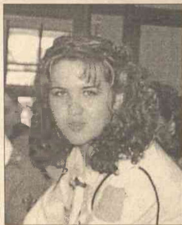
O zimowiskach mówią komendantki...

Wierzę, że będzie owocne. Liczę na to, że harcerze nauczą się wielu nowych rzeczy i będą mogli