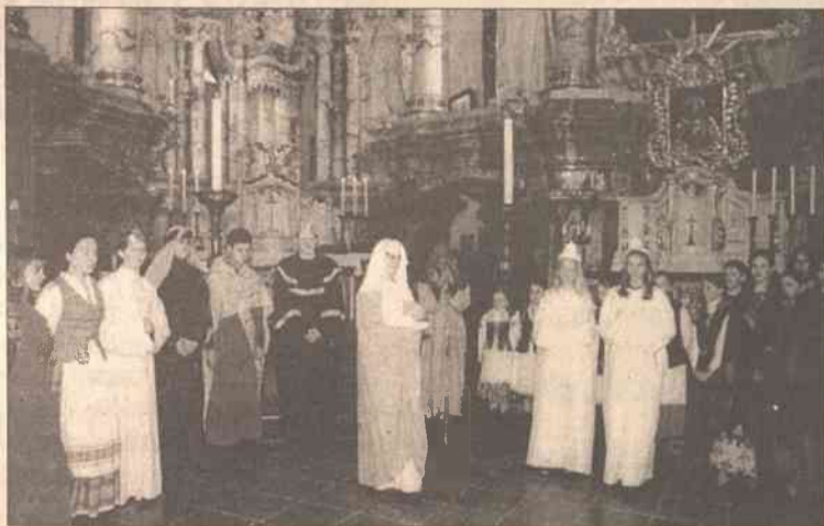
Jedne z pierwszych jasełek w naszym mieście odbyły się w kościele Ducha św., w wykonaniu uczniów Wileńskiej Szkoły Średniej im. Józefa Ignacego Kraszewskiego