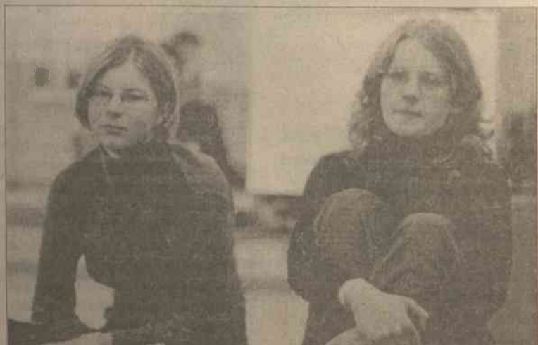
Druhny czas wykorzystywały nie tylko na pracę umysłową i twórczą, mogły dyskutować na aktualne każdej tematy

Skargi, wnioski, zażalenia prosimy kierować pod adresem „Kuriera Wileńskiego” z dopiskiem „WGH”: Birbinių g. 4a, 2030 Vilnius, e-mail: gazetaharcerska@yahoo.com