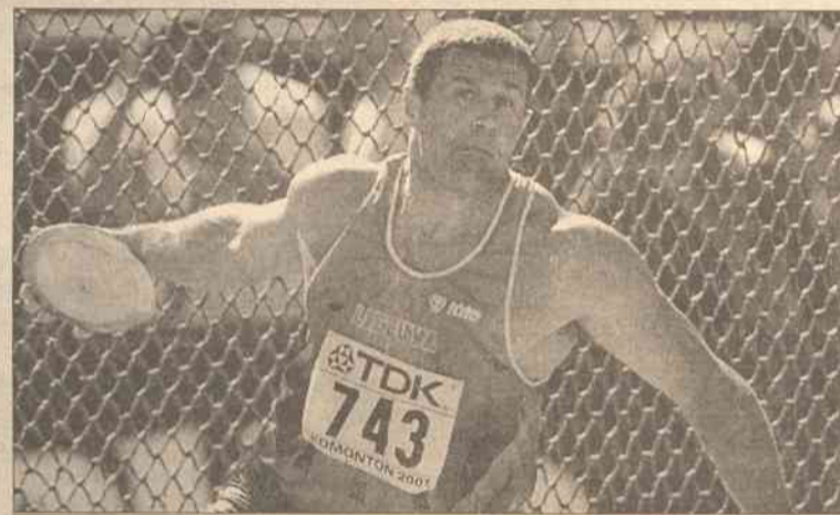
Srebrny medalista mistrzostw świata w lekkoatletyce, w konkursie rzutu dyskiem Virgilijus Alekna w plebiscycie na najlepszego lekkoatletę w Europie w 2001 roku uplasował się na trzeciej pozycji. Litwin uzbierał w głosowaniu 2674 punktów. Zwycięzcą, uzyskując 3807 głosów, został Szwajcar Andre Bucher, który w mistrzostwach świata zwyciężył w biegu na 800 m.