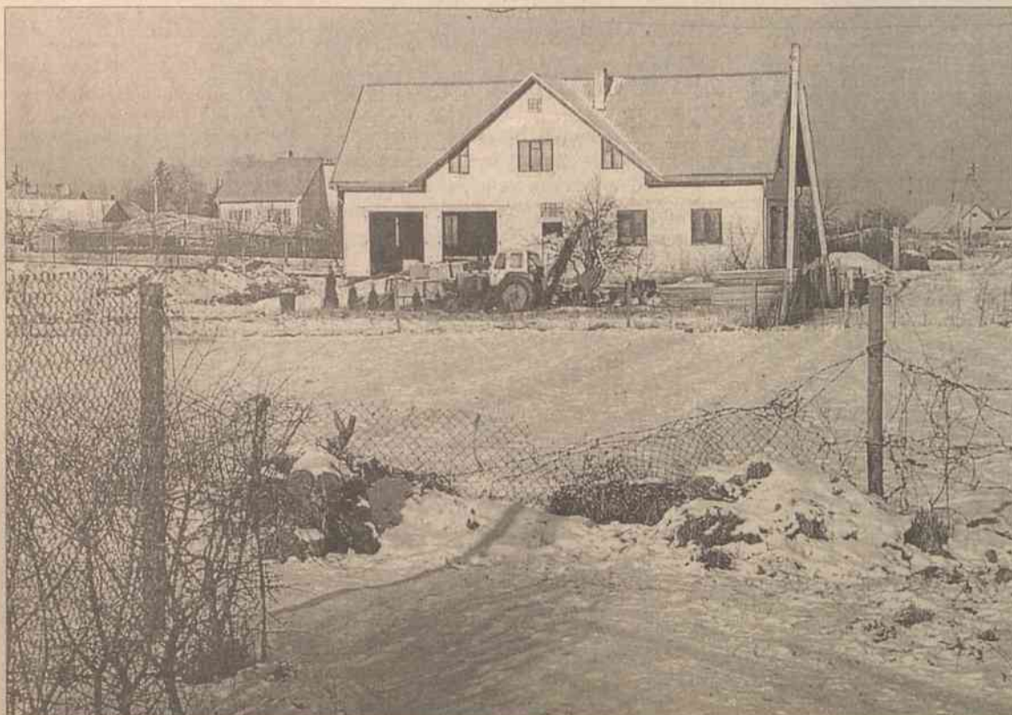
Budynek Stiepczuków i obalony (przez kogo?) płot w ogrodzie państwa Abramyczewów i Griszko

Jadwiga Podmostko