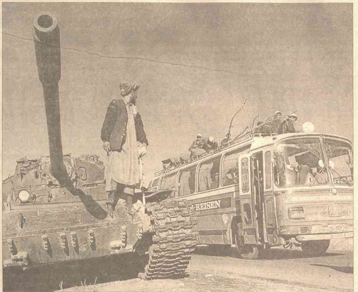
Wobec pospolitych przestępców w Afganistanie zostanie zastosowane surowe islamskie prawo szariat

Zgodnie z ustawą, brytyjskie władze mają prawo przetrzymywać w areszcie bez procesu osoby podejrzane o powiązania z terrory-