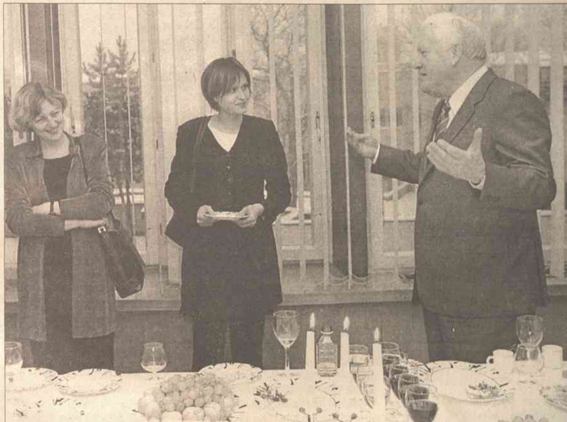
Algirdas Brazauskas oświadczył dziennikarzom, że o decyzji kandydowania na prezydenta poinformuje w połowie przyszłego roku.

negocjacyjnych, niemniej podstawowe kwestie, przeszkadzające zakończeniu negocjacji między pozostałymi dwoma stronami, są związane z ich interesami i rząd nie może tu praktycznie pełnić roli pośrednika — stwierdził premier Algirdas Brazauskas.