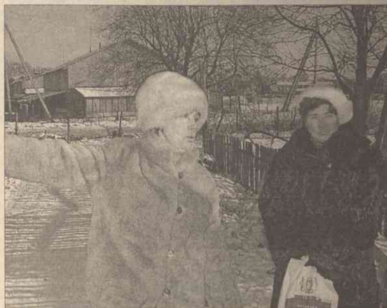
Sąsiedki nie doszły do porozumienia