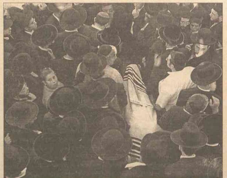
Izraelczycy zapowiadają nasilenie się kampanii antyterrorystycznej

Stany Zjednoczone wciąż uznają Jasera Arafata za przywódcę Autonomii Palestyńskiej i chcą nadal współpracować z władzami palestyńskimi – zadeklarował wczoraj amerykański podsekretarz stanu William Burns. "Uważamy prezy-