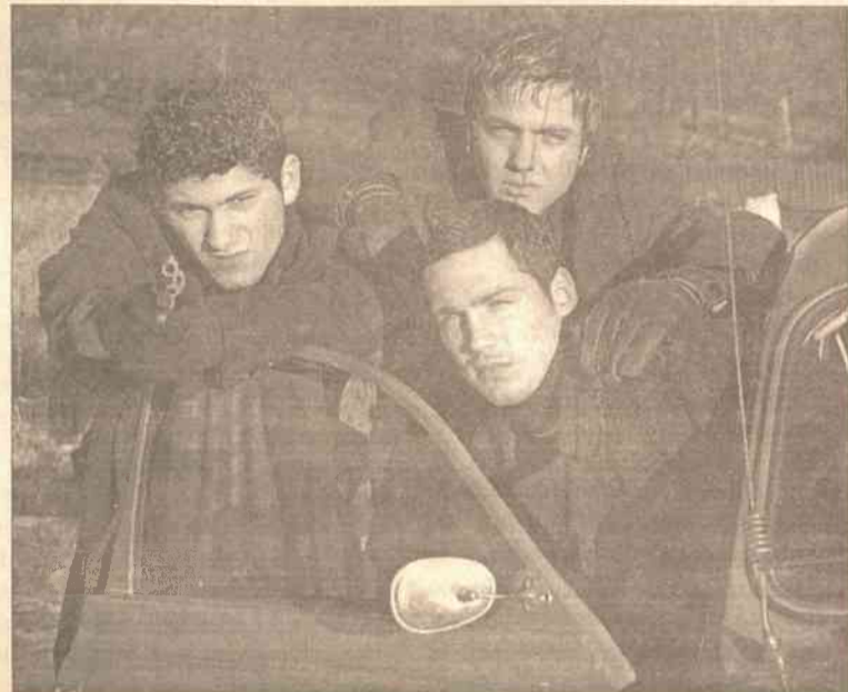
Chłopcy z „Pikaso” o statuetkę będą walczyli z mocnymi konkurentami