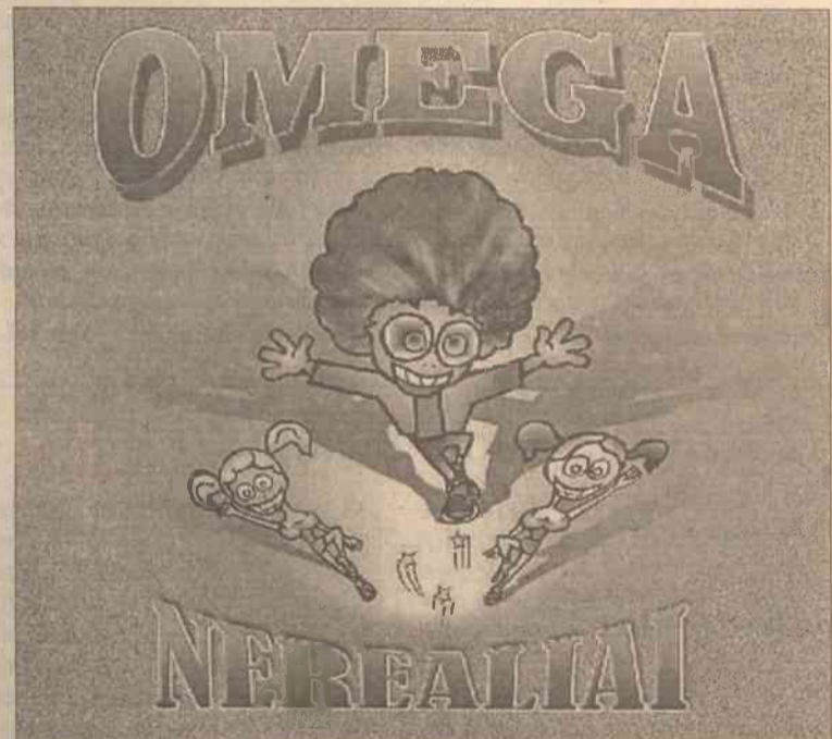
Zespół „Omega” został nominowany w kategorii „Najlepsza piosenka”