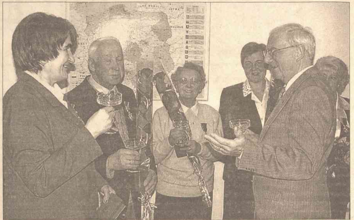
Po wręczeniu Krzyży Zasługi prawie każdy z nagrodzonych dziękował za uznanie i wysoką nagrodę państwa polskiego