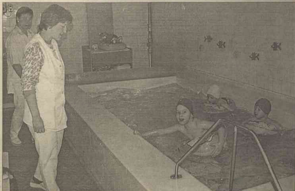
Pluskanie się w basenie – to ulubiona zabawa maluchów