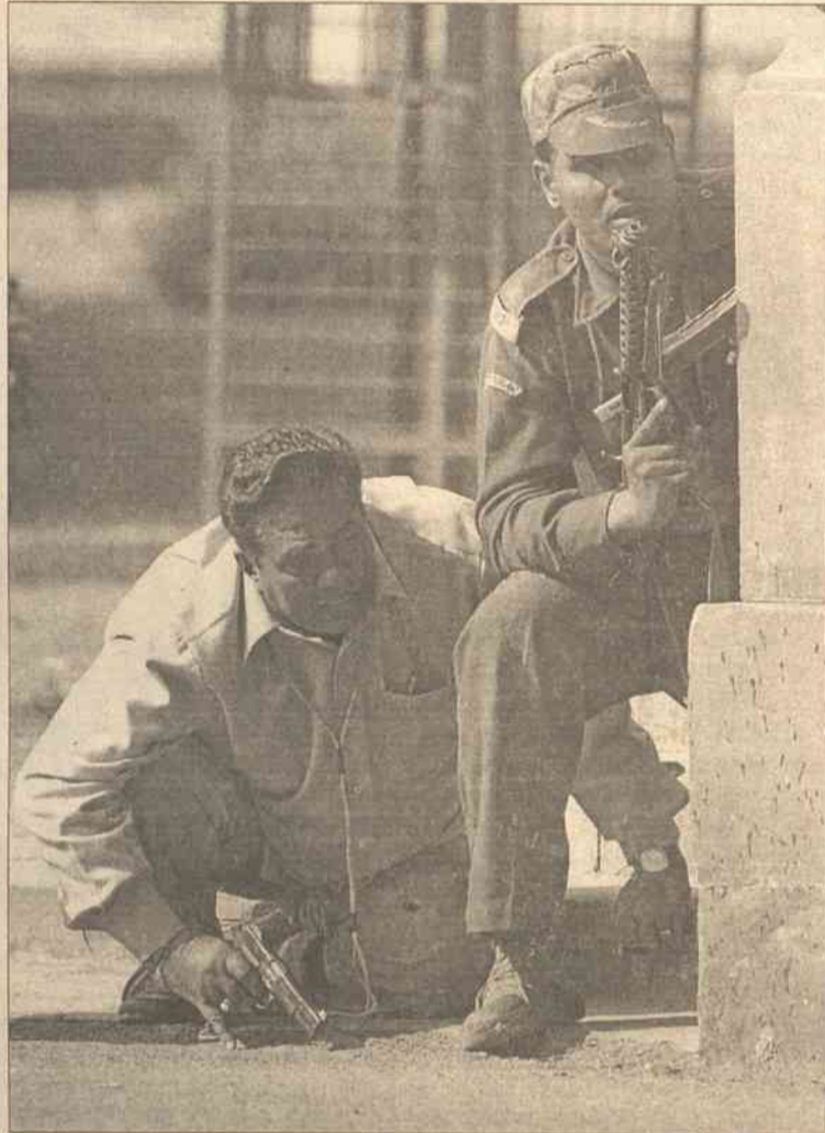
W strzelaninie, która nastąpiła po dwóch eksplozjach przed jedną z bram zginęło 12 osób, w tym wszyscy napastnicy

Agencje zwracają uwagę na podobieństwo ataku do październikowego zamachu na parlament prowincji Dżammu i Kaszmiru w Srinagarze. W samobójczym zamachu z użyciem samochodu wyladowanego materiałami wybuchowymi zginęło wtedy czterdzieści osób. Atak przypisuje się separatystom muzułmańskim.