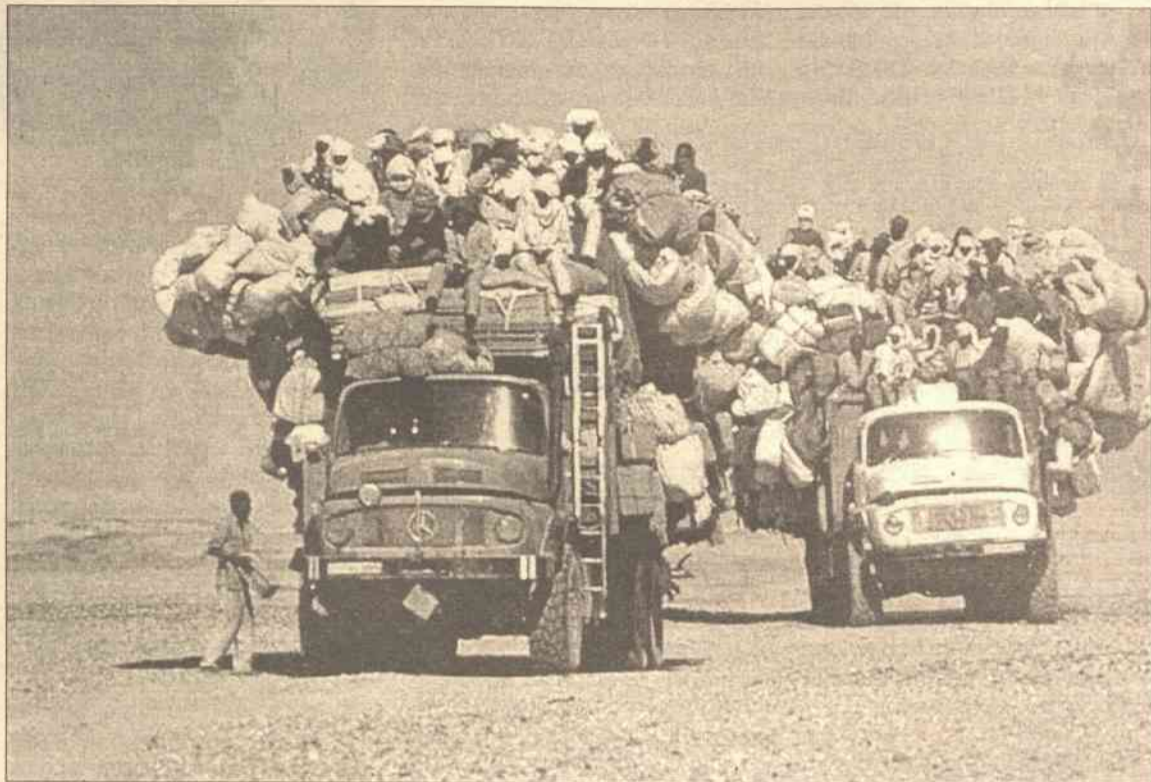
Przygotowując listę nowej administracji brano pod uwagę przede wszystkim konieczność zapewnienia odpowiedniej reprezentacji mozaicy afgańskich grup etnicznych

„Mamy bardzo prostą politykę: entuzjastyczną, lecz warunkową” – powiedział Robertson na konferencji prasowej po spotkaniu z premierem Polski Leszkiem Millerem