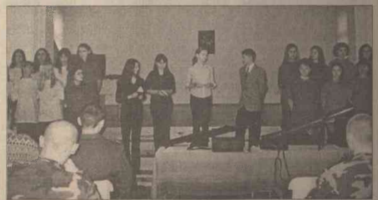
Gości powitano poetyckim dialogiem

Nauczanie o tej tragedii narodu żydowskiego powinno odgrywać szczególną rolę w edukacji młodzieży. Wielowiekowe dzieje obecności Żydów na Litwie, przerwane tak drastycznie przez Holocaust, obowiązują nas do zachowania pamięci o naszych współobywatelach. W tym celu nauczyciele historii i uczniowie klas starszych zorganizowali konferencję pt. „Holocaust – kryzysem cywilizacji europejskiej”. Zamierzaliśmy omówić wielowiekową historię Żydów oraz złożyć hołd wszystkim znanym i nieznanym bohaterom, którzy w obliczu śmierci walczyli w gettach, obozach i na froncie, a także cichym ofiarom, ludziom, co