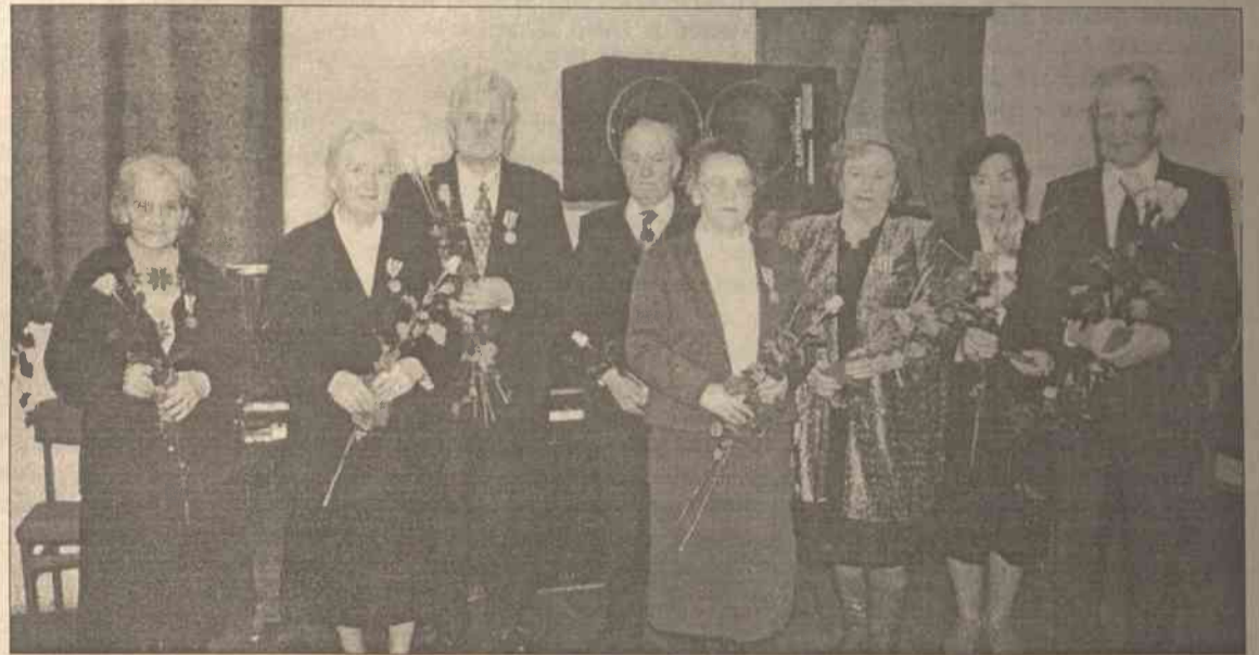
Seniorzy pracy pedagogicznej na rzecz szkolnictwa polskiego, nagrodzeni zaszczytnym medalem