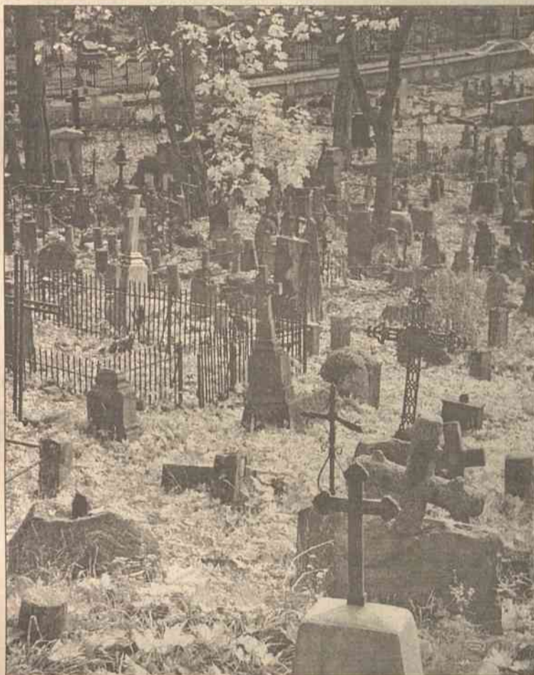
Obiekt do odnowy wybiórą czytelniczy

– Zostałem wprost urzeczony tempem prac i fachowością – tak pięknie odrestaurowana jest kaplica. A jako rodak jestem szczęśliwy, że udało się poznaniakom coś zrobić dla tego cmentarza-pomnika, przesiąkniętego pięknymi kartami