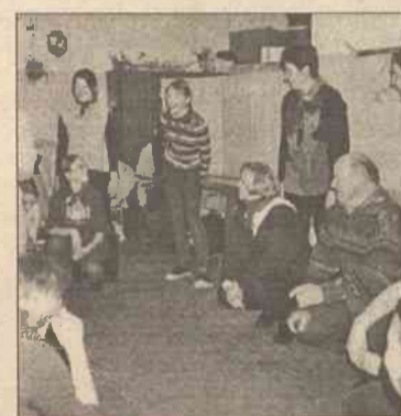
Oby nasze dzieci pozostały jak najdłużej wierne treściom moralnym

braterska i przyjazna atmosfera i wspólnie przeżywane przygody, ale także lekcja zaradności, gospodarności, odpowiedzialności za słowa i czyny, przyzwyczajanie się do pełnienia dobrych uczynków, dbanie o sprawność i zdrowie, a także radość z dobrze wykonanych zadań. Żyjemy dziś w ciężkich czasach, które obrotają zwątpieniem, niesprawiedliwością, w których często nie znajdujemy odpowiedzi na wiele pytań, kiedy za pomocą współczesnych środków przekazu w atrakcyjny sposób podaje się mnóstwo demoralizujących informacji, kuszących najbardziej młodzież, która szuka rozrywki.