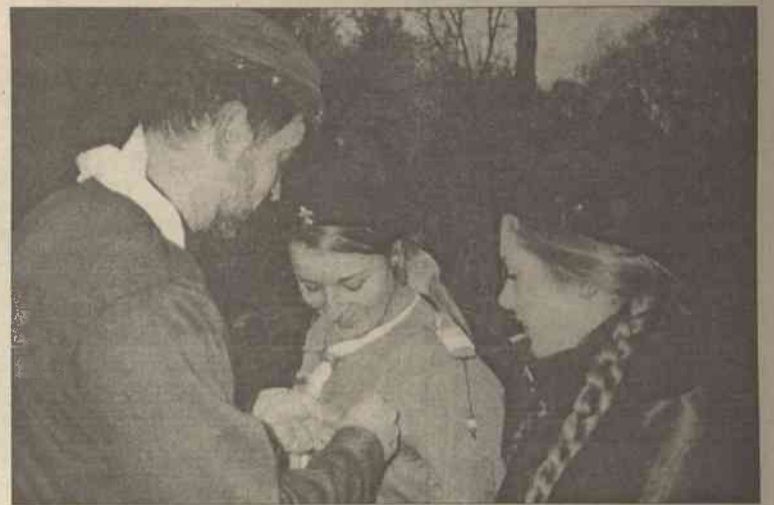
Po złożeniu Przyrzeczenia Harcerskiego harcerz czy harcerka na świat patrzy innymi oczyma