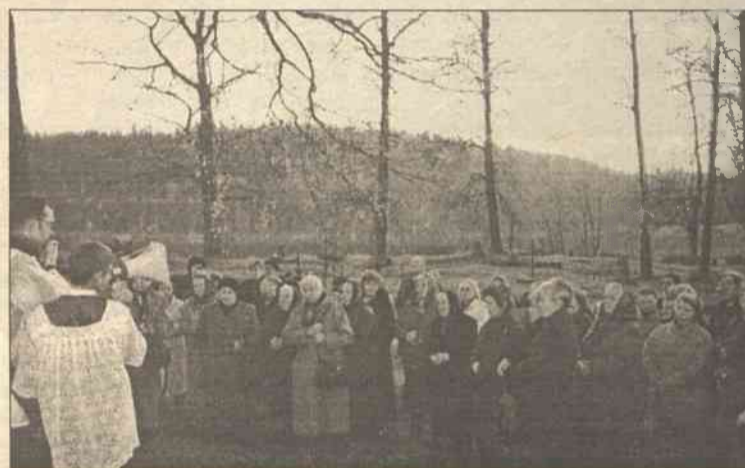
Po raz pierwszy od czasów powojennych zebrała się tu w biały dzień grupa parafian

nowili nagrobek śp. Andrzejewskich, a nieopodal mieszkająca rodzina zobowiązała się doglądać ten grób.