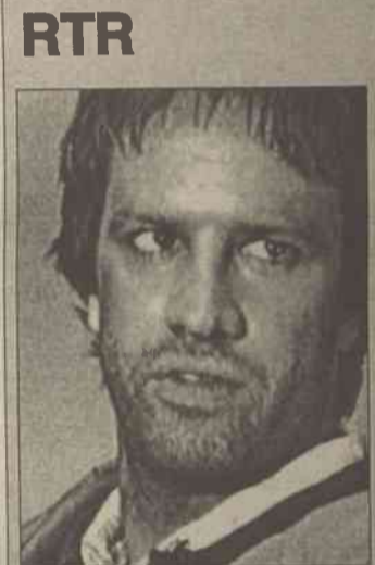
23.40 Góral-3. Ostatni wymiar