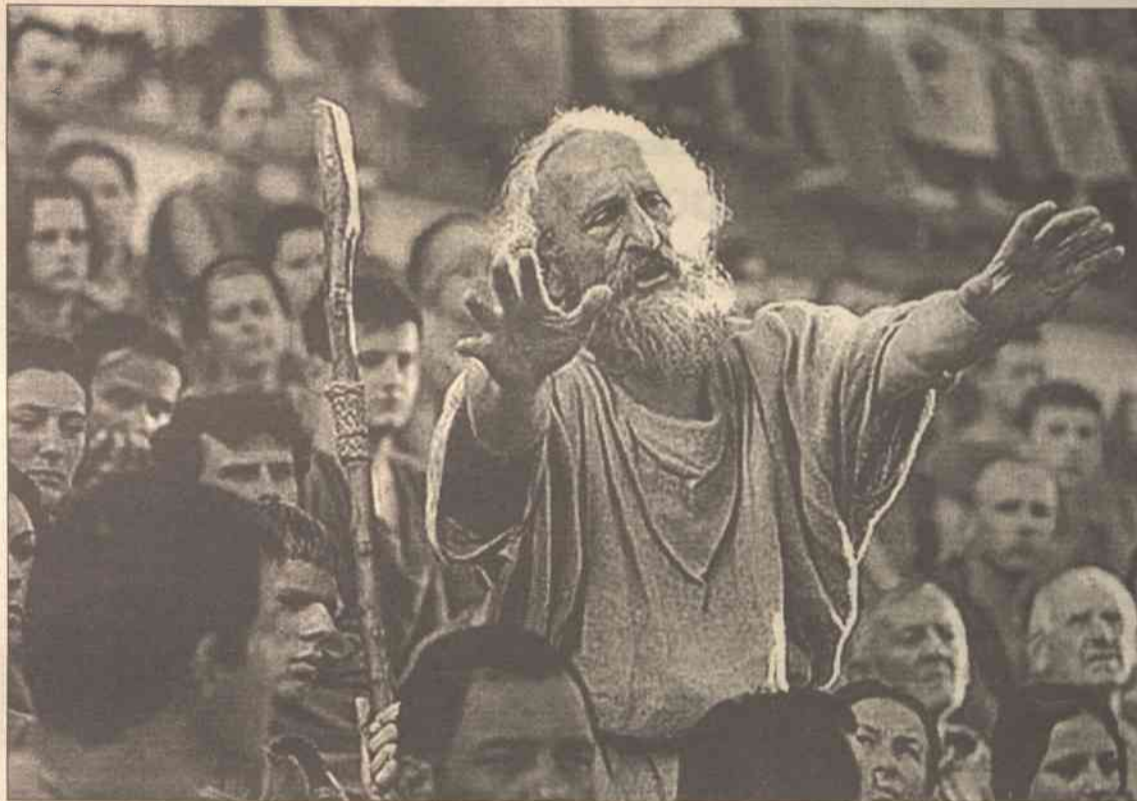
Film ten będzie oglądać widz wileński

W roku bieżącym IP zaprasza jeszcze na koncerty muzyki Paderewskiego, z okazji jubileuszu wielkiego Polaka: 7 grudnia w Filharmonii Kowieńskiej, 19 grudnia w Wilnie, w Muzeum Sztuki Stosowanej (d. Arsenal). Utwory wybitnego kompozytora zagra pianistka Švies Čepauskaitė, absolwentka Litewskiej Akademii Muzycznej i Akademii w Warszawie, dla miłośników polskich imprez znana jako