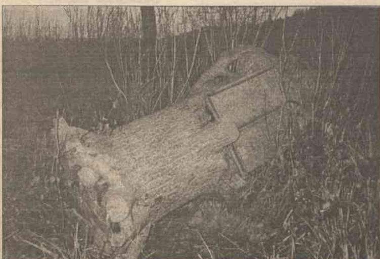
Podnieść do życia stare zapomniane pomniki, które nadwerzęzył czas