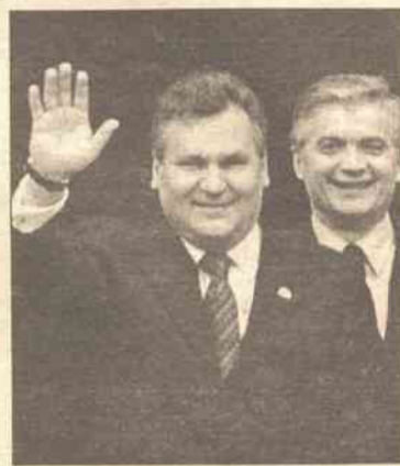
Laureat „Pojednania”

wój stosunków dwustronnych i polepszenie wizerunku Litwy w Europie Zachodniej”. Przedstawiciele fundacji zamierzają wręczyć prezydentowi Kwaśniewskiemu odznaczenie w Warszawie w okresie Świąt Bożego Narodzenia. W poprzednich latach nagrody „Santarves” zostały przyznane m.in. byłemu prezydentowi kraju Algirdasowi Brazauskasowi, nie żyjącemu już kardynałowi Vincentasowi Sladkevicziusowi, litewskiemu poecie Justinasowi Marcinkeviciusowi i innym zasłużonym obywatelom Litwy. (PAP)