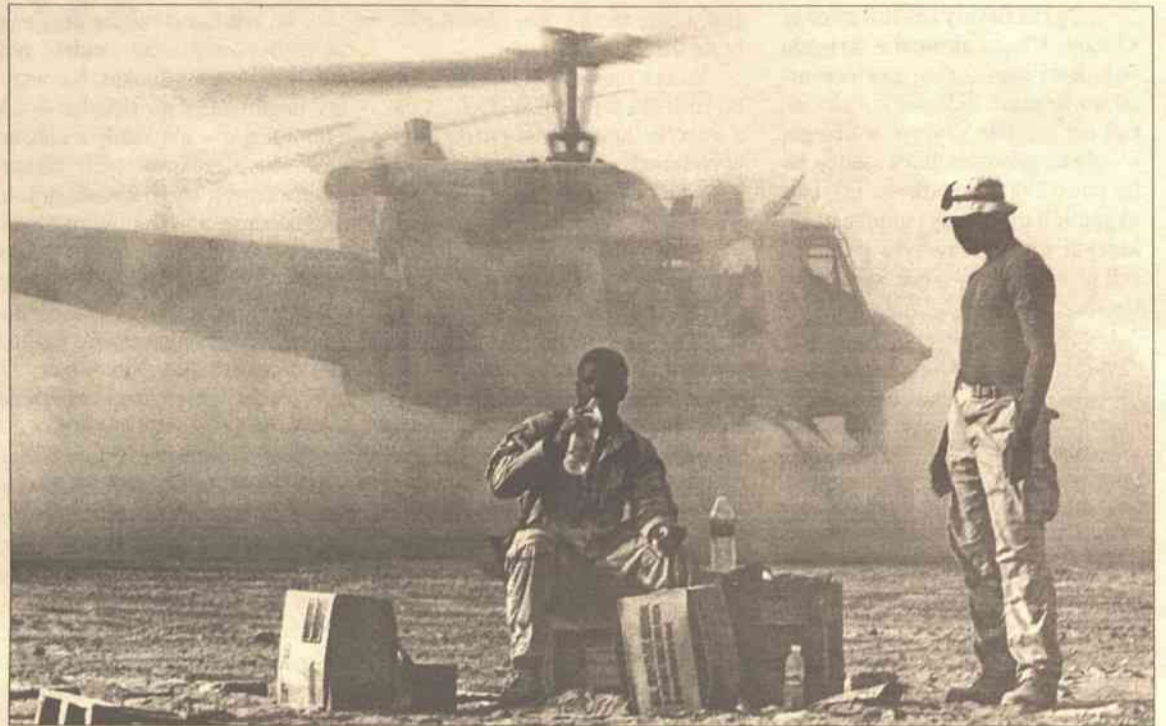
Agencja AIP twierdzi, że amerykańska grupa liczy około dwudziestu komandosów, przerzuconych w rejon Dżalalabadu dwoma śmigłowcami

Powszechnie sądzi się, że właśnie tutaj ukrył się wraz z oddziałami Al-Ka-idy poszukiwany przez Amerykanów saudyjski terrorysta Osama bin Laden, podejrzany o zorganizowanie wrześniowych zamachów w USA. Amerykańskie dowództwo od kilku dni utrzymuje,