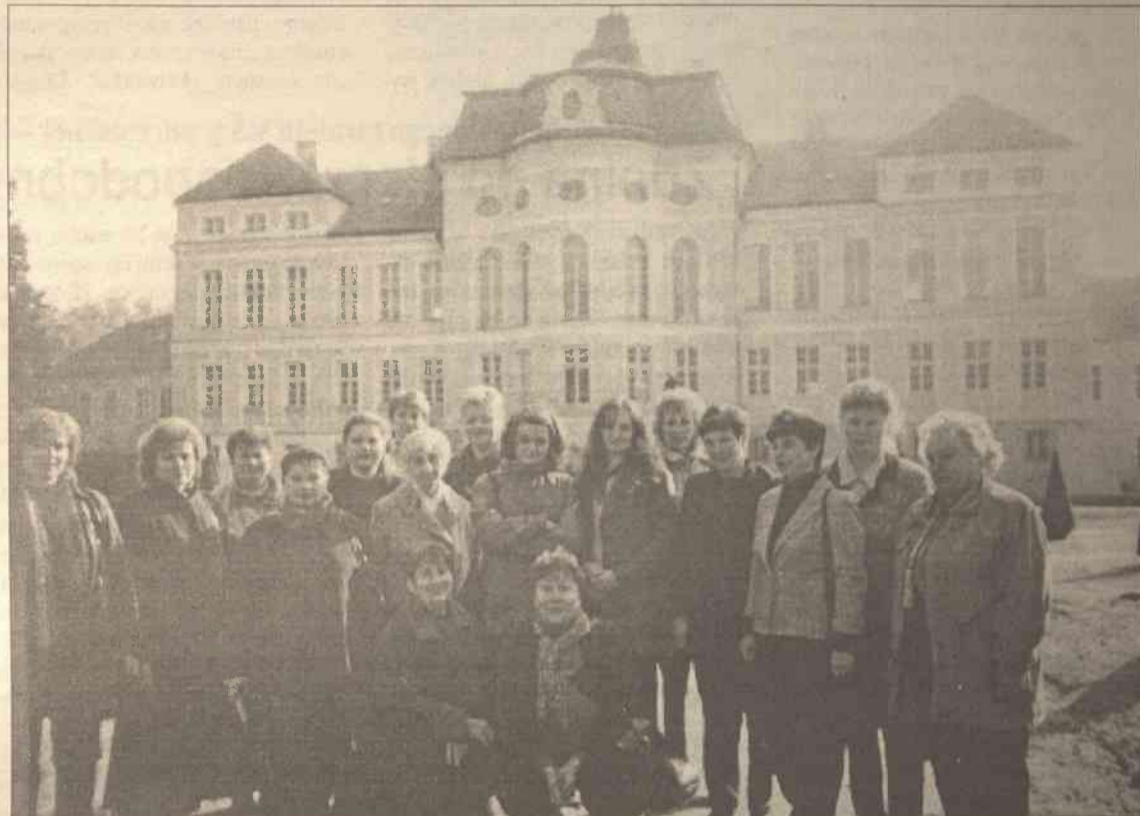
Do wspólnego zdjęcia stanęli nie tylko nasi