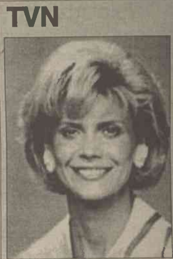
21.45 Ukryta prawda