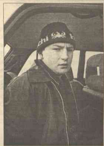
ny najpierw chował się w piwnicy jednego z domów, później u „bomżów”...

W sobotę „upolował” Jewgienija i wtedy zawiadomił funkcjonariuszy. Nie od razu jednak udało się go złapać, ponieważ podejrz-