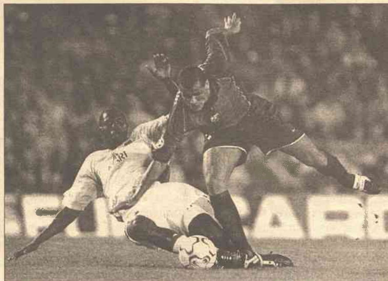
Linia obrony Olympique, zbyt często dopuszczająca napastników Barcelony do podań z głębi pola, była najsłabszą formacją drużyny z Lyonu

Wyniki jazdy ind. na czas juniorów (19,2 km): 1. Juergen van den Broeck (Belgia) 27.28,30, 2. Aleksandr Kwazuk (Ukraina) 0,44 s straty, 3. Niels Scheuneman (Holandia) 0,78, 4. Thomas Loevkvist (Szwecja) 6, 5. Nikita Jeszkow (Rosja) 18, 6. Witaj Kondrut (Ukraina) 28, 22. Przemysław Pietrzak (Polska) 1.30, 48. Daniel Wieczorek (Polska) 2.56.