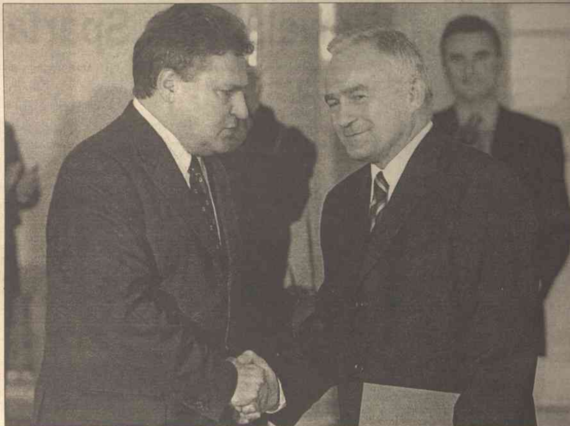
Desygnowany na premiera Leszek Miller uważa, że zaprzysiężenie jego gabinetu jest możliwe już w dniu inauguracyjnego posiedzenia Sejmu

Według Millera, "trzeba zwiększyć rolę opozycji w demokratycznej kontroli nad służbami specjalnymi". Pytany, kto będzie mu pomagał w nadzorowaniu służb specjalnych powiedział, że nie podjął jesz-