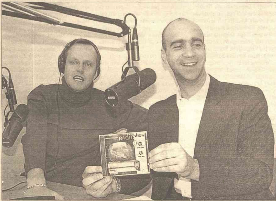
Kochani faceci o niewyparzonych językach znów na fall

Toni początkowo harował w garażu, w Birmingham. Następnie nie-