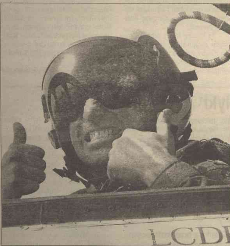
Pentagon zapowiedział wczoraj rano rozpoczęcie nowego etapu kampanii na bazy talibów w Afganistanie. Amerykańska sieć informacyjna CNN twierdzi, iż już "w ciągu najbliższych godzin" na teren Afganistanu wejdą siły lądowe koalicji antyterrorystycznej, by na miejscu prowadzić akcje poszukiwania i niszczenia określonych celów. W siedzibie Pentagonu sekretarz ds. lotnictwa James Roche zapowiedział także zmianę strategii nalotów prowadzonych w Afganistanie – celem ataków mają być obecnie przede wszystkim zgrupowania sił lądowych Talibanu.

Minister Hoon poinformował również, że samoloty brytyjskie od początku operacji w Afganistanie 20-krotnie startowały, wspierając maszyny amerykańskie. W misjach tych uczestniczyły samoloty zaopatrzeniowe VC10 i Tristar oraz samoloty-radary E3-D Sentry – powiedział minister na konferencji prasowej.