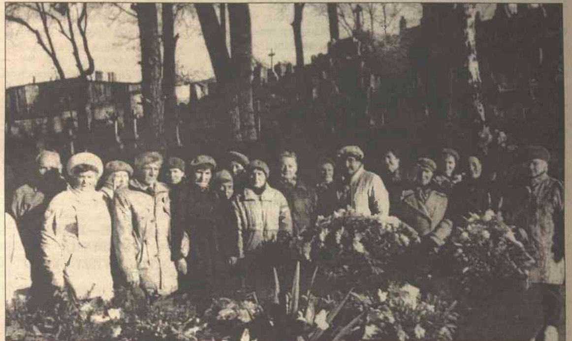
Sluchacze Uniwersytetu, w czasie obchodów świąt narodowych, idą na Rosę, do Mauzoleum Marszałka, aby złożyć wiązanek kwiatów

Nie każda działająca na Litwie organizacja polska ma własny hymn. Polski Uniwersytet Trzeciego Wieku właśnie go posiada. Co więcej, tym samym hymnem zaczynają swój rok akademicki Polskie Uniwersytety Trzeciego Wieku w Grodnie i Lwowie, nawet w Warszawie.