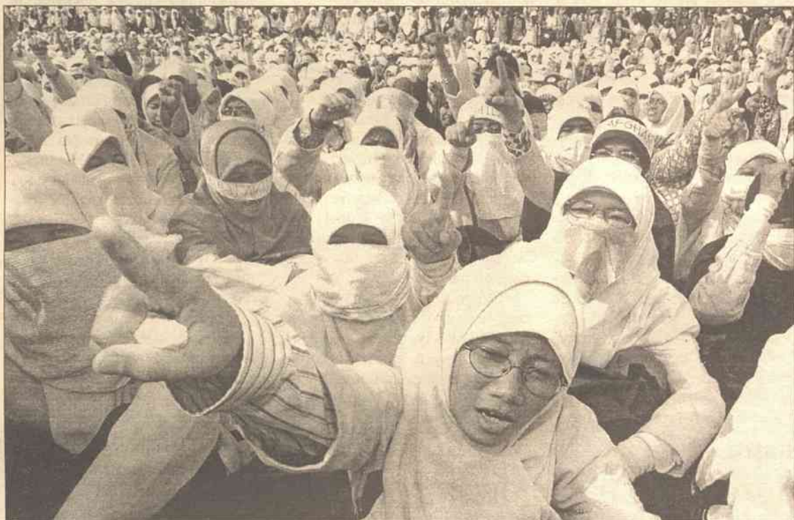
Wczoraj rano główne ugrupowania islamskie Indonezji potwierdziły rozpoczęcie akcji "pogoni" za obywatelami Wielkiej Brytanii i Stanów Zjednoczonych

Indonezja jest największym krajem islamskim świata – wiarę tę wyznaje tu ponad 85 procent 210-milionowego społeczeństwa.