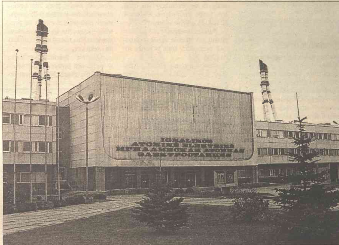
Zdaniem specjalistów ISA, praktycznie nie jest możliwe wyobrazić, co by się mogło stać, gdyby siłownię zaatakował samolot