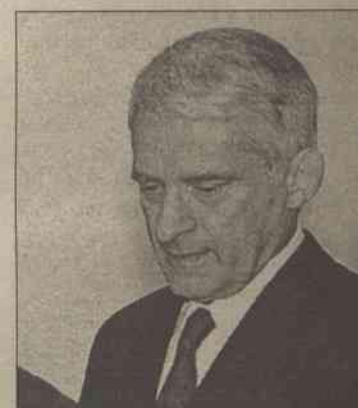
Jeżeli obecny premier Jerzy Buzek wystąpi z inicjatywą spotkania, Miller chętnie ją poprze

– Rząd będzie się oceniać po jego działaniach, ministrów też bę-