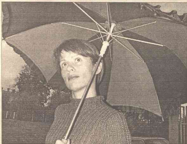
Jesienią kobiety dobierają parasole stosownie do posiadanych płaszczy, zawsze w stonowanych kolorach

Przyszła jesień. Dni stają się krótsze, pogoda gorsza, coraz częściej pada. Dlatego niewiele dziś wyobraża sobie życie bez parasola. Takie smutne wyglądałyby wówczas ulice jesienią, a też latem w ulewny deszcz.