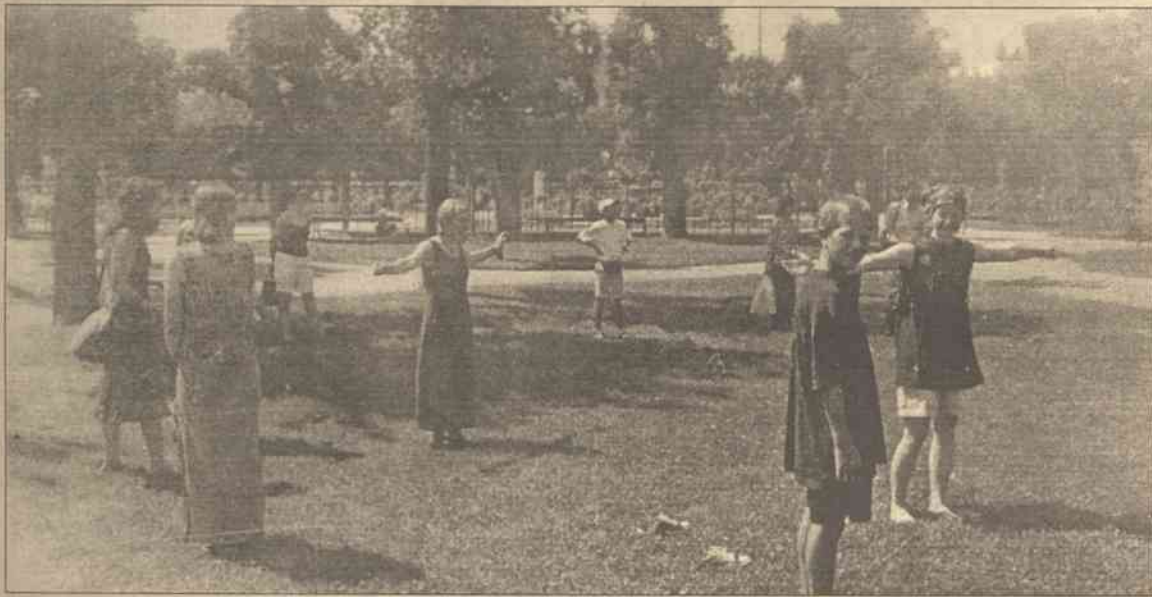
W celu osiągnięcia wyższej kategorii pracuje się razem