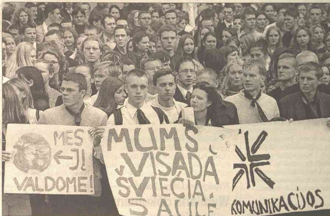
Studenti wytrwale kontynuują walkę o swoje prawa

Po przyjęciu poprawek do Ustawy o studiach wyższych, w budżecie państwowym należy przewidzieć środki pieniężne, z których mogliby skorzystać (wziąć pożyczkę) studenci mający płacić za studia. W innym wypadku może tak się stać, że biedny żak nie będzie miał skąd pożyczyć pieniędzy na naukę i zostanie zmuszony do zrezygnowania ze studiów. W tym roku za studia płaci 30 proc. wszyst-