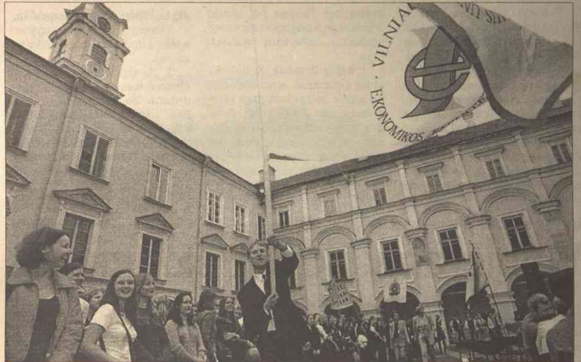
Im bardziej prestiżowy kierunek, tym cena jest „okazalsza”