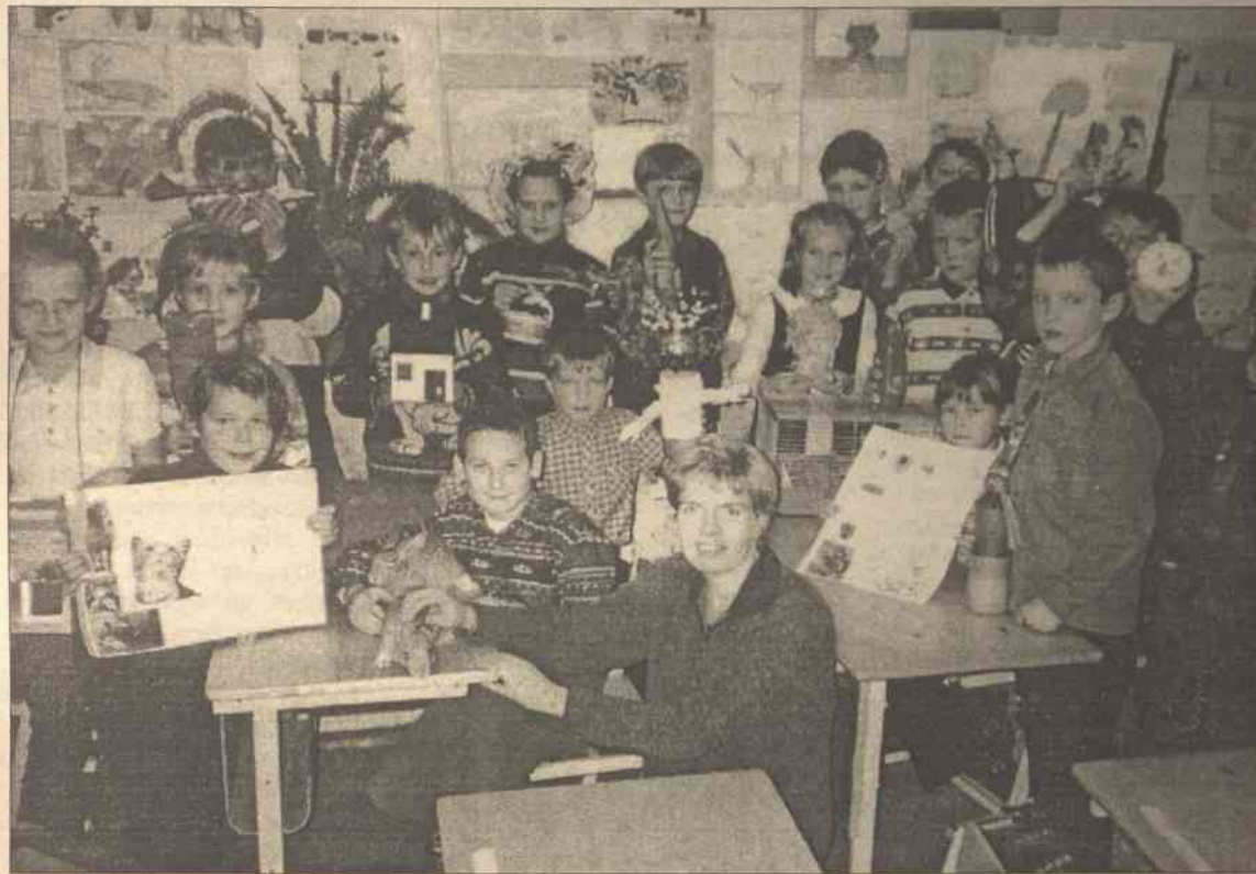
A to już cała grupa z nagrodami