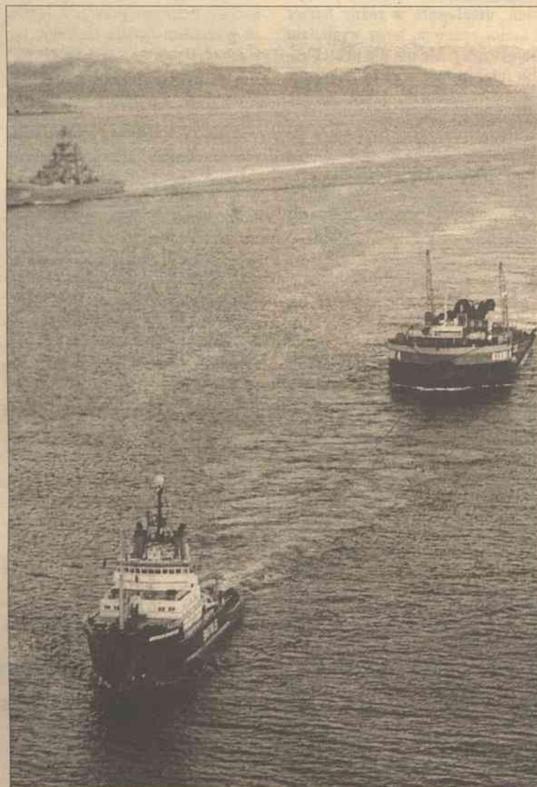
W asyście okrętów wojennych barka „Gigant-4” z podczepionym wrakiem okrętu podwodnego „Kursk” wchodzi do Zatoki Kolskiej

Barka „Gigant-4” z podczepionym wrakiem okrętu podwodnego „Kursk” dotarła wczoraj do Zatoki Kolskiej i czeka na końcową już fazę operacji.