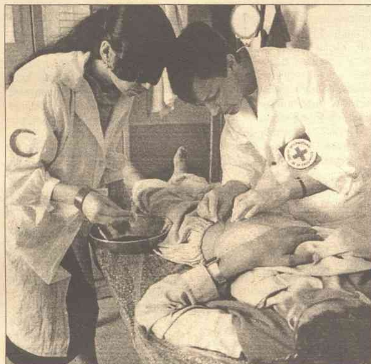
Ruch Czerwonego Krzyża i Czerwonego Półksiężyca dąży do ochrony życia i zdrowia ludzkiego, jak również do poszanowania godności ludzkiej

Litewski Czerwony Krzyż jest organizacją społeczną i utrzymuje się z datków wolontariuszy i sponsorów, pieniądze przydziela też rząd... – Jednym z ogniw Czerwonego Krzyża są pielęgniarki, opiekujące się samotnymi i chorymi osobami. Do niedawna na Litwie było 110 takich pielęgniarek, obecnie zostało ich zaledwie 20. Rejon wileński miał