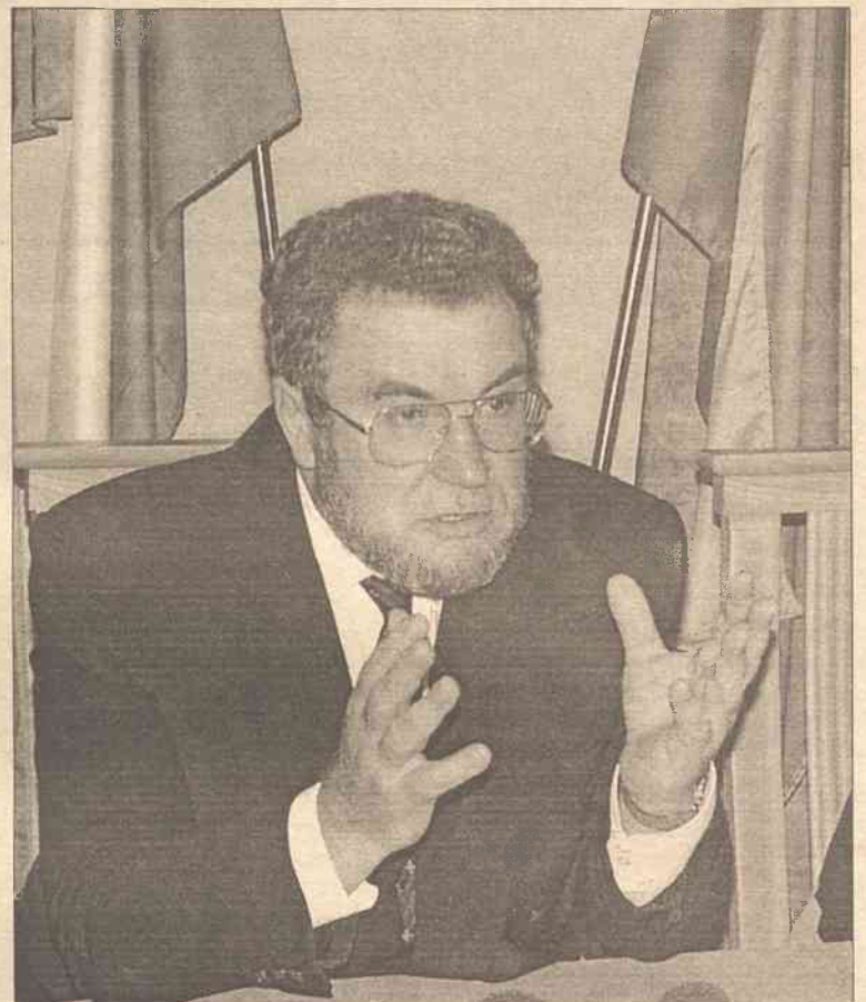
Zdaniem ambasadora Zubakowa, przeszkodą w ratyfikowaniu umowy o litewsko-rosyjskiej granicy państwowej jest ustawa o kompensacie szkód wyrządzonych Litwie przez 50-letni okres panowania radzieckiego

Wczoraj podejrzany o to przestępstwo Ormianin, sam się zgłosił