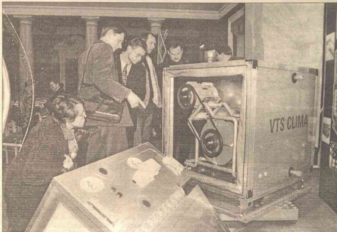
Urządzenia VTS CLIMA są oparte na najnowszych technologiach