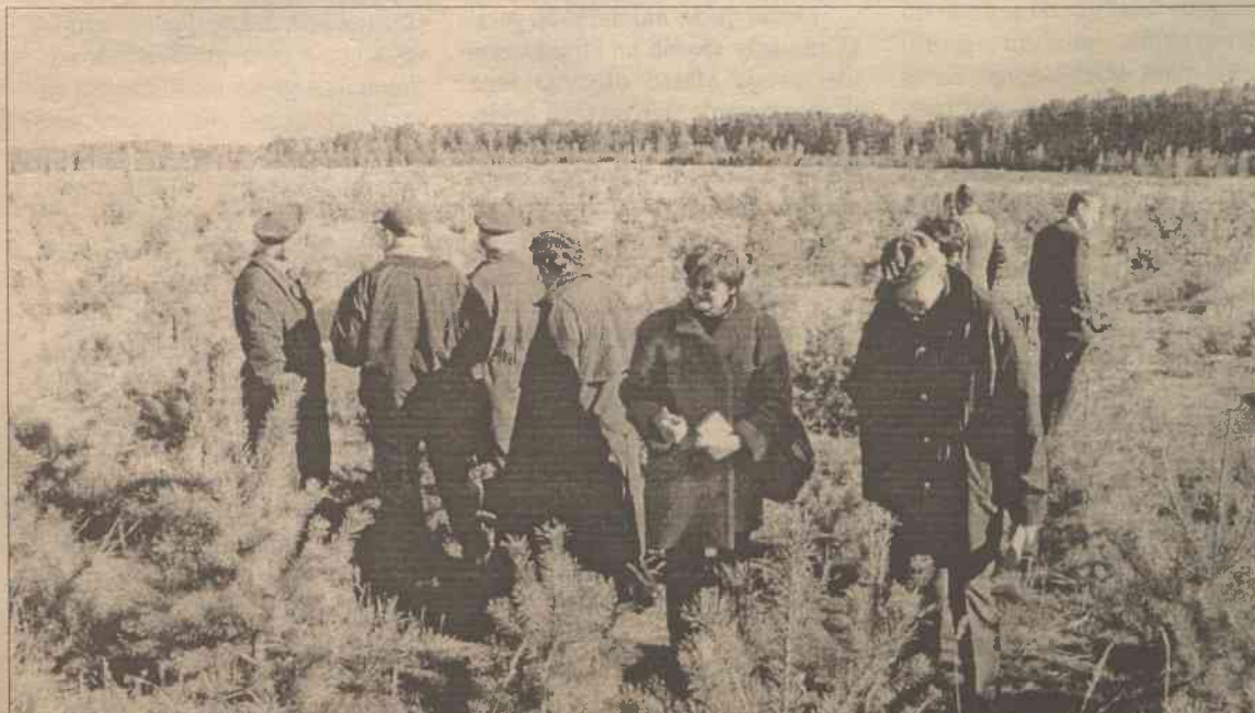
Dzisiaj na „polu durniów”, poligonie wojsk pancernych, zielenią się dorodne sosenki