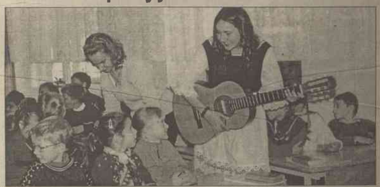
„Wie heil!!!!!! t du?” – jedenastoklasiści w ludowych strojach niemieckich prowadzą pogadankę w jęz. niemieckim z maluchami