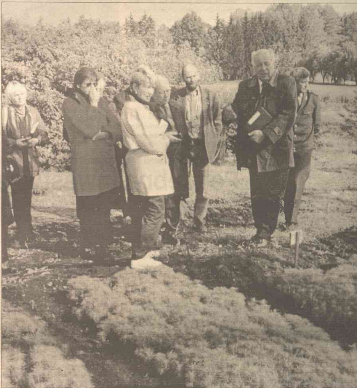
Pozornie zamknięte dla otaczającego świata środowisko leśniczych i gajowych, powitało nas, mieszcuchów dalekich od problemów leśnictwa, z niebywałą otwartością i gościnnością.

W Kazlų Rūdzie, miasteczku, o którym, wyznajmy to sobie, wiemy nie za wiele, prawie każda rodzina jest związana z lasem. Zbieranie jagód i grzybów żywi ludzi, którzy ostatnio stracili pracę. Las jest skromnym, ale stałym źródłem dochodu dla osób zatrudnionych w miejscowym nadleśnictwie i leśnictwach. Jest też miejscem ustawicznym praktyk i doświadczeń studentów Instytutu Leśnictwa w Kownie, miejscem wielkich nadziei i eksperymentów litewskich naukowców. (Dokończenie na str. 9)