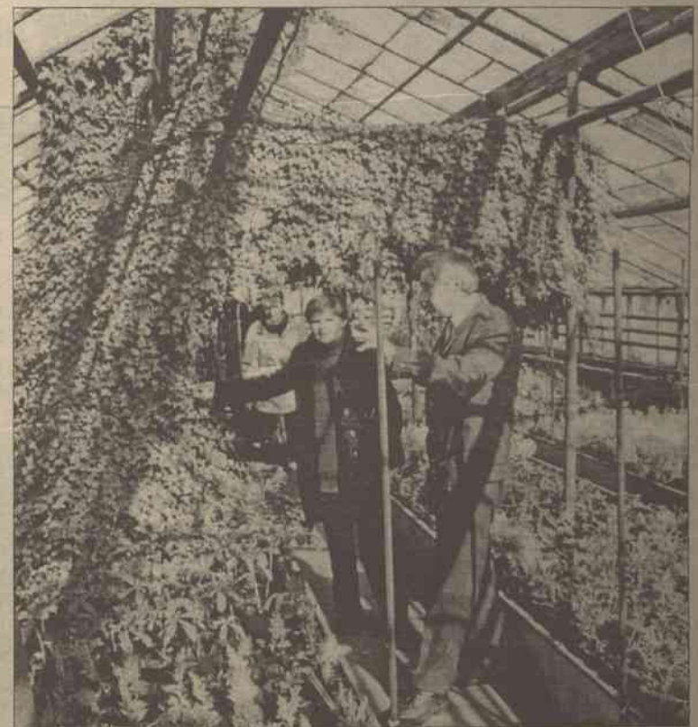
W szkółce hodowane są sadzonki drzew i krzewów egzotycznych