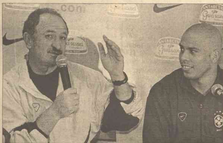
Kontuzja napastnika reprezentacji Brazylii i włoskiego klubu piłkarskiego Inter Mediolan – Ronaldo, nie jest groźna i może być wyleczona w najbliższym czasie. Naciągnięcie mięśnia uda nie jest poważne i piłkarz może rozpocząć rehabilitację już za kilka dni. Ronaldo pojawił się w obozie treningowym reprezentacji, gdzie Brazylija szykuje się do meczu eliminacyjnego do mistrzostw świata z drużyną Chile i rozmawiał z selekcjonerem Luisem Felipe Scolari. Ronaldo stwierdził jednak, że kontuzja nie pozwoli mu zagrać w najbliższym meczu reprezentacji