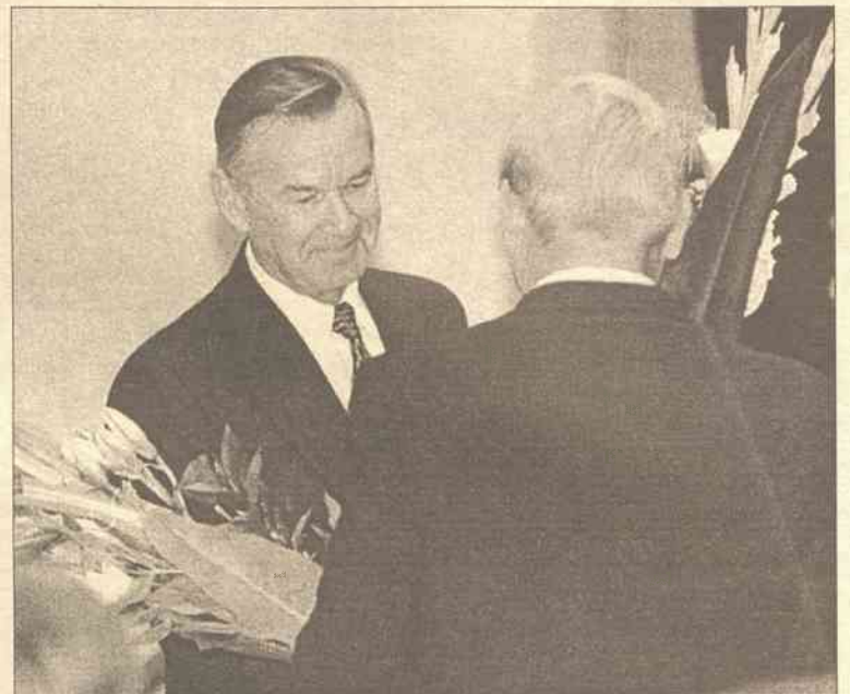
Kolekty sejmowi gratulują Kraujelisowi nominacji na ministra rolnictwa

W przekonaniu Adamkusa, minister rolnictwa powinien ściśle współpracować z ministrami opieki społecznej i gospodarki oraz podejmować wspólne niezwłoczne kroki na rzecz rozwoju drobnej przedsiębiorczości rodzinnej na wsi oraz zmniejszenia bezrobocia.