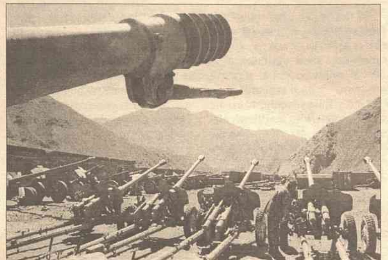
Eksperti mówią, że oczyszczenie kraju z ludzi bin Ladena i twardego talibów potrwa miesiące

Putin powiedział ponadto, że Rosja wprowadziła już z poszczególnymi