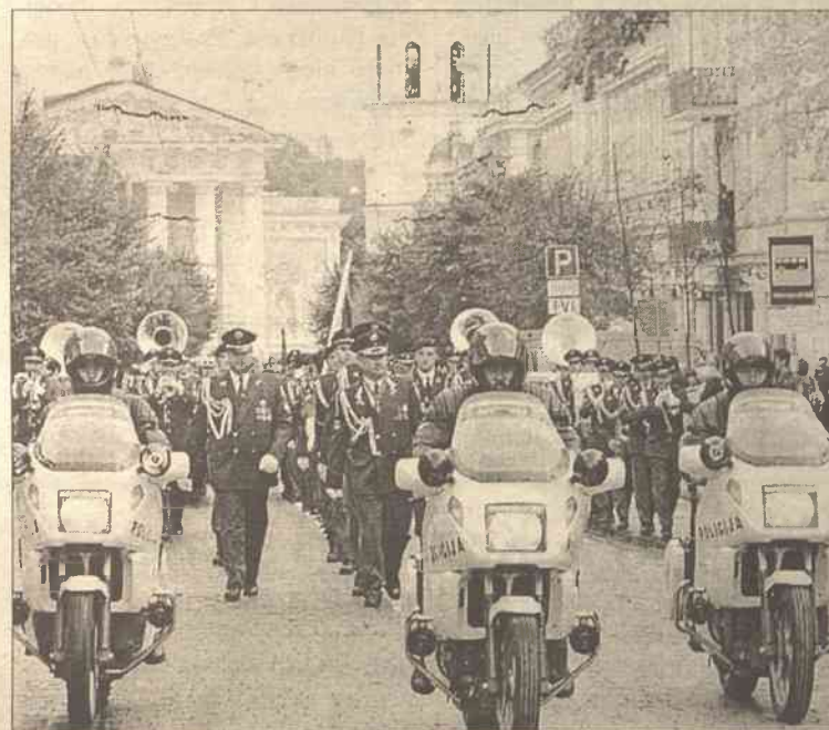
Świąteczne szeregi policji napawają dumą władze państwa