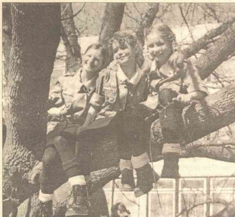
Zapraszamy wszystkie drużyny do wzięcia udziału w konkursie fotograficzno - rysunkowym pt. „Czym pachnie lato?”. Prace można nadsyłać na adres redakcji albo przekazać bezpośrednio twórcom „WGH”. Na początku listopada nastąpi rozwiązanie konkursu. Przewidywane są wartościowe nagrody. Dziś umieszczamy zdjęcie 19 WDH „Pasieka” pt. „Ad adastra...”

20 lipca 2001 roku, Czerwonka (List do rodziców dł Elżbiety Bumbul z 19 WDH „Pasieka”)