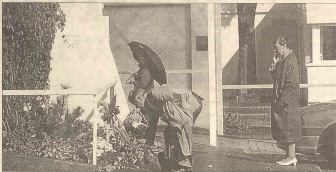
Wtorkowe zamachy terrorystyczne w USA wstrząsnęły światem. Przy ambasadach USA w wielu państwach ludzie składali kwiaty, zapalali świece, modlili się za dusze niewinnie zabitych. Mieszkańcy Litwy również nie zostali obojętni wobec tragedii Stanów Zjednoczonych. Na zdjęciu widzimy składanie kwiatów przed ambasadą USA w Wilnie