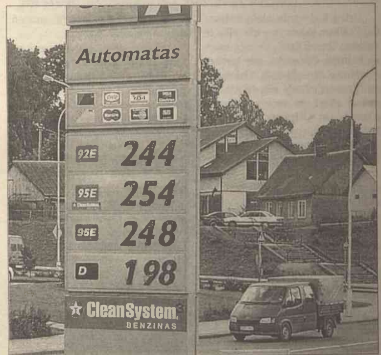
Wczoraj na UnoX, dzisiaj...