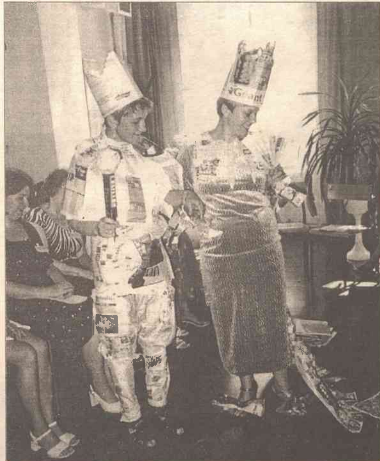
Zajęcia były doskonale przemyślane i zaplanowane przede wszystkim z myślą o dzieciach

Słuchaczka kursu Andżelika Jachimowicz Troki