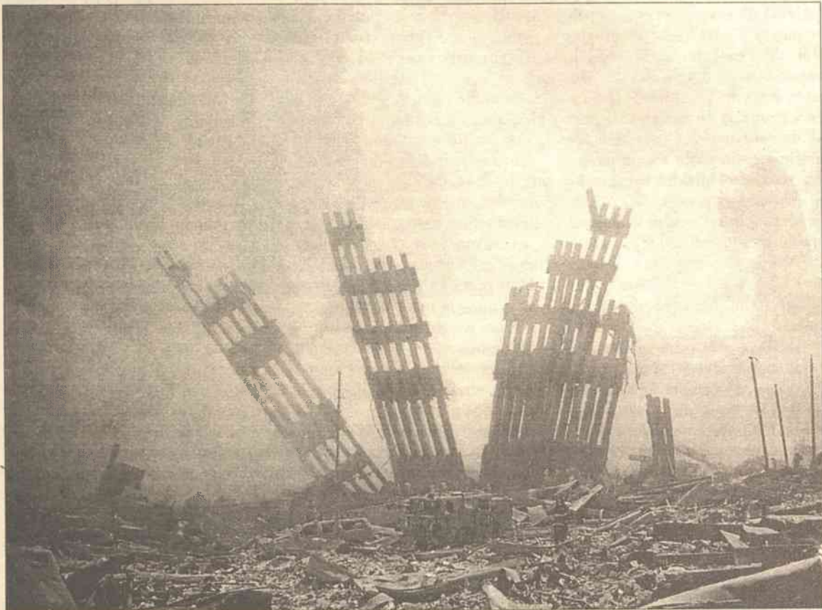
„Terrorystyci mogą naruszyć fundamenty najwyższych budynków, ale nie naruszą fundamentów Ameryki“ – powiedział prezydent George W. Bush

W związku z tragedią w USA premier Szwecji Goeran Persson podjął decyzję o przełożeniu sztokholmskiego szczytu na inny termin – poinformowała w środę Kancela-