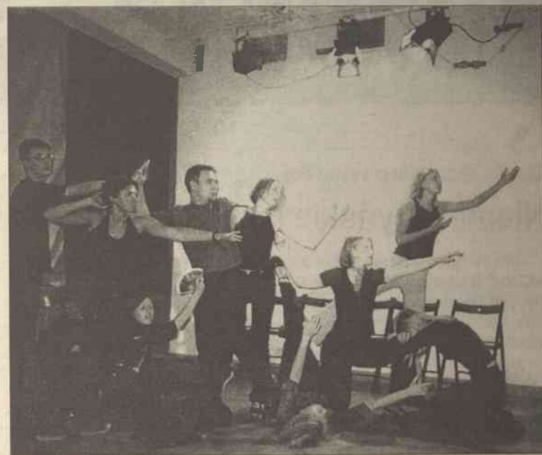
Wszyscy uczestnicy zgłaszali swoje propozycje

Byliśmy na koncercie fortepianowym w Łazienkach, słuchaliśmy utworów Chopina. Zwiedziliśmy przepiękny park w Wilanowie. Reżyser Teatru Strefa 2. zaprosił rów-