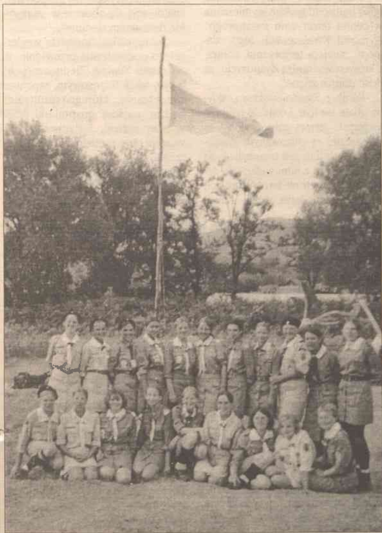
Amazonki w całej swej krasie. Złamały wiele serc...