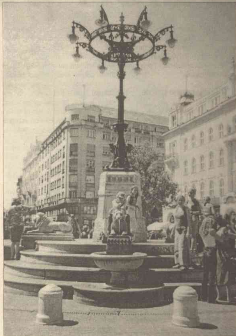
W Budapeszcie nie miałyśmy zbyt wiele wolnego czasu, ale zobaczyłyśmy sporo

Nasza grupa należała do gniazda o nazwie „Złoty Smok” („Golden Dragon”). Ogółem gniazda było pięć, ale nazywały się mniej szlachetnie (np. „Zielony Lew”). Prędko zaprzyjaźniłyśmy się z węgierskimi skautami, czeskimi juna-