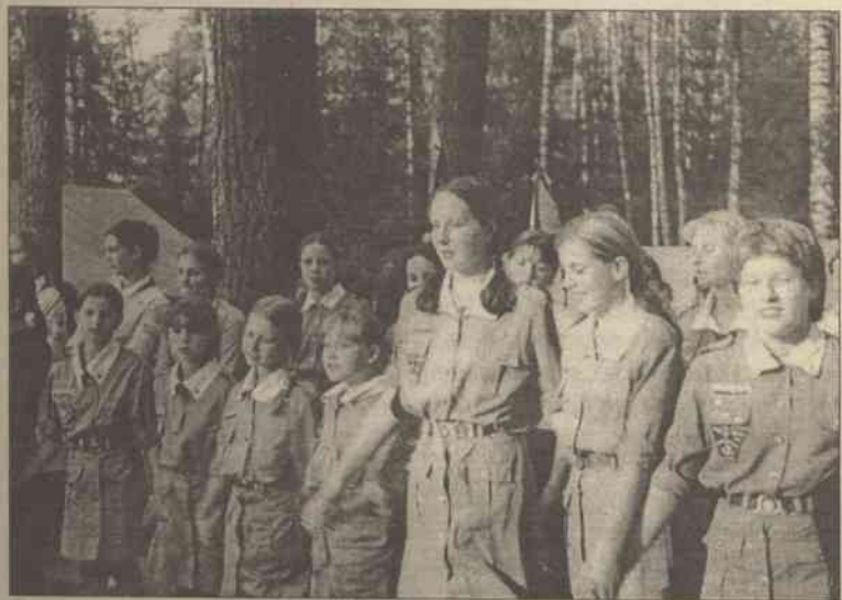
Taki duży, taki mały może na zlocie być!