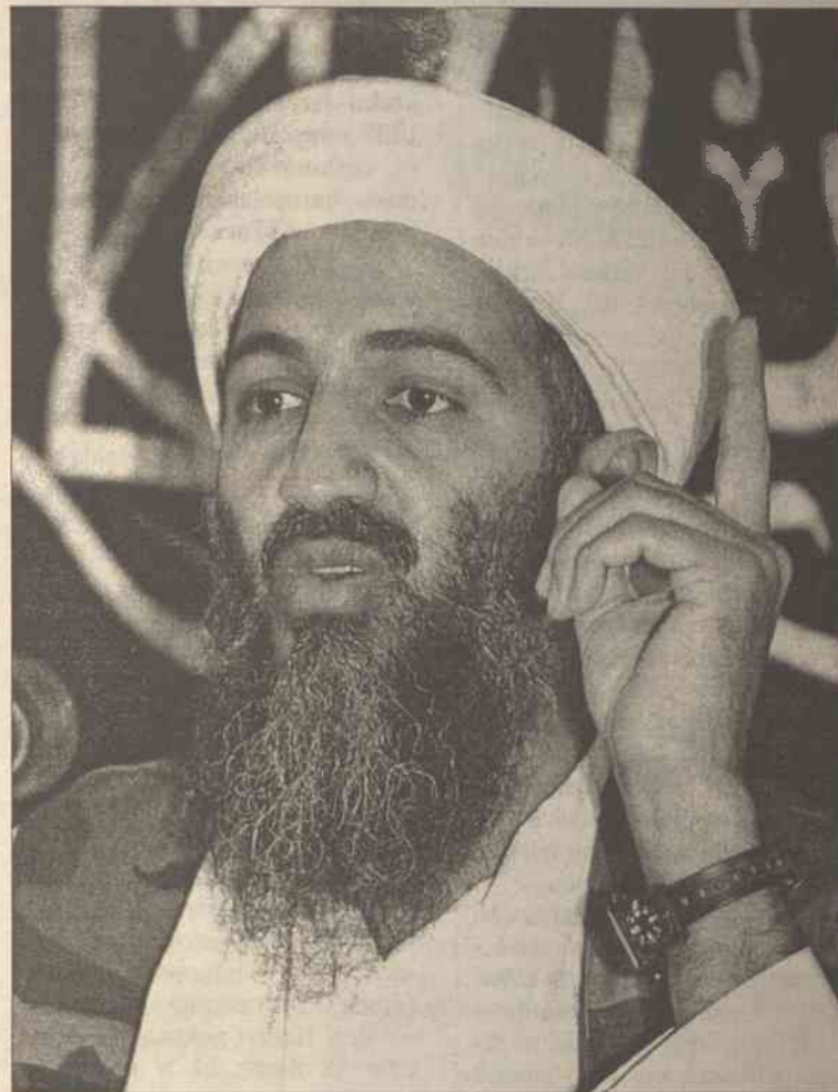
Pełnię władzy nad "Bazą" sprawuje bin Laden, który pełni funkcję emira-generała organizacji

Już w czerwcu stronnicy terrorysty zapowiedzieli przeprowadzenie w ciągu najbliższych tygodni znaczących ataków wymierzonych w "interesy amerykańskie i izraelskie". Wiele zaniepokojenia budzą doniesienia, że bin Laden usiłował kupić na czarnym rynku w Sudanie uran, który mógłby być użyty do wyprodukowania broni atomowej.