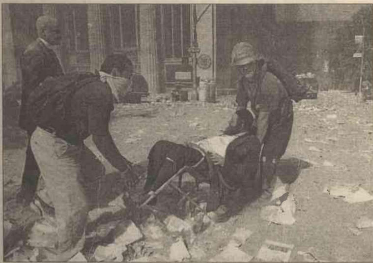
Ekipy ratunkowe całą noc poszukiwały tych, którzy mogli przeżyć pod gruzami World Trade Center

Amerykański finansista węgierskiego pochodzenia przewiduje, iż na rynku Stanów Zjednoczonych, w tym także finansowym, zapanuje zamieszanie, którego rezultatem będzie wejście gospodarki USA w stan recesji. Światowe giełdy wczoraj rano zareagowały na wydarzenia w USA gwałtownym spadkiem notowań – trend ten był szczególnie widoczny na większości giełd azjatyckich.