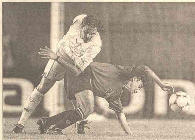
Piłkarze Lazio Rzym (światłe stroje) nie zdołali pokonać tureckiej obrony

W Kijowie po pierwszej połowie Dynamo prowadziło 2:0 i wszystko wskazywało na to, że zdobędzie trzy punkty. Jednak Borussia zdołała uratować remis, a bramki dla niemieckiego zespołu zdobywali dwumetrowy Jan Koller i Marcio Amoroso. Po starciu