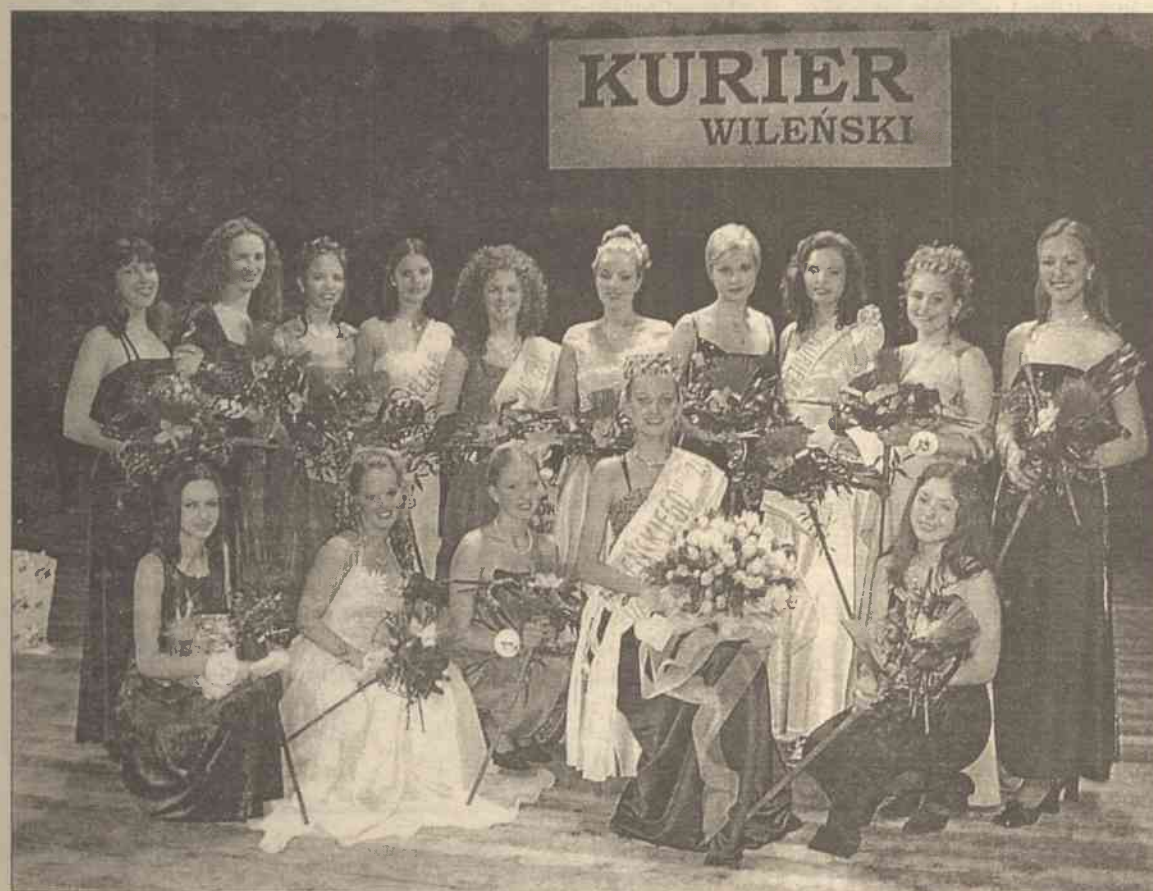
Finalistki konkursu "Dziewczyna "Kuriera" 2000". Jakże będą tegoroczne, zależy od Was!