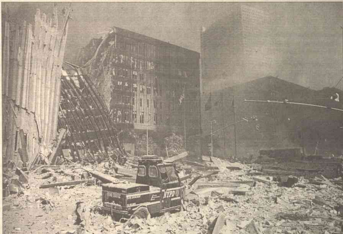
"Jak mogło dojść do tak okrutnych wydarzeń? Ludzkie serce jest przepaścią, z której czasem wylaniają się knowania pełne okrucieństwa, zdolne zniweczyć spokój i życie ludzi" – powiedział papież Jan Paweł II

Giuliani poinformował, że w lokalnych szpitalach pomocy udzielono ok. 1100 osobom. Około dwóch tysięcy rannych, których stan nie był zbyt ciężki, przetransportowano przez rzekę Hudson do New Jersey. Telewizja CNN informuje, że ponad 300 strażaków i 85 policjantów, którzy uczestniczyli w operacji ratunkowej na Manhattanie zaginęło i prawdopodobnie już nie żyje. W Waszyngtonie liczbę ofiar ataku na Pentagon szacuje się na ok. 800.