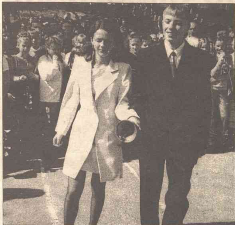
Pierwszy dzwonek brzmi jednakowo — i dla pierwszaków, i dla maturzystów