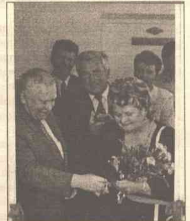
Uroczysty moment – przecięcie wstęgi do nowego gabinetu informatyki

– Cieszę się bardzo, że nowy rok szkolny rozpoczniemy w odnowionej, unowocześnionej szkole. Z wdzięcznością do naszym sponsorom: