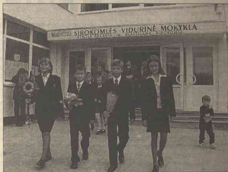
Starsi już w mundurkach szkolnych. Mile ich zaskoczył wygląd szkoły

nego, jak co roku, i tym razem odbyła się na placu Pałacu Uczniów. Jak zawsze, jest to uroczystość wzruszająca każdego, kto