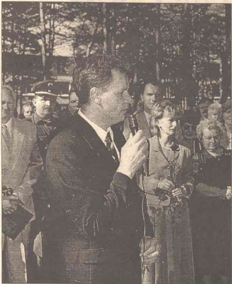
Posel na Sejm Republiki Litewskiej Waldemar Tomaszewski (na zdjęciu po środku) cieszył się, że mieszkańcy Niemenczyna posyłają swe dzieci do szkoły, gdzie językiem nauczania jest język ojczysty, co przysparza im honoru i praktyczności.