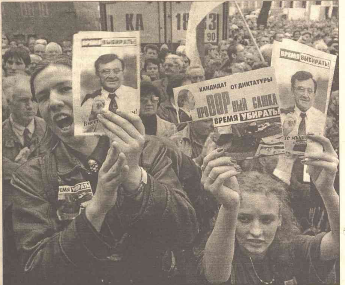
W ubiegłą niedzielę w Mińsku odbył się kilkudziesięcny wiec wyborczy kandydata zjednoczonej opozycji Uładzimir Hanczaryka (na zdjęciu – na plakatach)

W pozostałych 19 proc. czasu zmieścili się wszyscy pozostali kan-