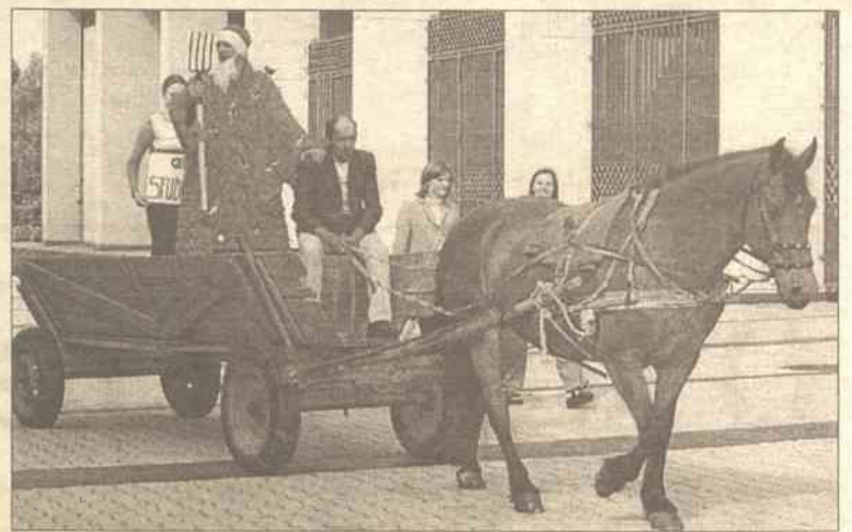
Przedstawiciele studentów stawili się z widłami — znakiem protestu, ale zaznaczyli, że jeszcze z nich nie skorzystają i zachowają na „czarny dzień”

10 dni przed rozpoczęciem debaty sejmowej nad tą nowelizacją przedstawiciele studentów postanowili w sposób oryginalny wręczyć parlamentarzystom prezent — alternatywny projekt nowelizacji ustawy. Konnym wozem pod gmach Sejmu w obronie studentów przybył obudzony z letniego snu Święty Mikołaj z worem prezentów z okazji nowego roku szkolnego. Przedstawiciele studentów stawili się z widłami — znakiem protestu, ale zaznaczyli, że jeszcze z nich nie skorzystają i zachowają na „czarny dzień”. Zamiast wideł posłom podarowano imponujących rozmiarów patyczek do czyszczenia uszu, aby mogli usłyszeć i zrozumieć postulaty studentów. Niestety, w sejmowym pokoju przyjęć nikt nie po-