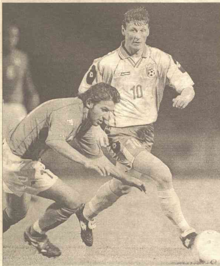
Włosi nie spodziewali się bardzo dobrej postawy reprezentantów Litwy (światłe stroje) i mieli spore trudności z powstrzymaniem ataków piłkarzy naszego kraju

Grupa 9: Albania – Finlandia 0:2 (Teemu Tainio 57, Shefki Kuqi 90); Niemcy – Anglia 1:5 (Carsten Jancker 6 – Michael Owen 12, 49, 66, Steven Gerrard 45, Emile Heskey 74).