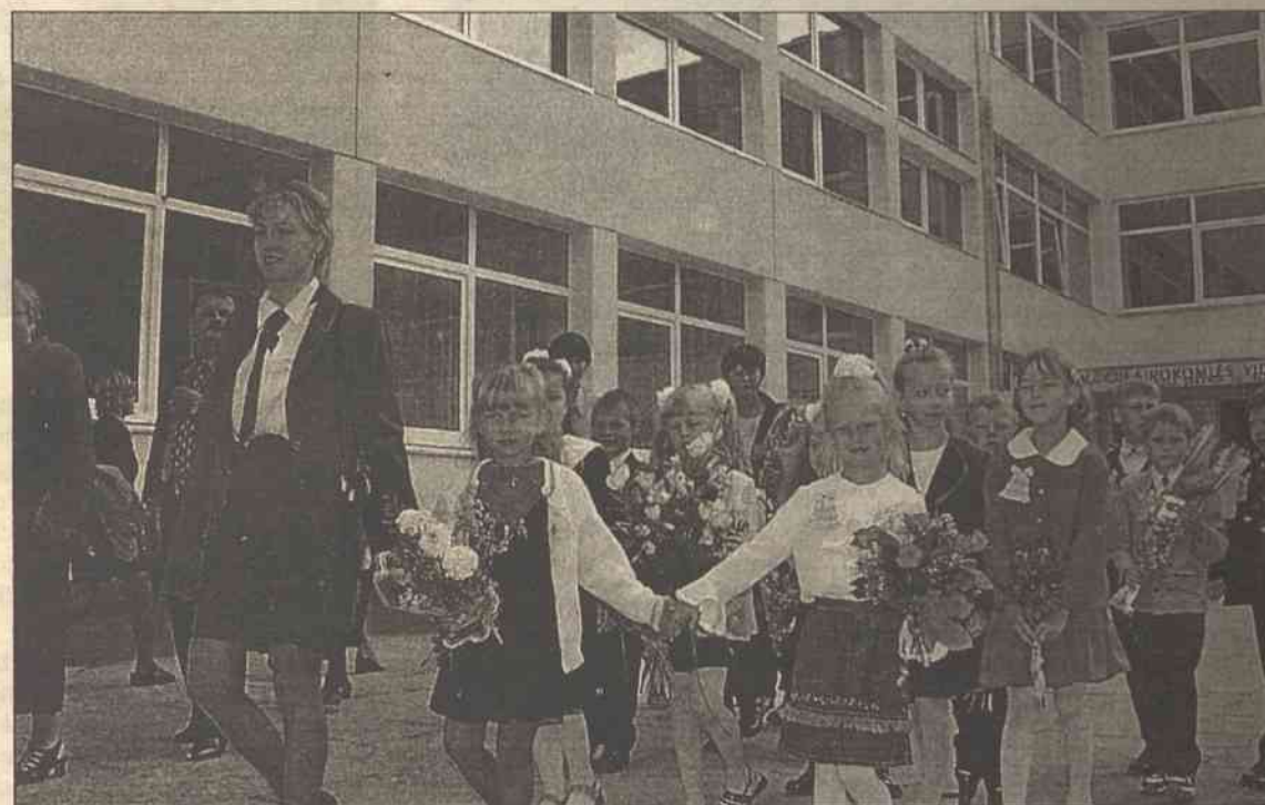
Pierwszaków syrokomłówki trzeba prowadzić za rączkę, bo to nowa dla nich droga