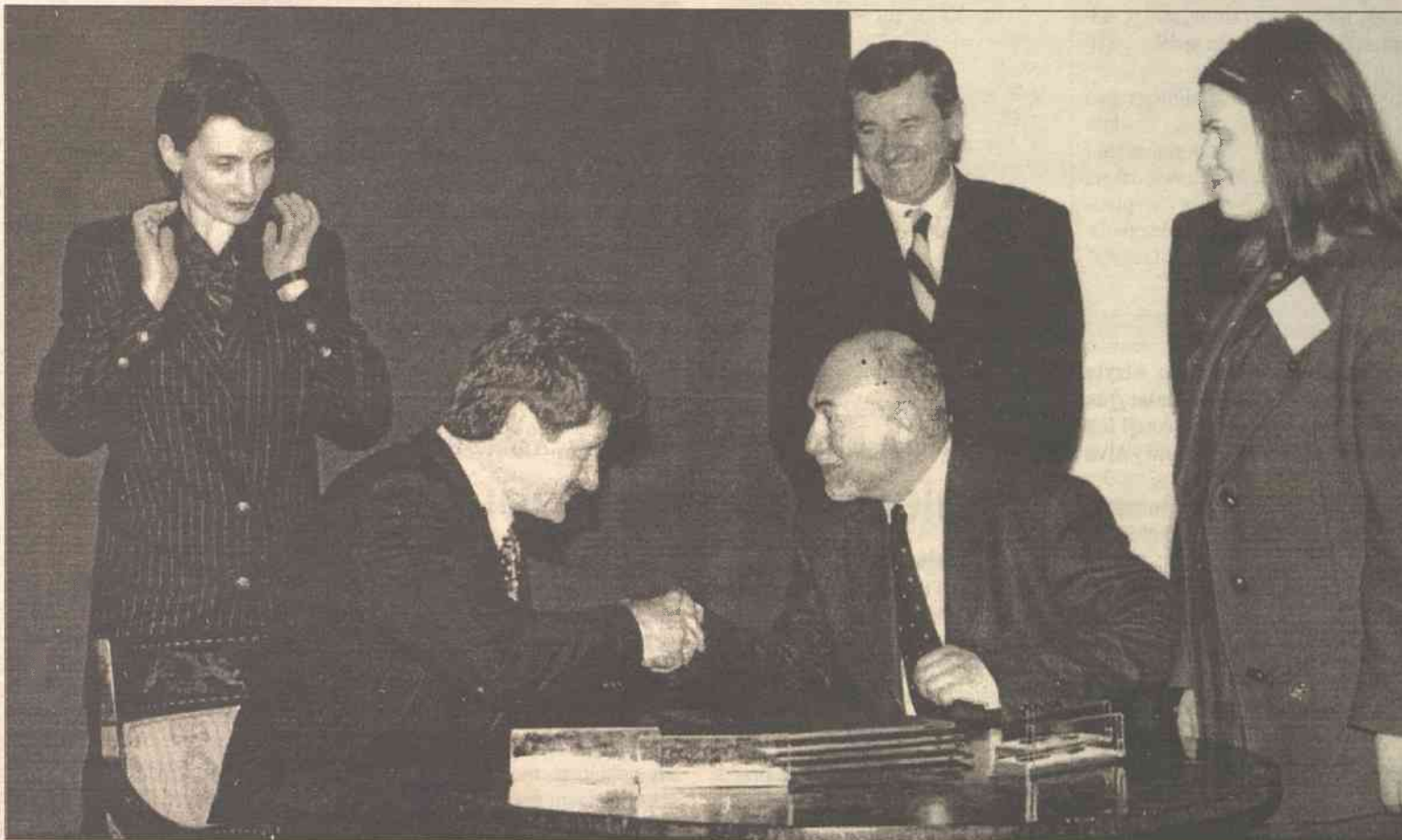
W kwietniu 1999 roku pakiet kontrolny (51 proc. akcji) BTV nabyła telewizja „Polsat”. Kontrakt ten podpisywano z ogromną pompą, właściwą naszym rodakom, w Wilnie, w Muzeum Sztuki Stosowanej

Chyba każdy z nas od pewnego momentu zauważył, że Telewizja Bałtycka już nie jest taka sama, jaką była jeszcze pół roku temu?... Brakuje nam znajomych twarzy spikerów i redaktorów rozmaitych