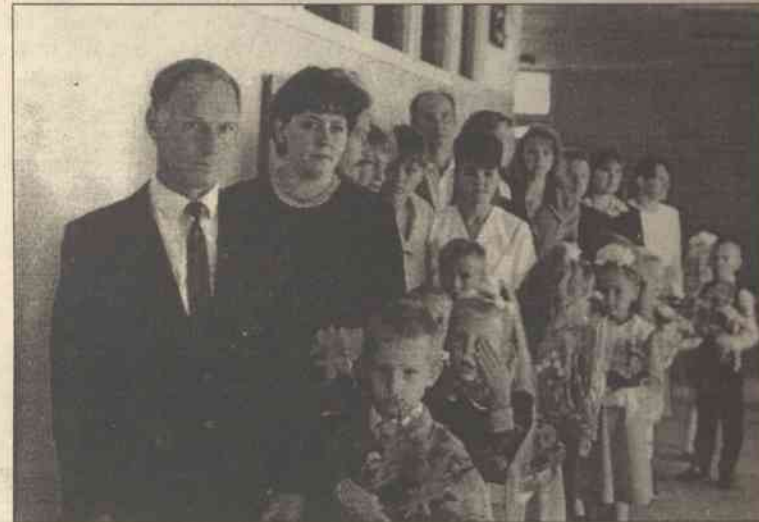
Jeszcze chwila i pierwszacy trzymając mocno za ręce rodziców wejdą do wypełnionej sali, gdzie czekają na nich nauczyciele i koledzy

Gdy w szkole ucichły już dźwięki Pierwszego Dzwonka, uczniowie udali się na Mszę św. do mieszczą-