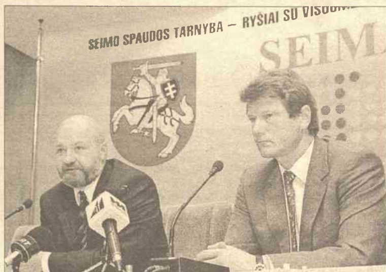
Eugenijus Gentvilas (od lewej) i Rolandas Paksas zaprzeczili insynuacjom o wewnątrzpartyjnym konflikcie między nimi

— Skoro socjaldemokraci wyrzekli się ideologii socjaldemokra-