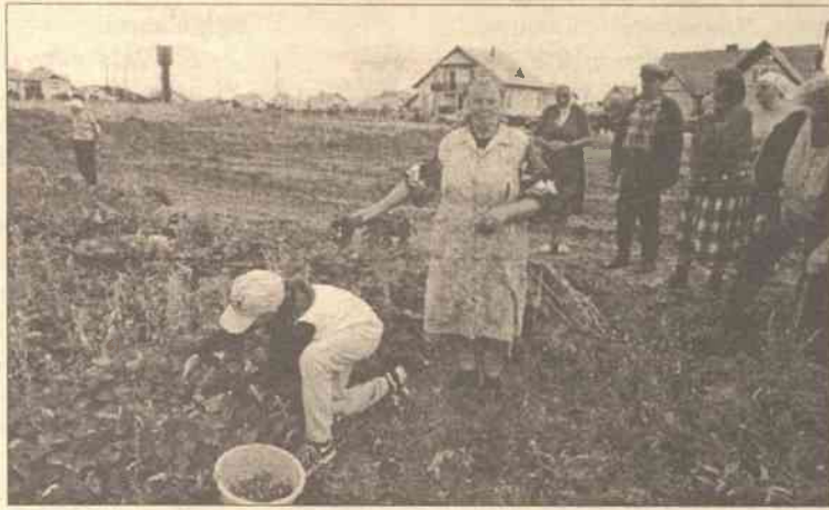
Mieszkańcy Zujun zapowiedzieli, że o swoje będą walczyć do końca

Mieszkańcy wsi mówią, że na wysokich stołkach dawno zdecydowano, że Zujuny będą należeć do „wybrańców”, a starych schorowanych ludzi puści się z torbami. Gdy