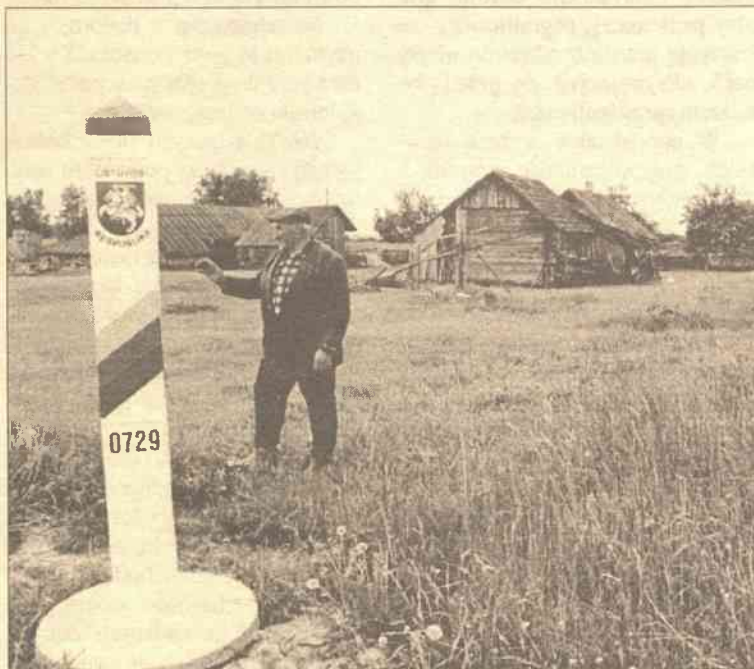
Ziemia przy słupie granicznym — niczyja?