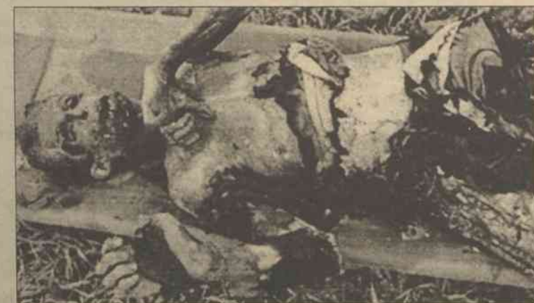
Świadek okrucieństw Rosjan niedaleko Chan-kały

maltretowane, zachowywały ostrożność i nie składały skarg władzom” – głosi komunikat. Jako jedno z miejsc tortur eksperci wymieniają obóz w Czernokozowie, istniejący – wg danych Rady Europy – od grudnia 1999 roku. Jako „niewiarygodne” określa się twierdzenia władz rosyjskich, że „nie istniało wtedy w tej miejscowości żadne miejsce odosobnienia”. Raport Komitetu głosi, że mimo wielokrotnych apeli Rady Europy o wszczęcie śledztwa w sprawie nieprawidłowości w obozie w Czernokozowie, kierowanych do władz Rosji od marca 2000 roku, „władze dały jasno do zrozumienia, że nie mają zamiaru rozpocząć takiej procedury”. Komitet przypomniał, że już wcześniej Moskwa ani nie dostarczyła informacji, ani nie chciała współpracować z Radą Europy w sprawie śledztwa dotyczącego śmierci 53 osób, których ciała znaleziono w lutym b.r. niedaleko Chan-kały pod Groznm. „Tymczasem były oczywiste wskazówki, że (ich) śmierć była wynikiem doraźnych egzekucji” – napisano w dokumencie.