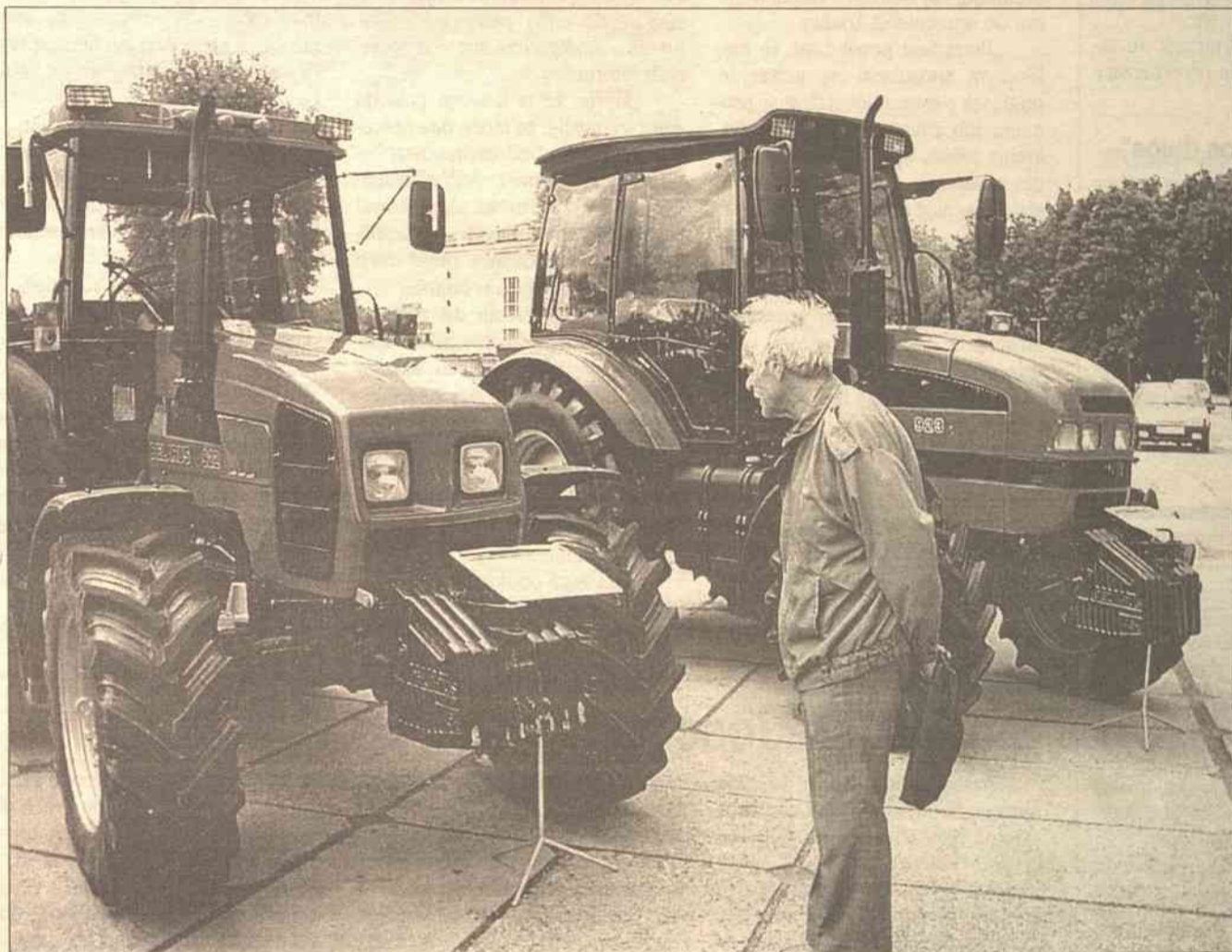
Białoruskie traktory nadal cieszą się dużym zainteresowaniem