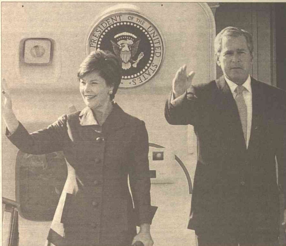
Jutro w Szwecji gościć będzie prezydent USA wraz z małżonką

Szwedzka policja od wielu miesięcy przygotowywała się do zapewnienia bezpieczeństwa podczas szczytu. W ciągu ostatnich dni odgrodzono obszar wokół miejsca, gdzie odbędzie się spotkanie przywódców. Zamknięte zostanie prawie 200 sklepów, restauracje i park rozrywki, znajdujące się na tym terenie. Wcześniej policja usunęła około 40 demonstrantów, którzy założyli obóz na przedmieściach Goeteborga w pobliżu centrum kongresowego, gdzie odbędzie się spotkanie.