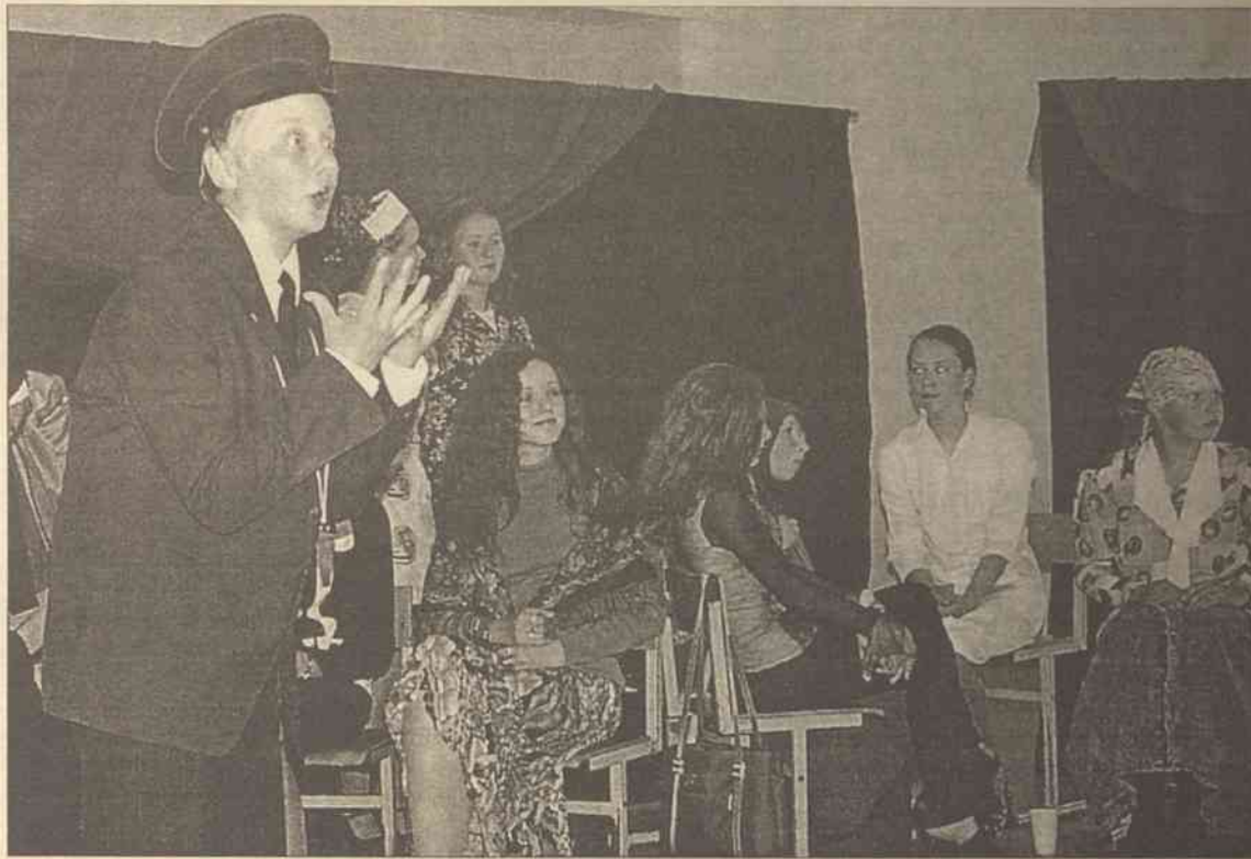
„Lokomotywa” – Konduktor i pasażerowie byli prosto z Kieny podwileńskiej

Przyznano trzy nagrody publiczności, ufundowane przez białostocki i toruński teatry lalek – szkole w Kienie – za „Lokomotywę” oraz teatrzykowi „Złote marzenia” ze szkoły im. Jana Pawła II – za „Panią