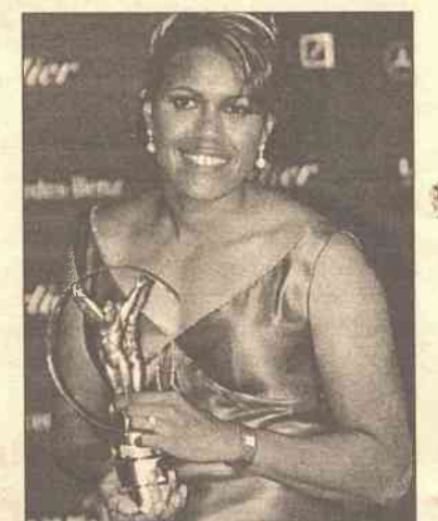
Amerkański golfista Tiger Woods otrzymał w Monte Carlo Sportowego Oscara, wyróżnienie dla najlepszego sportowca roku. Amerykanin zdobył Sportowego Oscara po raz drugi z rzędu. Wśród kobiet nagrodę zdobyła australijska biegaczka Cathy Freeman (na zdjęciu). Freeman, z pochodzenia Aborygenka, wywalczyła na igrzyskach olimpijskich w Sydney złoty medal w biegu na 400 m. Podczas otwarcia olimpiady, zapaliła znicz. Drużyną 2000 roku została piłkarska reprezentacja Francji. Za największe osiągnięcia roku uznano tenisistów Marata Safina oraz Jennifer Capriati.

— Być może po takim początku wielu graczy załamałoby się, zrezygnowało z walki - mówił po spotkaniu Allen Iverson. — Jednak nie mogłem zawieść kolegów z zespołu.