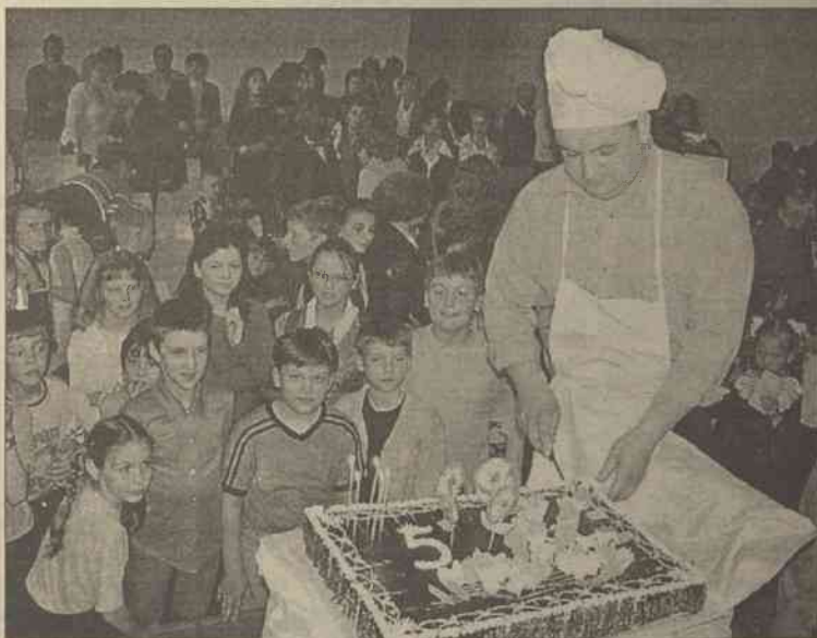
Tort pięciolecia był wspaniały