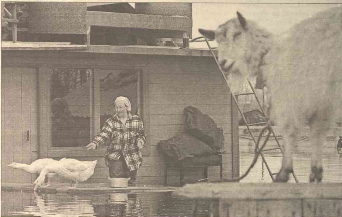
Jeszcze wczoraj rano istniały obawy, że woda może przerwać w Jakucku wały przeciwpowodziowe i zalać centrum miasta. Władze rozważały nawet możliwość zatopienia położonych niżej dzielnic miasta i tym samym - uratowania centrum.

Władze miasta oczekują, że poziom Leny może się jeszcze podnieść w nocy ze środy na czwartek, jednak wały przeciwpowodziowe, broniące miasta przed zalaniem, powinny to bez problemu wytrzy-