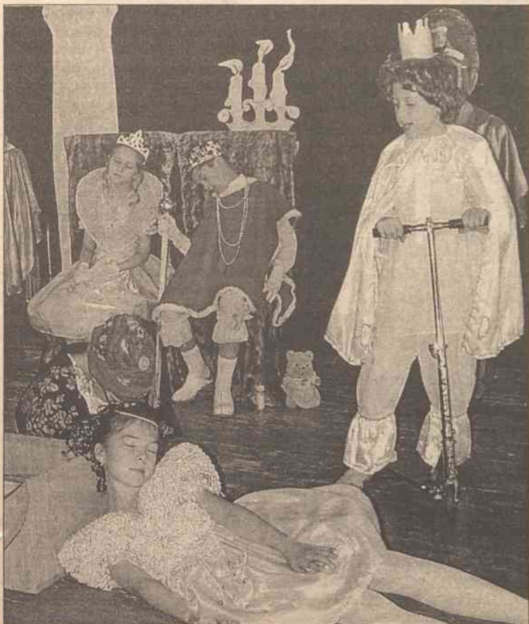
Królewicz na hulajnodze przybył do śpiącej królowy