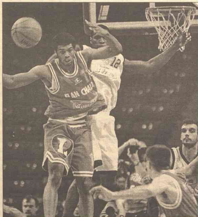
W ostatnich minutach spotkania trwała niezwykle zacięta walka, agresywna obrona z obydwu stron