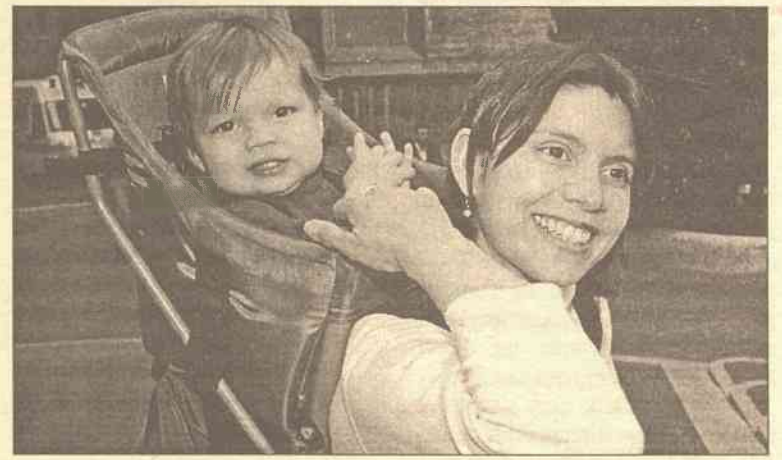
Matki wychowujące dzieci od roku do trzech lat nie otrzymują pieniędzy z budżetu „SoDry”

A więc przerwać należy nieodpłatny urlop macierzyński i wtedy można mieć nadzieję na świadcze-