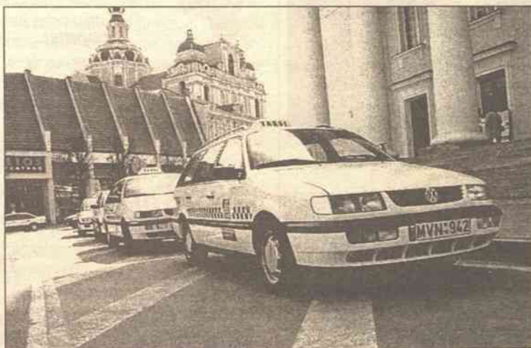
W mieście krąży około 3 tys. taksówek

Prawdopodobnie w dzisiejszej akcji wezmą udział taksówkarze nie tylko z Wilna, ale też z Kowna i Mariampola, łącznie – od 500 do 1000 samochodów. Dwie kolumny samochodów ruszą z dwóch różnych miejsc stolicy – od pętli na Antokolu i ulicy Gabijos i połączą się w śródmieściu. Około godz. 13.00 przed Biblioteką Narodową M. Mažvydas rozpocznie się wiec. Samorząd m. Wilna już wydał zezwolenie na akcję protestu. Według danych samorządu m. Wilna, w stolicy zarejestrowano 1 tys. 642 taksówki, ale realnie w mieście krąży