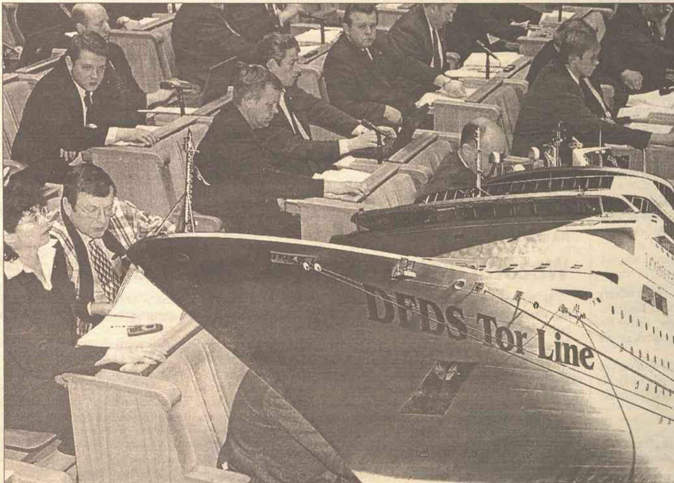
Wygląda na to, że Duńczycy zdolali przełamać „lody” Sejmu