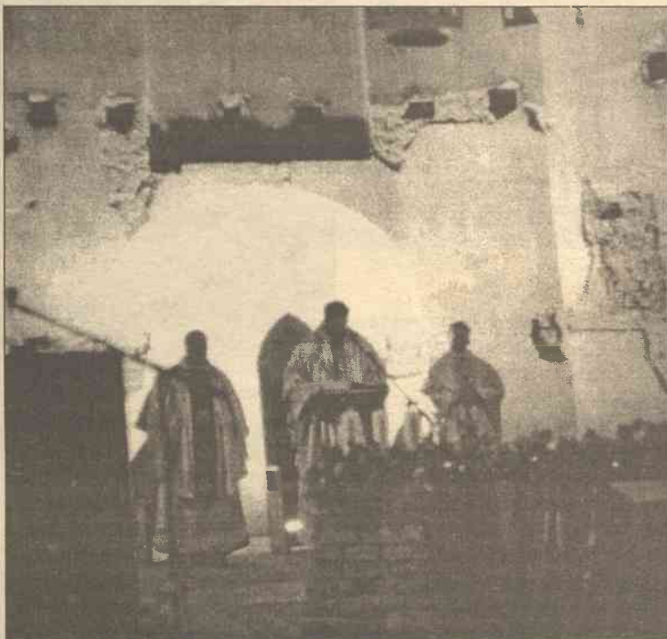
W kościele panuje atmosfera, którą trudno opisać słowami

Kto by mógł się spodziewać, że w tak krótkim czasie harcerki zaprzyjaźnią się z „facetami w habitach” i dojdzie do współpracy.