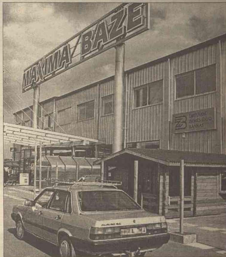
W tym miejscu we wtorek w nocy dokonano zuchwałego napadu na inkasentów