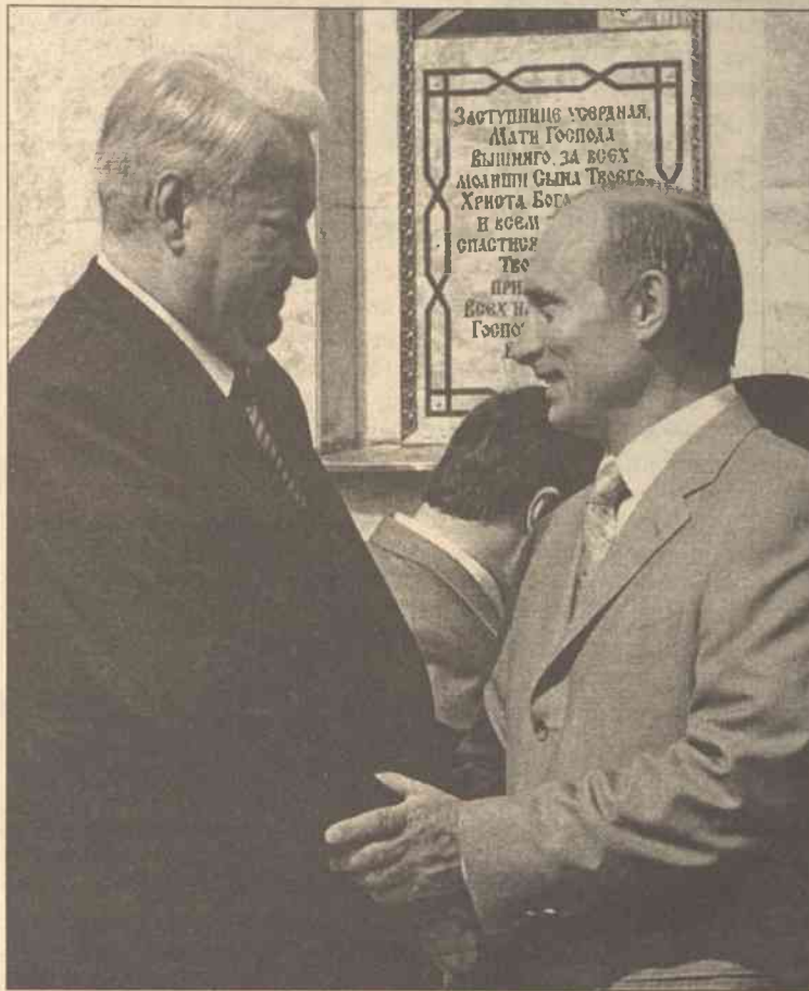
Władimir Putin postanowił wyeliminować ze struktur siłowych ludzi swego „ojca chrzestnego” eksprezydenta Borysa Jelcyna

Minister spraw zagranicznych Egiptu Amr Musa został wybrany na następcę swojego rodaka, Esmeta Abd el-Megida, na stanowisku sekretarza generalnego Ligi. Następny szczyt ma się odbyć w przyszłym roku w Libanie.