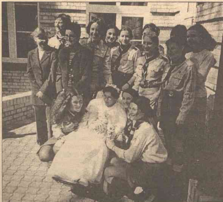
Jak miło widzieć miejsca, gdzie się zauważa istnienie dobra