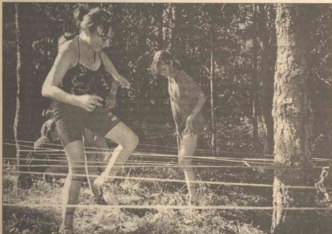
Właśnie takie i im podobne zdarzenia pozostają w pamięci