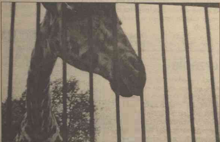
W poczuciu krzywdy jesteśmy zamknięci jak zwierzęta w klatkach