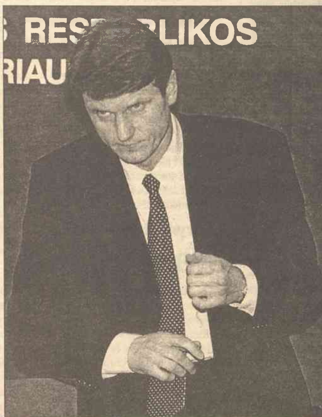
Glaveckas powiedział, że Paksas powinien sprawdzić, czy rząd posiada w Sejmie dostateczne wsparcie dla reform