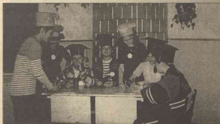
Tęgie głowy ósmaków