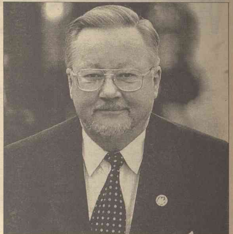
„Myślę, że moje marzenie spełni się za dwa lata” — mówi Landsbergis

— Każdy kolejny dzień niezależności był już dla nas wielką wycieczką. Wiedzieliśmy jednak, że przyjdzie czas budowania własności prywatnej jako fundamentu naszej państwowości. Jeśli więc można mówić o błędach, to przede wszystkim dotyczyły one niektórych rozwiązań w budowie tegoż biznesu. Wynikało to z naszego niedoświadczenia w budowaniu tych struktur. Pamiętajmy także, iż budowaliśmy system antynomenklaturo-