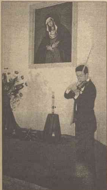
Uroczystość upamiętniająca akowców wileńskich

Tablicę Ponarską odsłoniła wraz z osobami towarzyszącymi prezes Rodziny Ponarskiej pani