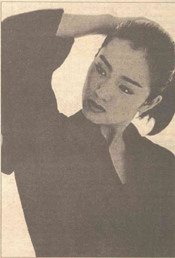
Chińska Greta Garbo

O wielkim marzeniu w Hollywood: Aczkolwiek Gong Li wystąpiła w 21 filmach, z których liczne