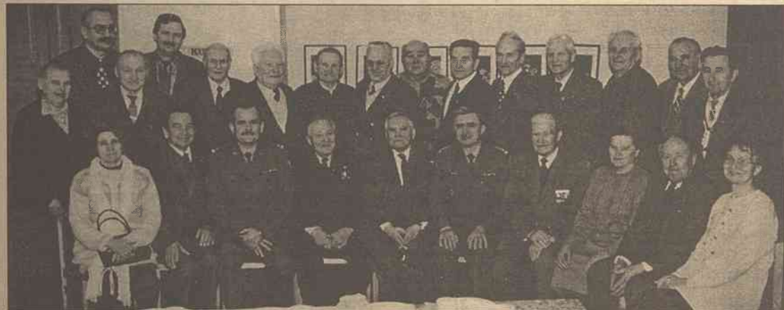
Cała gromada Klubu i goście