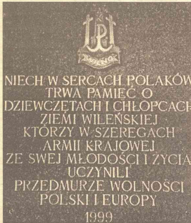
Jedna z poświęconych tablic w kościele łódzkim