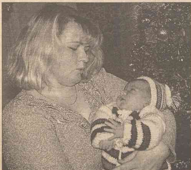
Mama z synkiem