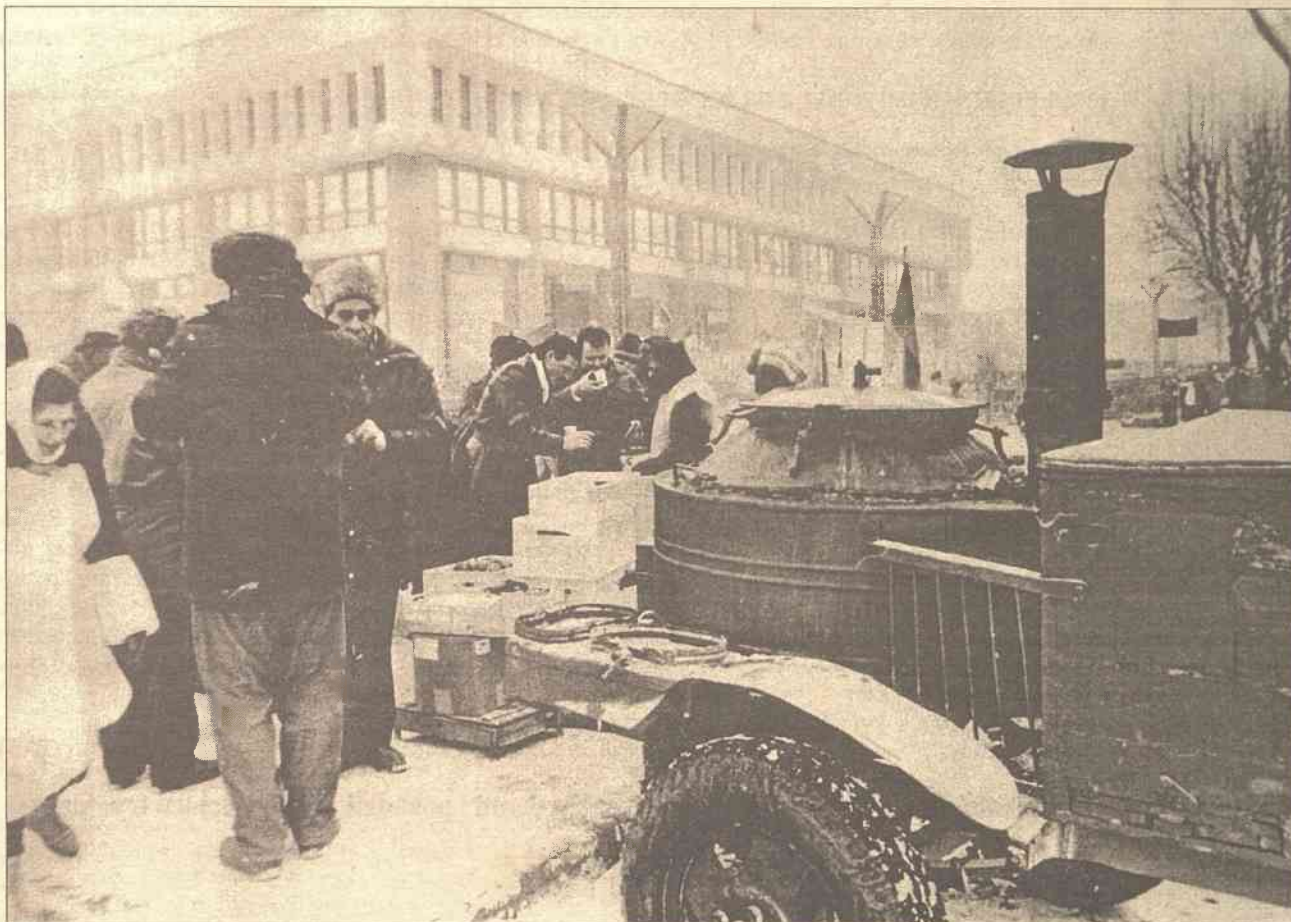
Styczeń 1991r. Przed gmachem Parlamentu obrońców jego grzano gorącą herbatą