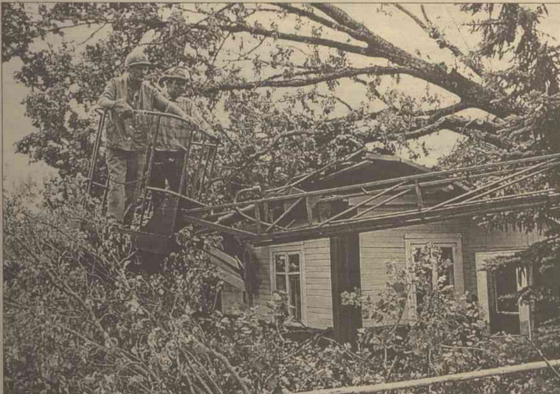
Od huraganu w rejonie trockim ucierpiało 19 domów, w tym cztery zostały zniszczone najbardziej