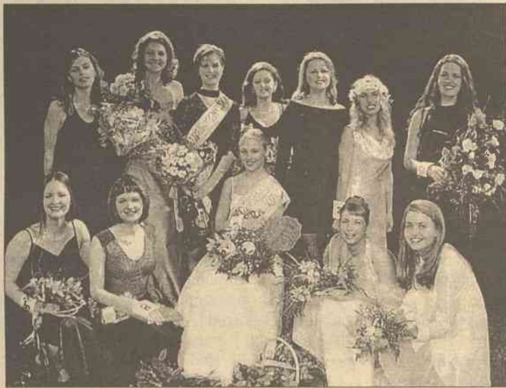
Tak wyglądają finalistki konkursu „Dziewczyna Kuriera 1999”. Jak będą wyglądały tegoroczne - zależy od was

Fotografie kandydatek zostaną zamieszczone w gazecie, aby również nasi Czytelnicy mogli wyrobić swoje zdanie, wziąć udział w plebiscycie. Radzilibyśmy więc zachowywać zdjęcia laureatek, a na zakończenie konkursu wypełnić kupon „Sympatii Czytelników” (będzie on opublikowany na łamach „Kuriera”). W taki sposób zostanie wybrana „Dziewczyna Czytelni-