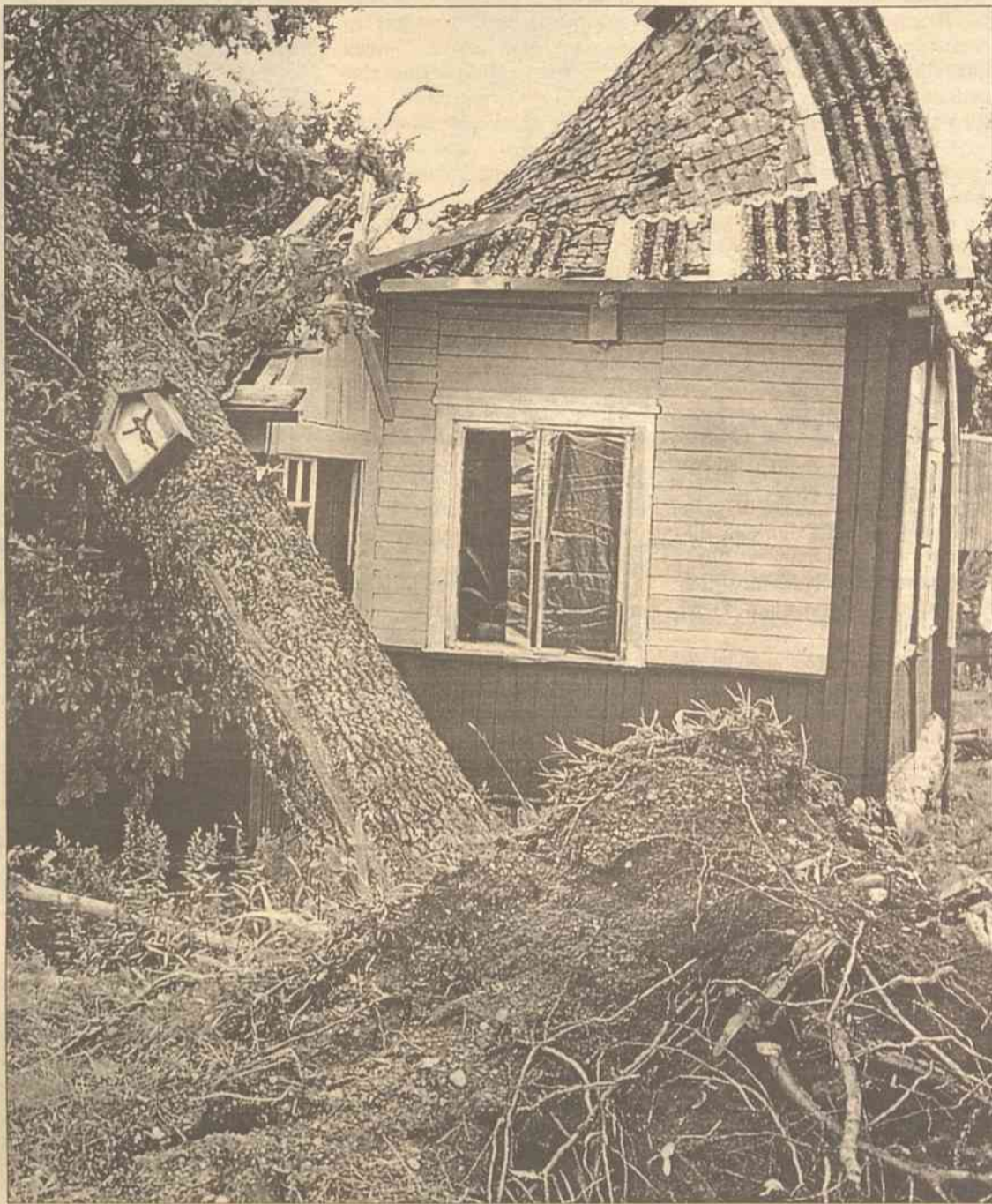
Dąb z Ukrzyżowanym Chrystusem spadł na dach domu we wsi Żydabraščiai

Dzisiaj o godz. 9. odbędzie się nadzwyczajne posiedzenie rady samorządu rejonu trockiego, na którym ma być przyjęte postanowienie w sprawie udzielenia pomocy