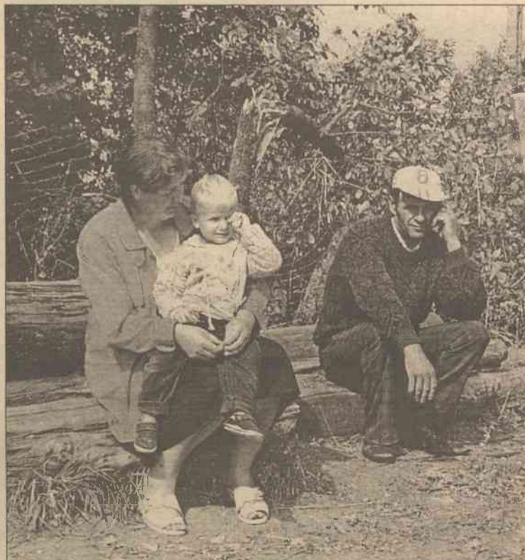
Ludzie w Towczanach nie mają pracy, teraz wielu zostało i bez dachu nad głową