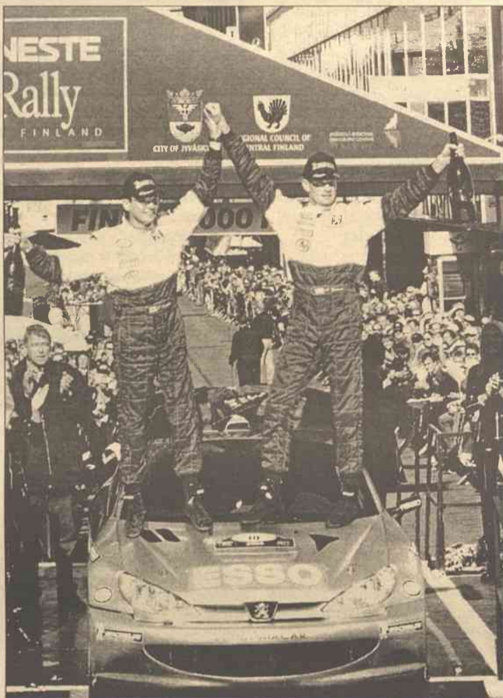
Fiński kierowca Marcus Groenholm (od prawej) i jego pilot Timo Rautiainen są zwycięzcami rajdu Finlandii, który odbywał w fińskiej miejscowości Jyväskylä.

Reprezentant gospodarzy Marcus Groenholm wygrał w Jyväskylä Rajd Finlandii i objął prowadzenie w klasyfikacji mistrzostw świata.