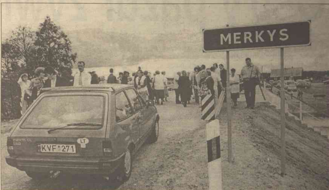
Chętnych wypróbowania "mocy" nowego mostu nie brakło