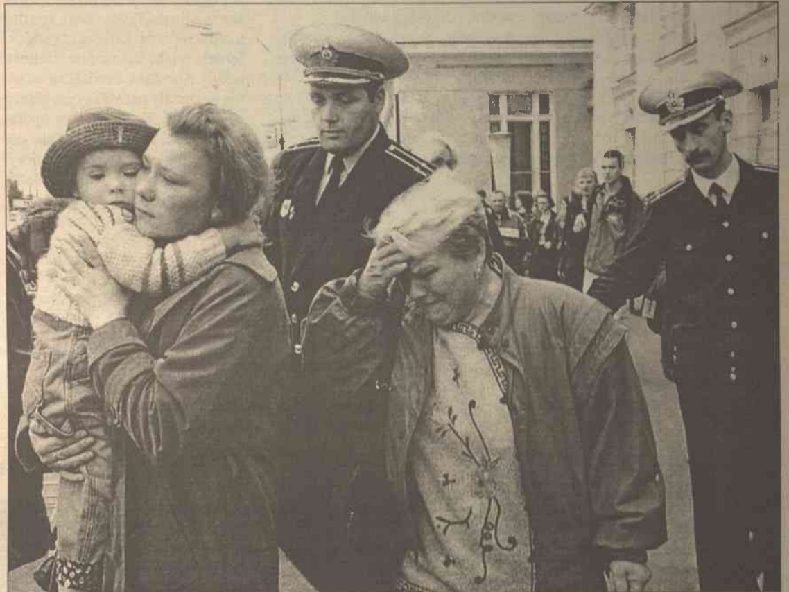
Na dworzec kolejowy miasta Murmansk nadal przybywają krewni załogi atomowego okrętu podwodnego „Kursk”. Rosjanie oficjalnie przyznali, że cała załoga „Kurska” zginęła

Według badań belgradzkiego Instytutu Nauk Społecznych, na Miloszevicia chce głosować 23 procent respondentów, podczas gdy wspólny kandydat 15 ugrupowań opozycyjnych Vojislav Kostunica może liczyć na 35-procentowe poparcie. Obecny sondaż przeprowadzono na grupie 1700 osób w całej Serbii. Nie pytano natomiast mieszkańców znajdującego się pod ONZ-owskim zarządem