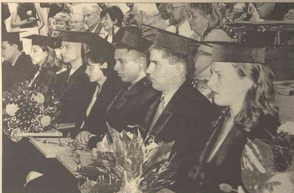
W tym roku Litewską Akademię Prawa ukończyło ponad 400 bakałarzy i 200 magistrów. Na zdjęciu: magistrzy wystrójeni w togi i berety

Jako że cała Litwa dziarsko maszeruje do Europy, Litewska Akademia Prawa również nie pozostaje w tyle, stwarzając jak najlepsze warunki dla swoich studentów. Uwzględniając normy przewidziane w Deklaracji Bolońskiej o otwartych studiach w Europie,