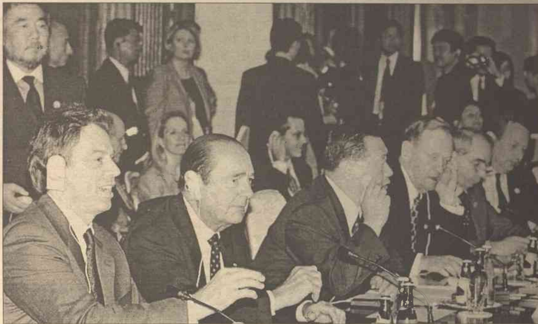
Uczestnicy szczytu ośmiu najbardziej rozwiniętych państw świata będą mieli wiele problemów do rozwiązania

Agencja nie precyzuje, czy któryś z więźniów zginął. Nie po-