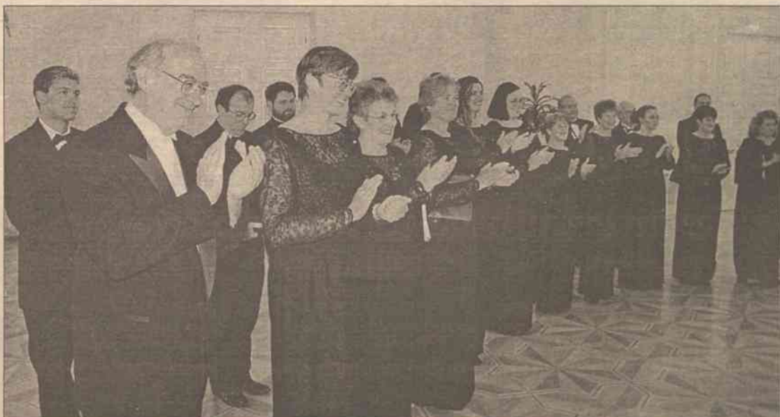
Prezydentura staje się miejscem, gdzie nie tylko zapadają ważne dla kraju decyzje, gdzie spotykają się politycy oraz są przyjmowani najdostojniejsi goście z zagranicy, ale coraz częściej są przyjmowane zespoły artystyczne, które korzystając z okazji przedstawiają też swą twórczość. Ostatnio w prezydenturze gościł chór z Danii Gerald Singers.