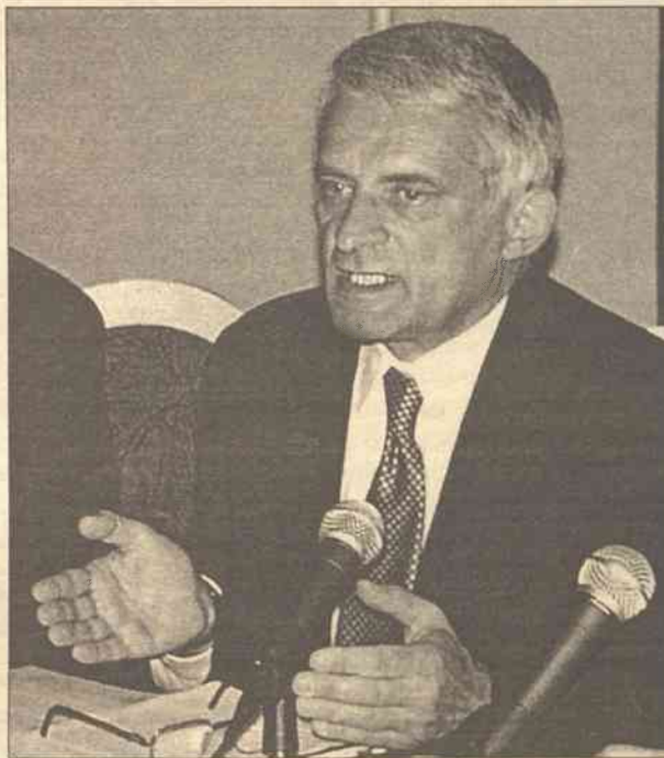
Andrius Kubilius zapewniał, że uczniowie szkół mniejszości na Litwie będą finansowani lepiej. Z kolei Jerzy Buzek zadeklarował, że rząd polski zrobi wszystko, żeby dać szansę mniejszości litewskiej w Polsce

Wczoraj w Wigrach na Suwalszczyźnie premierzy Litwy i Polski Andrzej Kaczyński i Jerzy Buzek rozmawiali o współpracy w dziedzinie energetyki oraz o sytuacji mniejszości polskiej na Litwie i litewskiej w Polsce.