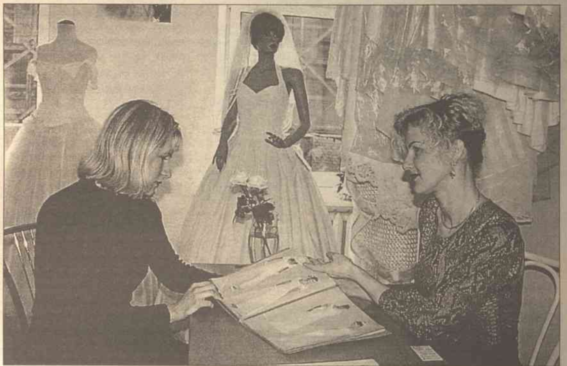
Salon „Madonna“ może zaproponować każdy fason sukni ze znajdujących się tu katalogów