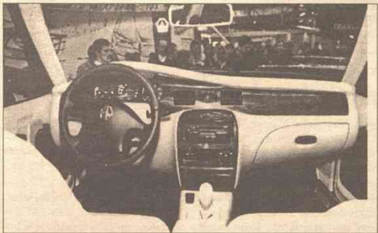
Kokpit luksusowego „Kality”