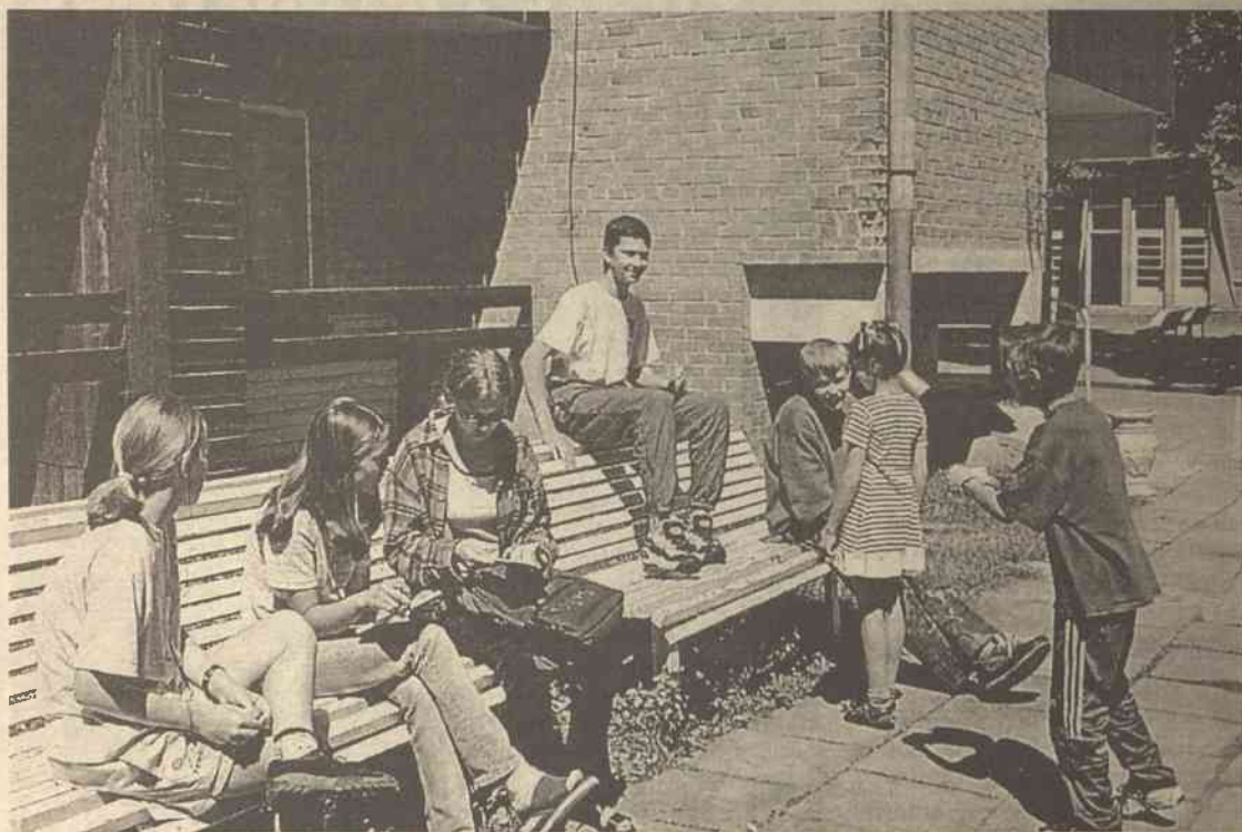
Młodzi muzycy zaprzyjaźnili się. Polacy uczą się litewskich słówek, Litwini i Białorusini polskich

- Jeszcze nigdy nie byliśmy za granicą, dlatego uważamy za prezent od losu kilkudniowy wyjazd do Polski, gdzie odbędzie się zakończenie obozu - zwierzą się dziewczęta.