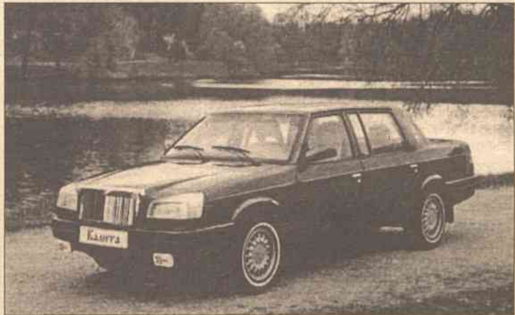
Model „Kalita” jest nazywany rosyjskim lincolnem