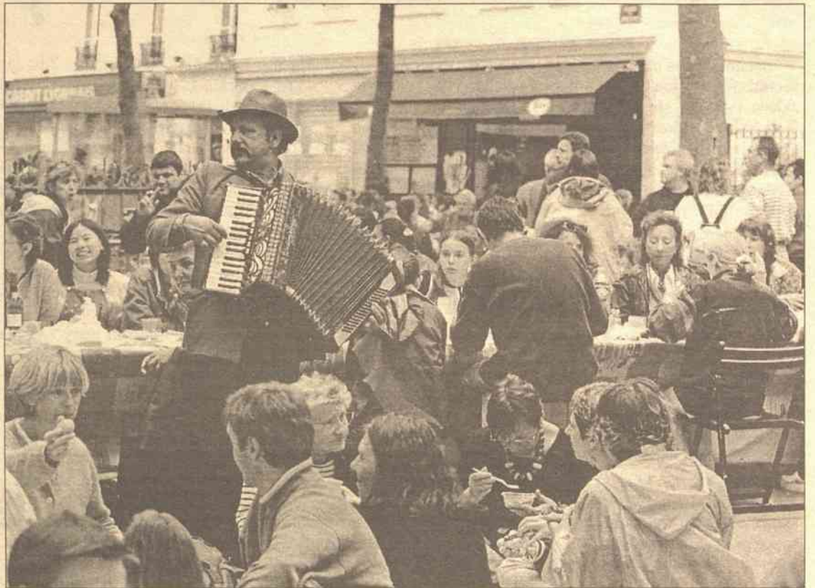
Francuzi świętowali wczoraj dzień zdobycia Bastylli. Na ulicach Paryża urządzono prawdziwy ludowy piknik. Tymczasem francuscy dyplomaci musieli się gęsto tłumaczyć, iż nie są przeciwni rozszerzeniu Unii Europejskiej

Pragnące zachować anonimowość źródło w rosyjskim sztabie generalnym uważa, że czeczeńscy bojownicy przygotowują operacje ofensywne na kilka miast, w tym Groznom, Gudermes i Urus-Martan. Jeden z czeczeńskich do-