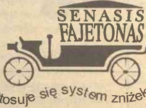
Stosuje się system zniżek

Grupy wieczorowe i dzienne. Grupy intensywnej nauki. Nauka zaoczna, indywidualna. Wykłady w jęz. litewskim i rosyjskim. Plac do nauki jazdy, komputery, najnowsze programy, literatura.