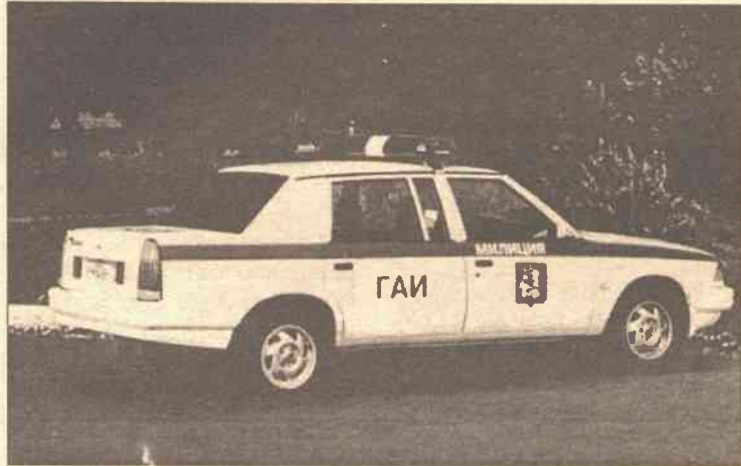
„Kniaź Wladimir” w służbie moskiewskiej milicji