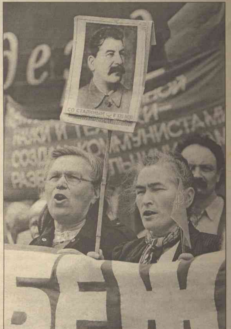
Dialog Rosji z Zachodem jest coraz bardziej konstruktywny, a tymczasem komunistom marzy się powrót do dawnych czasów

mieć trudności, aby nas przetłumaczyć" - odparł, pytany o możliwość ubiegania się Rosji o członkostwo.