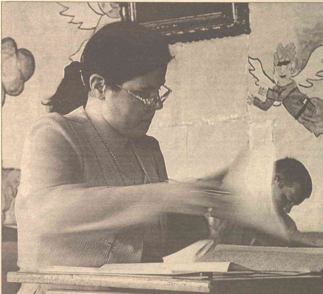
Egzamin maturalny - to łut szczęścia, uważają maturzyści