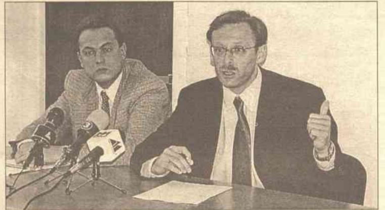
Saulius Janonis (z lewej) i Raimundas Alekna zgodnie oznajmili, że jednym ze sposobów utrzymania placówek medycznych może być zmniejszenie wynagrodzeń lekarzy o 10 %

Minister Alekna, w swoją kolej, nieoczekiwanie oświadczył, że najważniejszym priorytetem polityki zdrowotnej jest zdrowie społeczeństwa, które, jak świadczą dane statystyczne, stopniowo się polepsza.