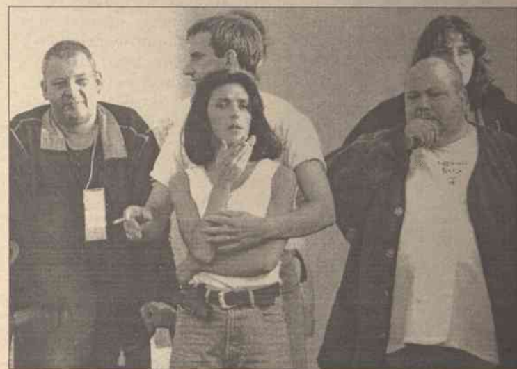
39-letni porywacz pochodzenia tunezyjskiego wczoraj przetrzymywał jako zakładników 25 dzieci i troje opiekunów. Rodzice z niepokojem oczekiwali na swe pociechy uwięzione przez szaleńca

W środę o godzinie 19 mężczyzna uwolnił ośmiorgo dzieci. Przedtem inną ośmioosobową