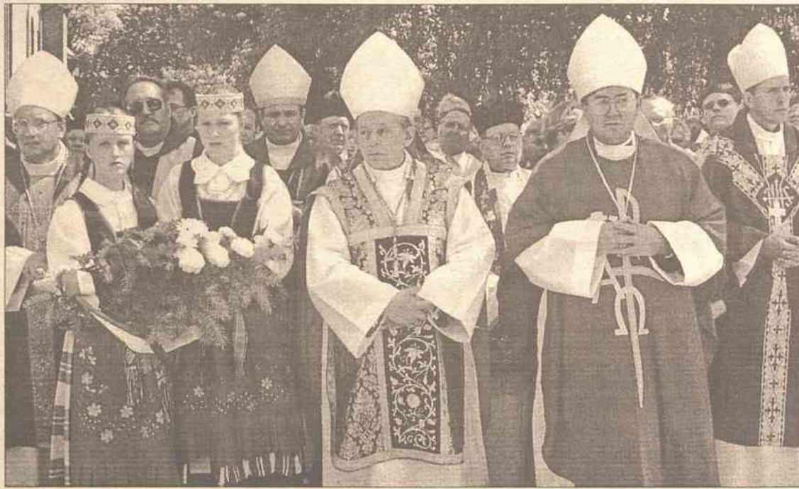
Ostatnia chwila zadumy i modlitwy: "Bądź nam orędownikiem przed Tronem Najwyższego"