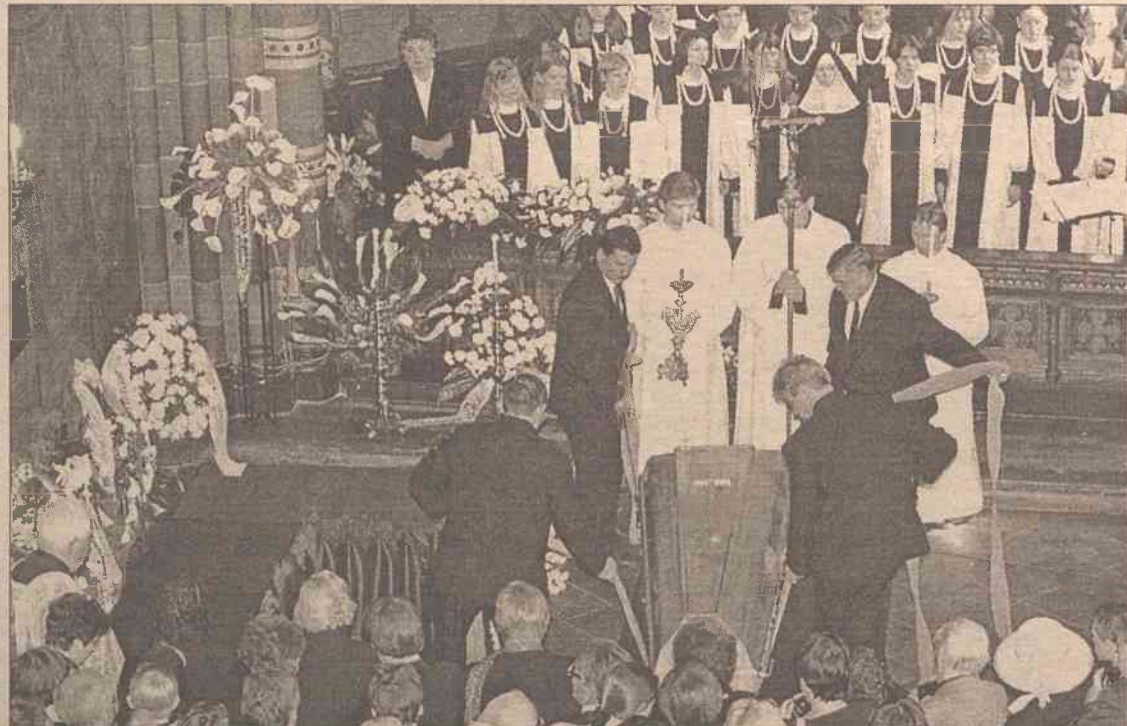
Złożenie Zwłok do krypty