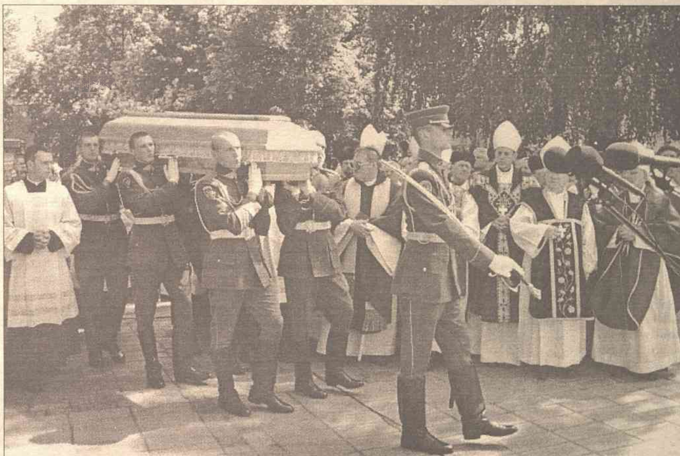
Żołnierze pełnili wartę honorową przy Zmarłym, żołnierze też odprowadzili Go na miejsce wiecznego spoczynku do kaplicy Przenajświętszego Sakramentu w Bazylice Kowieńskiej

Zamarł w ciszy miasto pogrążone w żałobie, robiło wrażenie, jakby tu wszystko, z wyjątkiem transportu, na moment stanęło. Nieczynna była większość sklepów, nawet instytucje państwowe zrobiły sobie dłuższą przerwę. Kościół Litwy żegnał i odprowadzał na wieczny spoczynek jednego z najbardziej zasłużonych kapłanów, kardynała Vincentasa Sladkevičiusa. Na plac katedralny przybyły tysiące mieszkańców Kowna, wiele młodzieży, wiernych z różnych zakątków Litwy.