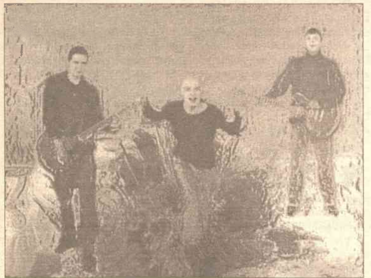
Zespół BIPLAN zaprezentował swój album "Jazz'e tik merginos"