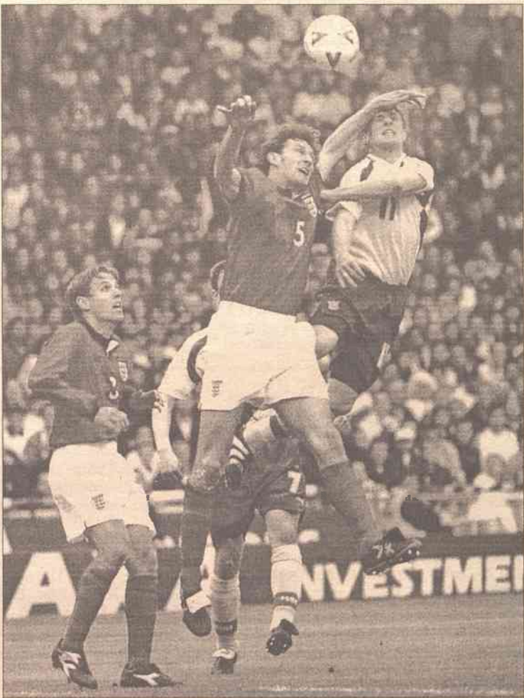
Fragment meczu towarzyskiego pomiędzy reprezentacjami Anglii i Ukrainy na murawie stadionu w Wembley. W rywalizacji o piłkę Anglik Tony Adams (nr 5) z reprezentantem Ukrainy Sergejem Rebrovym. Anglia pokonała Ukrainę 2:0.

Niespodzianką jest zakwalifikowanie przez dziennikarzy dopiero do drugiej piątki rozgrywanego Philadelphia 76ers, Allena Iversona (otrzymał 420 pkt).