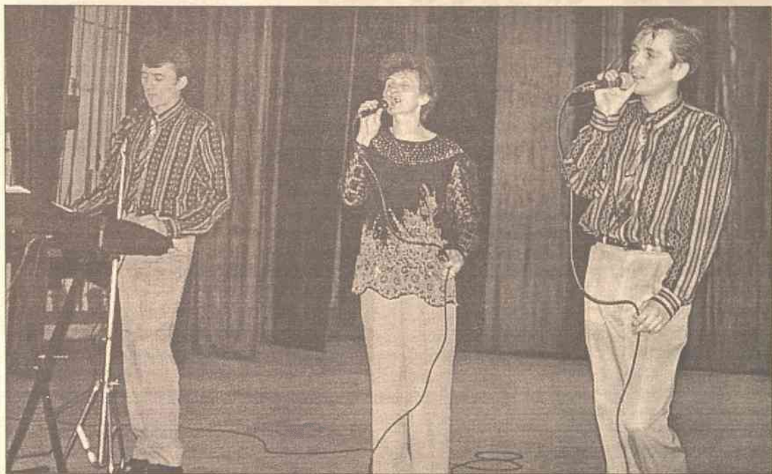
Rozśpiewane trio zdobyło sympatię całej widowni

W minioną niedzielę, tuż po sumie, w miejscowym Domu Kultury odbyło się spotkanie z dziennikarzami "Kuriera Wileńskiego".