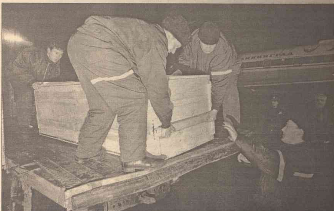
Pracownicy lotniska w Sankt-Petersburgu odbierają trumnę ze zwłokami byłego mera tego miasta Anatolija Sobczaka

Sobczak zmarł w wieku 62 lat podczas pobytu w sanatorium w