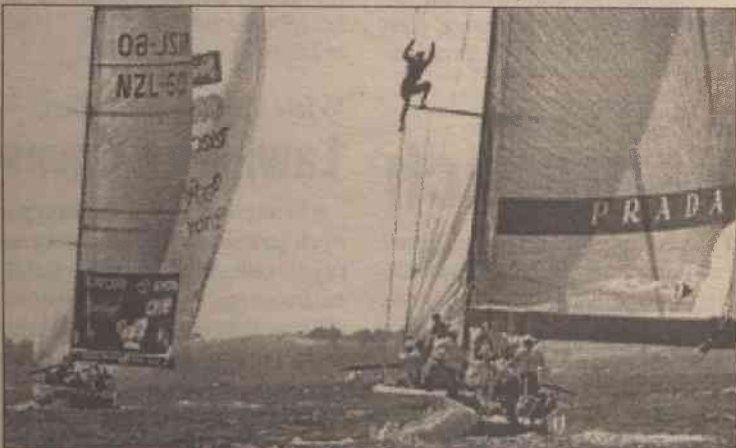
Team New Zealand wygrał z włoską Pradą w pierwszym wyścigu o żeglarski Puchar Ameryki, który w niedzielę odbył się na wodach zatoki Hauraki koło Auckland. Nowozelandzki jacht był szybszy o 1 minutę i 17 sekund. Pierwszy wyścig o Puchar Ameryki, najstarsze żeglarskie trofeum, zaplanowany był na sobotę, ale został przelożony na niedzielę z powodu braku wiatru. Lepsi okazali się broniący tytułu Team New Zealand, który wygrał ten wyścig z Pradą - zwyciężcą eliminacji challengerów. Puchar zdobędzie ta załoga, która jako pierwsza wygra pięć wyścigów spośród dziewięciu zaplanowanych.

■ Duńczyk Wilson Kipketer wynikiem 2.14,96 ustanowił halowy rekord świata w biegu na 1000 metrów podczas lekkoatletycznego mitingu w Birmingham. Poprzedni rekord (2.15,25) należał do tego samego zawodnika i był ustanowiony 6 lutego w Stuttgarcie. Natomiast najlepszy wynik światowy na dystansie dwóch mil uzyskał Etiopczyk Halyu Mekkonen - 8.09,66.