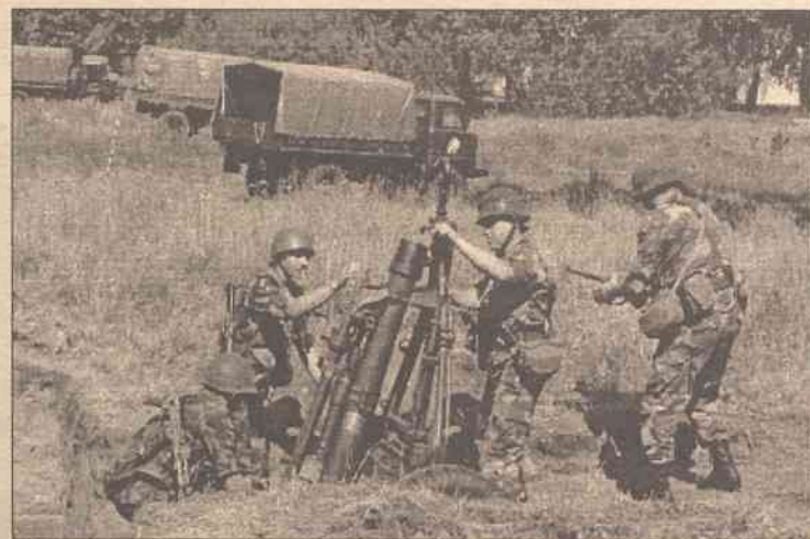
Wspomnienia nie tak odległe. Z lata roku ubiegłego. Wspólne ćwiczenia LITPOLBAT

Wczoraj w Olickim Zmotoryzowanym Batalionie Piechoty im. Księżny Birutė rozpoczęły się ćwiczenia sztabowe wspólnego batalionu litewsko-polskiego LITPOLBAT. Zadaniem tego batalionu jest przywrócenie oraz utrzymanie międzynarodowego pokoju i bezpieczeństwa. Gdy Polska została członkiem NATO, projekt LITPOLBAT stał się ważnym środkiem integracji Litwy ze strukturami wojskowymi NATO.