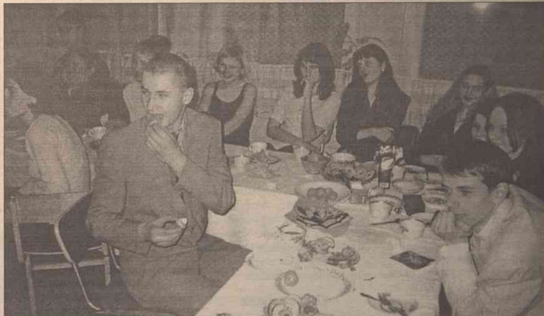
Słodki stół - to nieodzowny atrybut studniówki

W imieniu całej naszej klasy chcę podziękować serdecznie