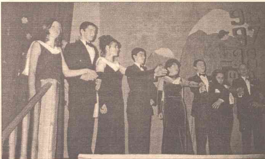
Polonez zawsze piękny

Przygotowania do pięknej szkolnej uroczystości - studniówki - trwały długo, gdyż każdy uczestnik chciał się spisać jak najlepiej.