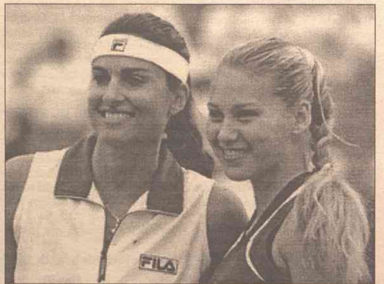
Po trzyletniej przerwie na korty tenisowe powróciła gwiazda tenisu Argentynka Gabriela Sabatini (od lewej)

Kategoria B2 - to sześć psów rasy Alaskan Malamute, pies Grenlandzki lub Samoyed. Natomiast w kategorii B1 startuje sześć psów rasy Siberian Husky.