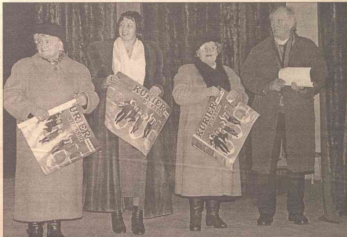
Szczęśliwców, którzy podczas loterii wygrali kalendarz "Kuriera", było dziesięciu