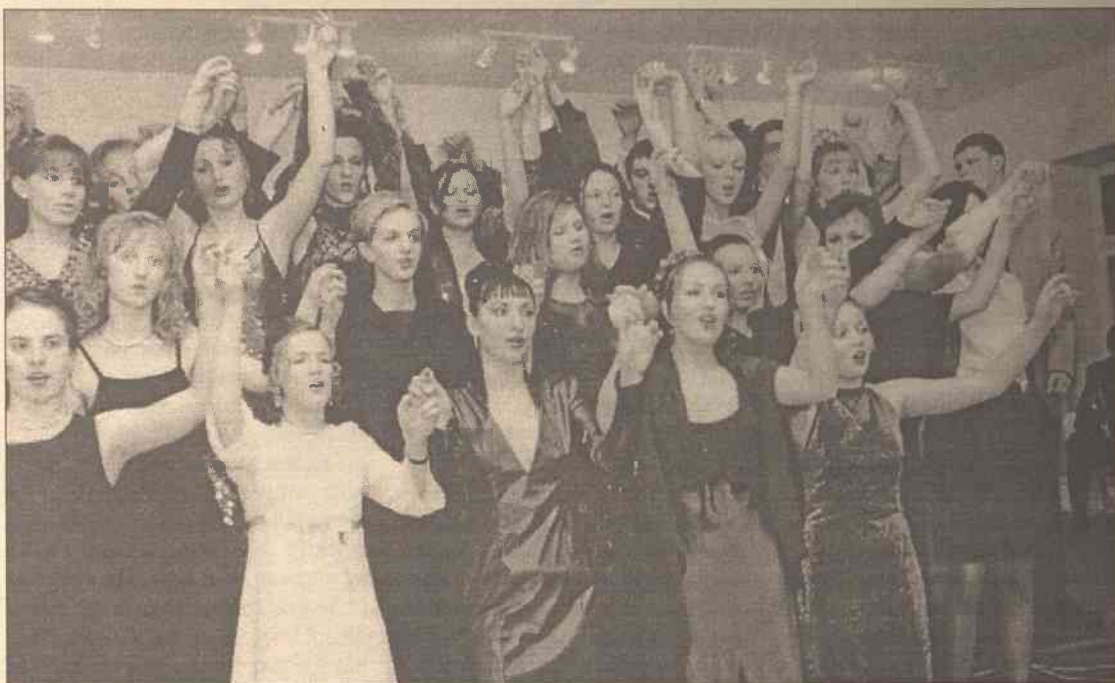
Radość wspólnej zabawy

„Słynny znawca sztuki” - Zbigniew Gierasim zaprowadził nas do galerii obrazów. Przedstawił obraz „Leczące bociany” Józefa Chełmońskiego. Namawiał maturzystów, by zawsze wracali do swych