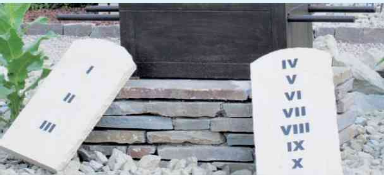
Muszynieckie Ogrody biblijne

U Jezusa zebrali się faryzeusze i kilku uczonych w Piśmie, którzy przybyli z Jerozolimy. I zauważyli, że niektórzy z Jego uczniów brali posiłek nieczystymi, to znaczy nie obmytymi rękami. Faryzeusze bowiem, i w ogóle Żydzi, trzymając się tradycji starszych, nie jedzą, jeśli sobie ręk nie obmyją, rozluźniając pięść. I gdy wrócą z rynku, nie jedzą, dopóki się nie obmyją. Jest jeszcze wiele innych zwyczajów, które przejęli i których przestrzegają, jak obmywanie kubków, dzbanków, naczyń miedzianych. Zapytali Go więc faryzeusze i uczeni w Piśmie: «Dlaczego Twój uczniowie nie postępują według tradycji starszych, lecz jedzą nieczystymi rękami?» Odpowiedział im: «Słusznie prorok Izajasz powiedział o was, obtudnikach, jak jest napisane: „Ten lud czci Mnie wargami, lecz sercem swym daleko jest ode Mnie. Ale czci Mnie na próżno, ucząc zasad podanych przez ludzi”. Uchyliliście przykazanie Boże, a trzymacie się ludzkiej tradycji». Potem przywołał znowu tłum do siebie i rzekł do niego: «Słuchajcie Mnie, wszyscy, i zrozumcie! Nic nie wchodzi z zewnątrz w człowieka, co mogłoby uczynić go nieczystym; lecz to, co wychodzi z człowieka, to czyni człowieka nieczystym. Z wnętrza bowiem, z serca ludzkiego pochodzą złe myśli, nierząd, kradzieże, zabójstwa, cudzołóstwa, chciwość, przewrotność, podstęp, wyuzdanie, zazdrość, obelgi, pycha, głupota. Całe to zło z wnętrza pochodzi i czyni człowieka nieczystym». □