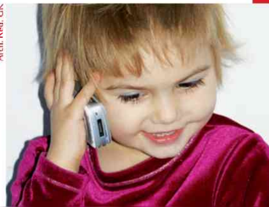
Arch. Red. GK