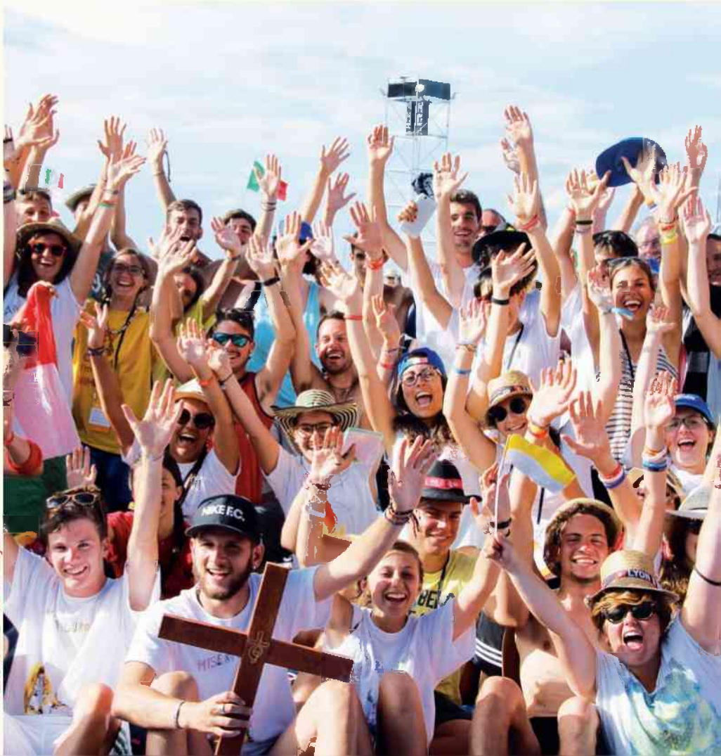
SDM Kraków

Korzystając z tej okazji, pragnę przede wszystkim zwrócić się do ludzi młodych, którym patronuje św. Stanisław. Chcę przypomnieć zdanie, jakie wypowiedział św. Jan Paweł II w kościele św. Andrzeja na Kwirynale, podczas nawiedzenia relikwii św. Stanisława: „Jego krótka droga z Rostkowa na Mazowszu przez Wiedeń do Rzymu była jak gdyby wielkim biegiem na przetaj, do tego celu życia każdego chrześcijanina, jakim jest świętość” (13 listopada 1988 r.).