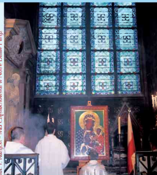
MB Częstochowska w Notre Dame Paryż

W Kanie Galilejskiej odbywało się wesele i była tam Matka Jezusa. Zaproszono na to wesele także Jezusa i Jego uczniów. A kiedy zabrakło wina, Matka Jezusa mówi do Niego: „Nie mają już wina”. Jezus Jej odpowiedział: „Czyż to moja lub Twoja sprawa, Niewiasto? Jeszcze nie nadeszła godzina moja”. Wtedy Matka Jego powiedziała do sług: „Zróbcie wszystko, cokolwiek wam powie”. Stało zaś tam sześć stągwi kamiennych przeznaczonych do żydowskich oczyszczeń, z których każda mogła pomieścić dwie lub trzy miary. Rzekł do nich Jezus: „Napełnijcie stągwie wodą”. I napełnili je aż po brzegi. Potem do nich powiedział: „Zaczerpnijcie teraz i zanieście staroście weselnemu”.