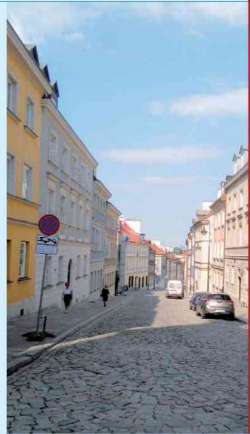
la rue Mostowa

Au fil du temps, elle a pris des dimensions importantes. Régulièrement, des monceaux d'ordure glissaient dans la Vistule. À sa fermeture, les déchets représentaient une hauteur de 23 mètres. On peut imaginer les odeurs fétides qui s'en dégageaient, surtout par les fortes chaleurs en été, et qui dérangent les habitants, jusqu'au roi dont le château était à proximité, sans oublier les rats qui y pullulaient. À partir du XVII e siècle, on a commencé à s'inquiéter de ses dimensions et des odeurs, mais il faudra attendre presque la moitié du XIX e pour voir sa fermeture définitive. En 1744, on y fait pousser de l'herbe, puis, à la fin du XVIII e siècle, on limite son utilisation. Après sa fermeture, la décharge est recouverte de terre. Près de cent ans plus tard, en 1923, la banque nationale PKO (Pocztowa Kasa Oszczędności – la Caisse d'épargne postale – créée en 1919), fait