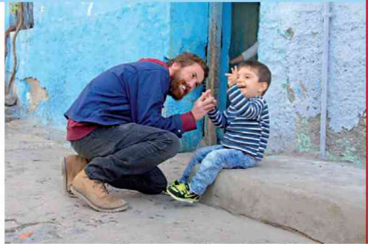
Polska akcja pomocy uchodźcom syryjskim (na zdjęciu D. Wildstein)