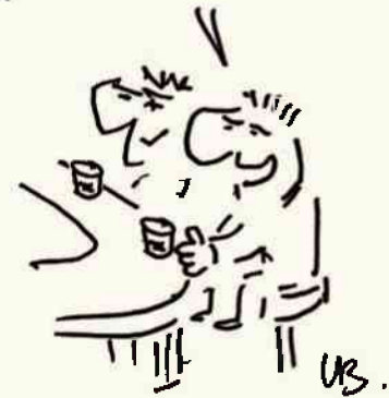
rys. Leszek Biernacki