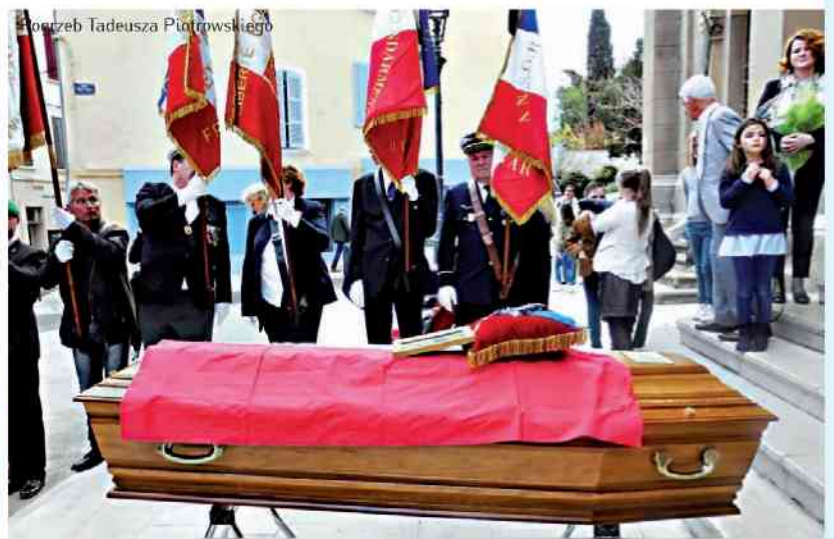
Pogrzeb Tadeusza Piotrowskiego