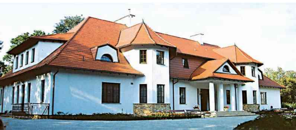
Opinogóra – Muzeum Romantyzmu

„... co krzyż i gwoździe i rany i ciernie wiesz, co krwi ziemskiej i też ziemskich ciekli Jak konania ból boli niezmiernie Bądź nam królową teraz i na wieki”. □