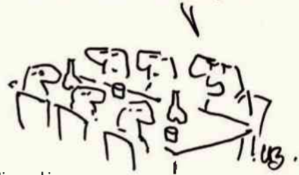
rys. Leszek Biernacki