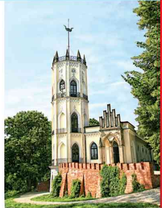
Zameczek w Opinogórze

Pytanie, zawsze w Polsce żywe nabrało szczególnej optyki od czasu otrucia w Londynie byłego agenta GRU i jego córki. Dlaczego Rosjanie uśmiercają swoich byłych