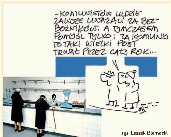
rys. Leszek Biernacki