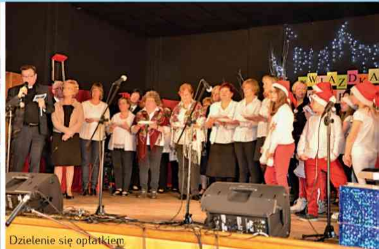
Dzielenie się opłatkiem