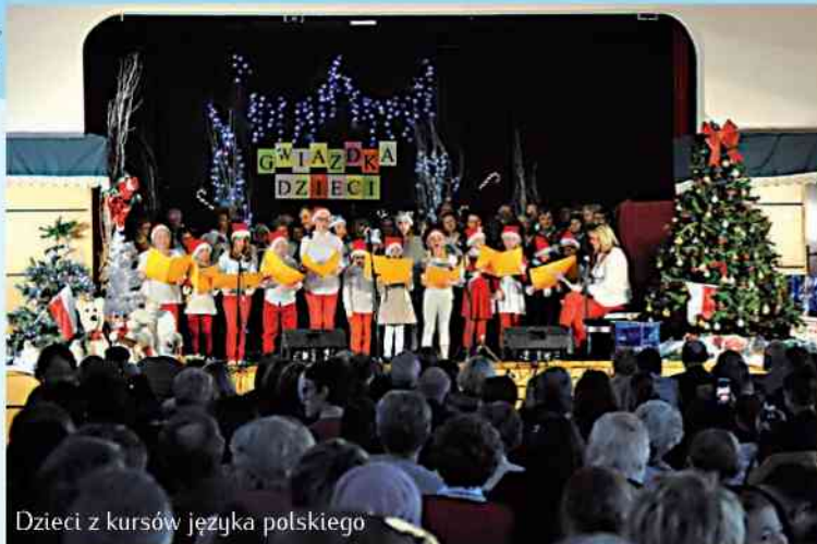
Dzieci z kursów języka polskiego