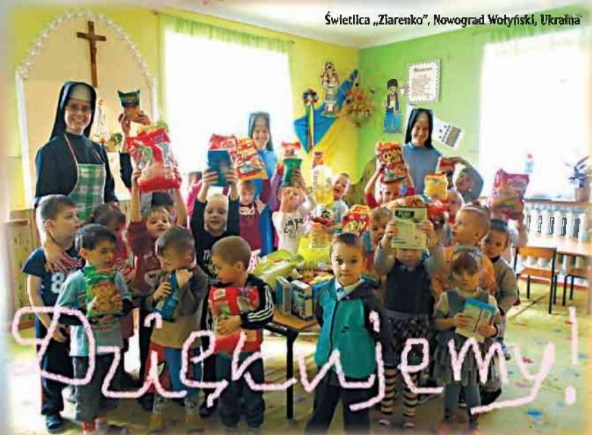
Świątlica „Ziarenko”, Nowograd Wołyński, Ukraina