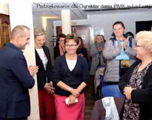
Podziękowanie dla Dyrektora domu PMK w La Ferté

Także w zwykłych rodzinach, takich jak moja czy Twoja, przychodzą na świat przyszli księża, siostry zakonne, którzy swą modlitwą i niewidoczną pracą wspierają nas wszystkich. Który z rodziców nie pragnie spotkać się w Niebie ze swoimi dziećmi... a któż je do tego wychowa... i w jakiej (jakościowo) rodzinie? □