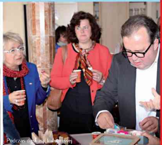
Podczas dyskusji kulturalowej