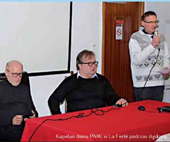
Kapelan domu PMK w La Ferté podczas dyskusji