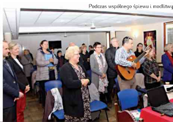
Podczas wspólnego śpiewu i modlitwy