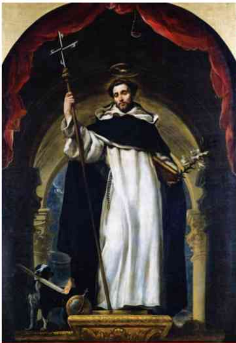
C. Coello - św. Dominik

To, co powiem, jest bardzo intymne, ale... doskonale rozumiem reakcję świętego Dominika. Wiem, że może to zabrzmieć bardzo niepokornie, ale czasami widzę kogoś i jestem do głębi poruszony tym, jak bardzo kocha tę osobę Bóg. Nie potrafię ukryć tego wzruszenia. Jestem wrażliwy na takie poruszenia. Chcę być jak kompas, który wskazuje Jego miłość. Chcę wskazywać na Niego, nie na siebie. Ile razy szedłem według własnego azymutu, lądowałem na manowcach.