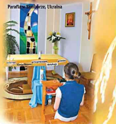
Parafia w Samborze, Ukraina

Zbiórka organizowana przez Zespół Pomocy Kościołowi na Wschodzie przy Sekretariacie Konferencji Episkopatu Polski