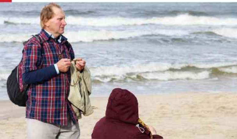
fol. Coś Niedzielnego