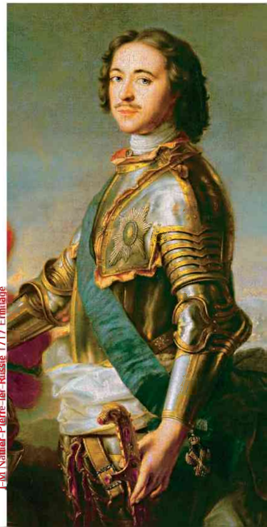
J-M Nattier - Pierre-Ier-Russie 1717 - Ermitage

Na całej aferze najlepiej wyszedł Andriej Artamonowicz Matwiejew. Otrzymał od cara, oprócz nagród pieniężnych, najwyższe order w uznaniu wzorowej służby dyplomatycznej, podczas której żył nad stan, utonął w długach i przytapany na próbie ucieczki przez wierzycieli został zamknięty w domu publicznym bez laski i kapelusza. □