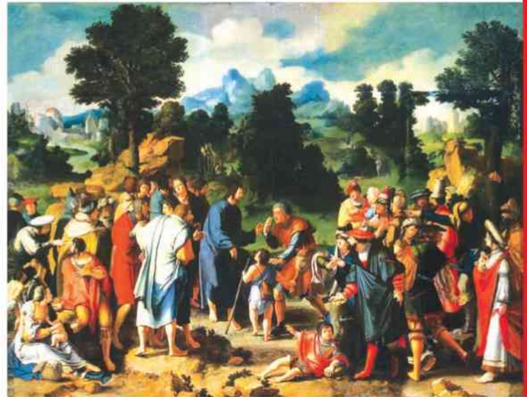
Lucas van Leyden - Chrystus uzdrawia ślepego

Dziś, gdy kolejny raz przychodzimy do kościoła na Mszę św., gdy korzystamy ze spowiedzi świętej, gdy adorujemy obecnego w monstrancji Jezusa - przede wszystkim dziękujemy za hojność. Wspominajmy te wszystkie dobrodziejstwa, jakie człowiek otrzymuje od Boga, dziękujemy, dziękujemy i jeszcze raz dziękujemy. Im więcej w naszych sercach wdzięczności, tym szerzej otwieramy się na Jezusową hojność łask dla naszej duszy i dla naszego ciała. Dziękujemy za dary, które każdy z nas osobiście otrzymał w swoim życiu od Serca Jezusowego. Dziękujemy także w imieniu wszystkich, bo Serce Boga nigdy się nie zamknie, zawsze i wszystkim hojnie będzie rozdawało dary łaski. Pamiętajmy o tym - szczególnie w każdy pierwszy piątek, o naszym wynagrodzeniu. Jednym z największych uchybień współczesnego człowieka jest to, że nie ma czasu by dostrzec dary, jakie od Boga Ojca otrzymuje. A skoro nie widzi, nie dostrzega, to jasną jest rzeczą, że nie dziękuje.