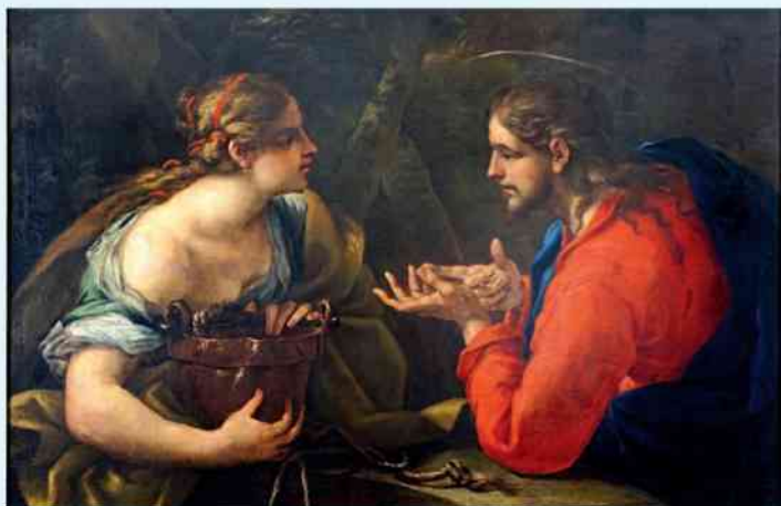
C. Maratta - Chrystus i Samarytanka

Czasem spotkaniem z Jezusem są rekolekcje! On przez swoich kapłanów i przez Słowo Boże mówi do nas, zapraszając do przemiany życia. W mojej diecezji zamojsko-lubaczowskiej już za kilka dni rozpoczynamy peregrynację krzyża św. Jana Pawła II. Od 25 marca do 12 października papieski krzyż będzie nawiedzał parafie, a te wyjątkowe odwiedziny będą poprzedzały rekolekcje ewangelizacyjne. Przez 3 dni – odpowiednio do tego przygotowani kapłani – będą głosić Dobrą Nowinę o tym, że Bóg jest dobry, że kocha, że nie doświadczamy tej miłości z powodu naszych grzechów, ale Jezus umarł za nas i przez swoją śmierć krzyżową przywrócił nam pokój z Bogiem. Wystarczy tylko uwierzyć, nawrócić się i żyć Ewangelią. □