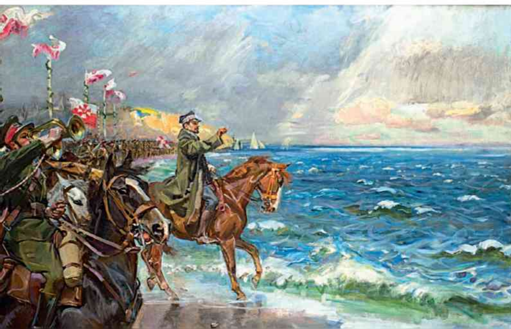
Wojciech Kossak. „Zasłużony Polski z Bałtykiem”