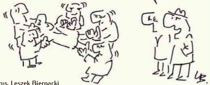
rys. Leszek Biernacki