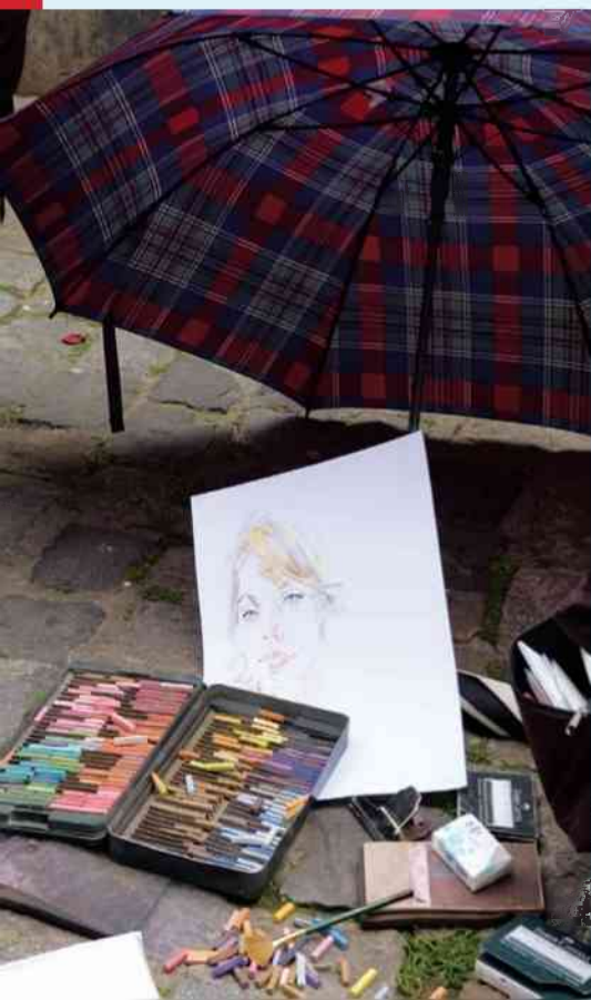
fol. M. T. Frankowski

„Tak, Panie, ufam i wierzę w to, że jesteś dobry. Tylko czasem patrzę na świat, na cierpienie, na zło, gdzieś gubią się te myśli. Tylko niekiedy zastanawiam się czy czasem nie ma limitu Twojej dobroci. Tylko czasem to za długo trwa. Proszę, nie czekaj na pierwszą gwiazdkę, ale już teraz przyjdź do mnie, Jezu. Przyjdź i pozwól wciąż wierzyć w dobro”. □