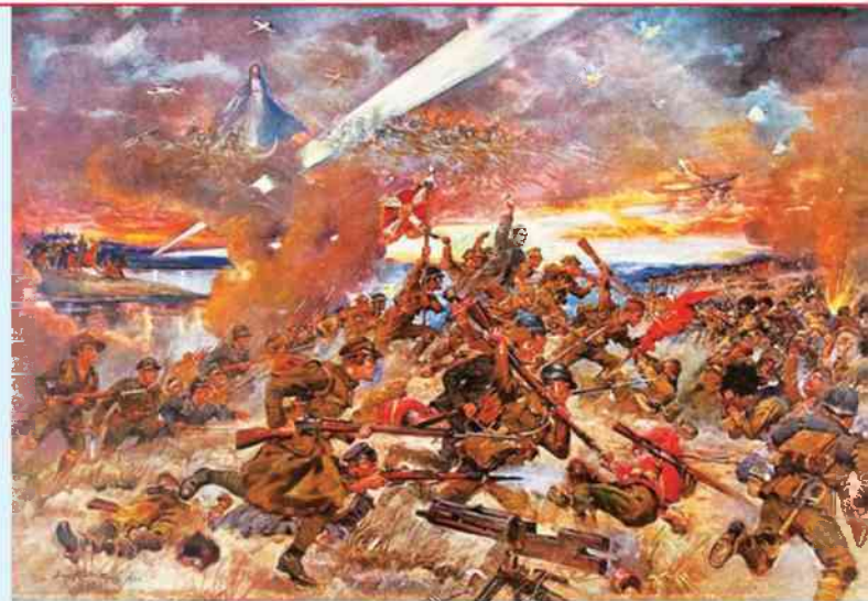
J. Kossak – Cud nad Wisłą

Ale tej nocy z 14 na 15 sierpnia, coś się wszystko popsuło. Generacja Armii Czerwonej straciła łącznie z frontem. Nie wiedzieli, co się dzieje. Natomiast niektórym żołdatom było dane zobaczyć, że ich ochraniała Matka Boża! A pośród tych, co strzelali jedni do drugich, w tę noc sierpniową, był ksiądz, który wziął chłopców z gimnazjów warszawskich. Kochał ich jak synów. I poprowadził na śmierć. A kiedy była noc ciemna, krzyknął: „Za Boga i za Ojczyznę!” I poszły dzieci. Nikt wówczas nie zauważył, że nie ma księdza. Dopiero następnego dnia pułkownik Dobrowolski obchodził pole