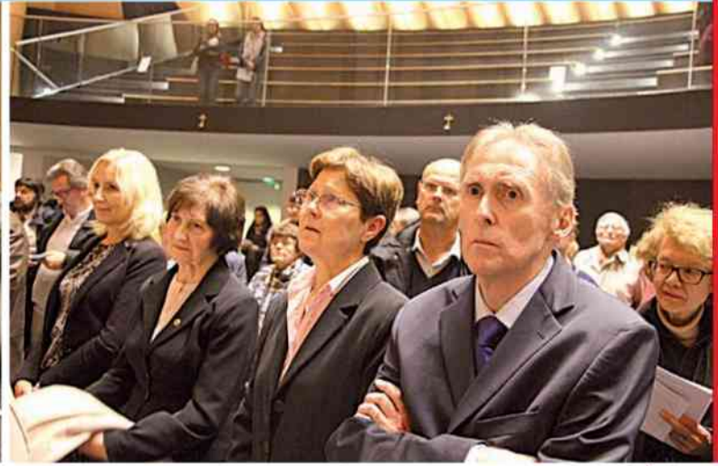
Uzdrowiony mężczyzna za wstawiennictwem bł. ks. Jerzego ze szpitala w Créteil