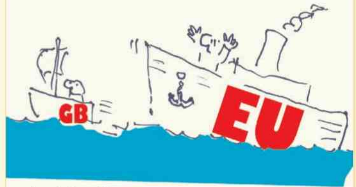
rys. Leszek Biernacki