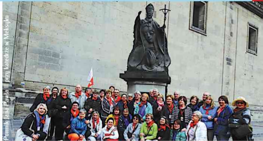
Pomnik Jana Pawła II przy katedrze w Meksyku

swojej narracji nowoczesność Meksyku z jego chrześcijańskim dziedzictwem oraz z wieloplemienną starożytnością. Stynny «Plac Trzech Kultur» w samym sercu stolicy niejednokrotnie splotł krwi. Ostatni raz tuż przed Olimpiadą w roku 1968. Zginęły wtedy na nim tysiące meksykańskich studentów, notabene. przy zмовie milczenia mediów całego świata! Na placu Tlatelolco przetrwał najstarszy kościół Meksyku. Aktualna stolica Mexico (Meksyk – bodaj najludniejsze miasto świata, niemal 34 miliony mieszkańców) oślniła nas świetnością swojej Katedry, ku naszemu zaskoczeniu... z kilku polonikami: postacią króla Kazimierza Jagiellończyka w głównym ołtarzu, obrazami: Św. Siostry Faustyny i Św. Jana Pawła II. Wymowny jest też pomnik Jana Pawła II przed Katedrą: peleryna papieska zdana nam się zeszcpeoną przez ogromną liczbę... kluczy! Napis na pomniku wyprowadził nas z błędu: «Jan Paweł II znalazł klucze do meksykańskich serc». W Muzeum Narodowym zaskoczyła nas m.in. wystawa Heleny Poniatowskiej! W podobne zaskoczenie wprawiła nas starożytność aztecka. Z wysokości Piramidy Księżyca i Piramidy Słońca w Teotihuacan, opodal Meksyku, do dzisiaj zachowały się kontury miasta, które na tysiąc lat przed odkryciem Ameryki liczyło już 175 tysięcy mieszkańców! Plan urbanistyczny do dzisiaj wyznaczają ślady starożytnych arterii.