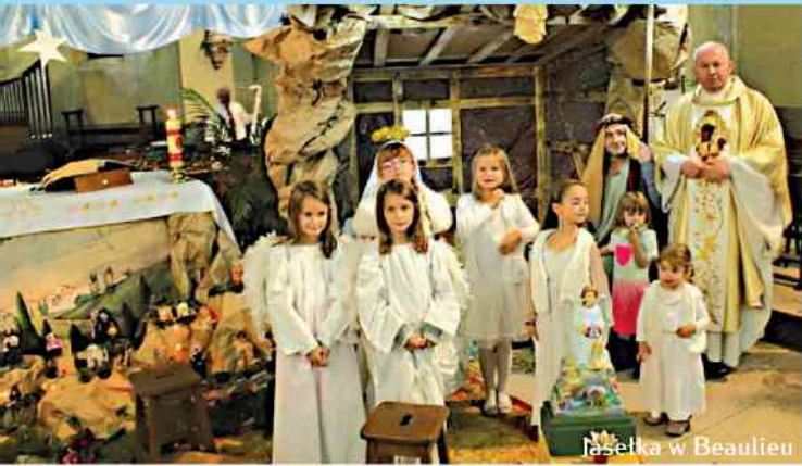
Jasółka w Beaulieu