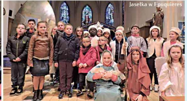
Jasółka w Fouquieres

Doroczne przedstawienia jasełkowe w wykonaniu dzieci uczęszczających na katechizację pomagają w podejmowaniu refleksji i medytacji nad tajemnicą Wcielenia Boga oraz w wysłuchaniu Mu hymnu uwielbienia i dziękczynienia za Jego wielką miłość i nieskończone miłosierdzie.