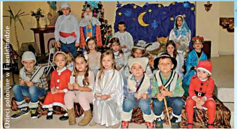
Dzieci polonijne w Fuentelabradzie