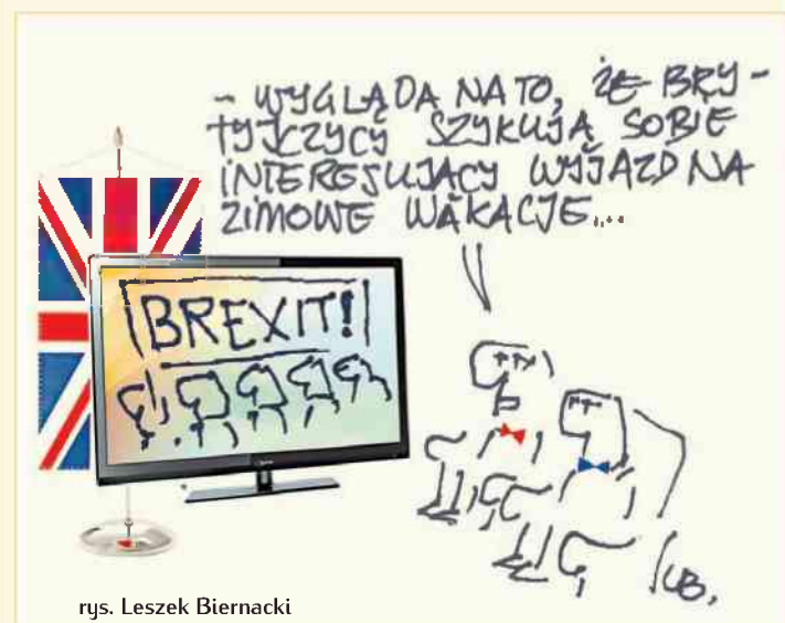
rys. Leszek Biernacki