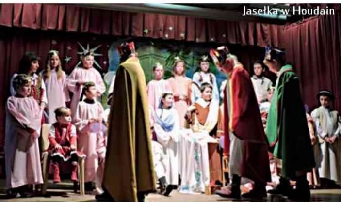
Jasółka w Houdain

Doroczne przedstawienia jasełkowe w wykonaniu dzieci uczęszczających na katechizację pomagają w podejmowaniu refleksji i medytacji nad tajemnicą Wcielenia Boga oraz w wysłuchaniu Mu hymnu uwielbienia i dziękczynienia za Jego wielką miłość i nieskończone miłosierdzie.