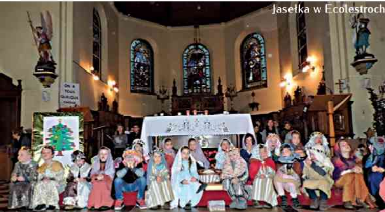
Jasółka w Ecolestroch