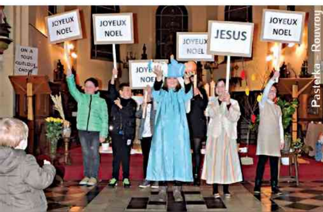
Pastelka - Rouvroy