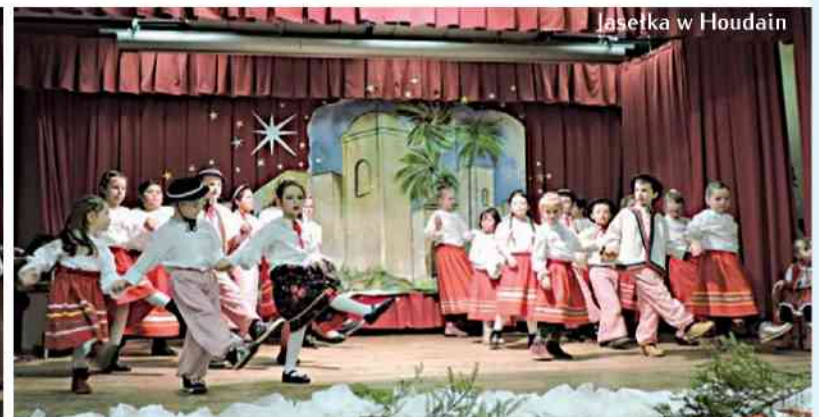
Jasółka w Houdain

Zainaugurowany przez papieża Franciszka, w Uroczystość Niepokalanego Poczęcia NMP, Nadzwyczajny Rok Święty Miłosierdzia jeszcze bardziej do tego zachęca. Zatem wstępując się w słowa naszych małych aktorów śpiewamy i módlmy się wspólnie: Misericordias Domini in aeternum cantabo!