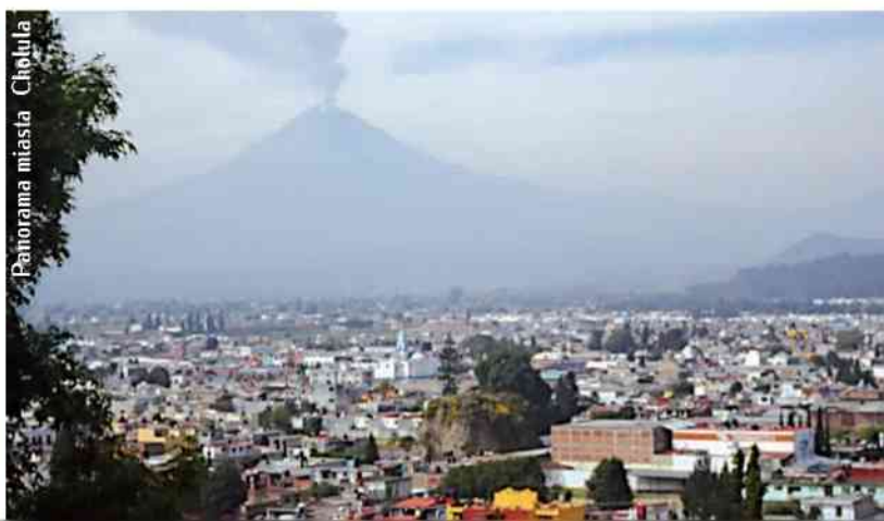
Panorama miasta Cholula