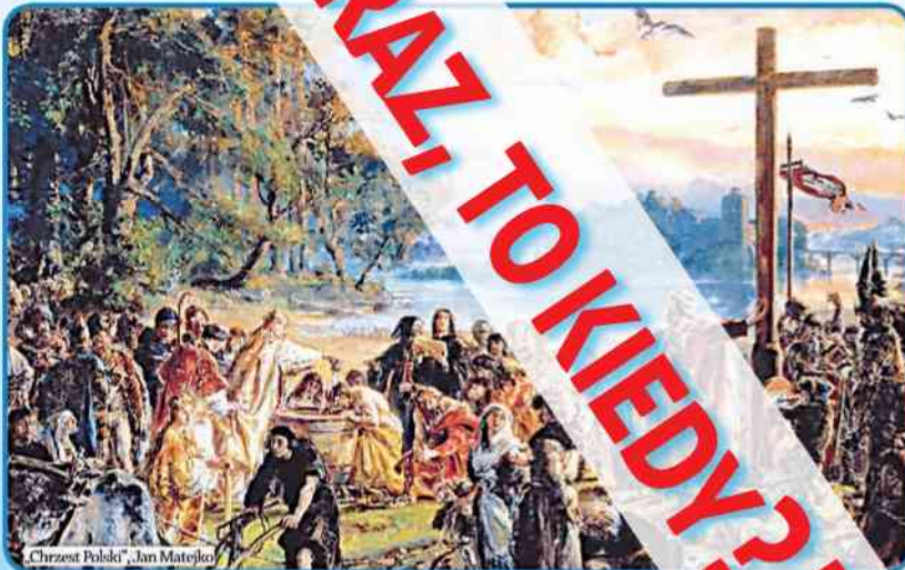
„Chrzest Polski”, Jan Matejko