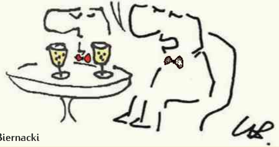
rys. Leszek Biernacki

- MAM NADZIEJĘ, ŻE OBYWATELE PAŃSTWA ISLAMSKIEGO NIE BĘDĄ SOBIE ŻYCZYĆ ZBYT WIELE DOROBEGO W TYM NOWYM ROKU..