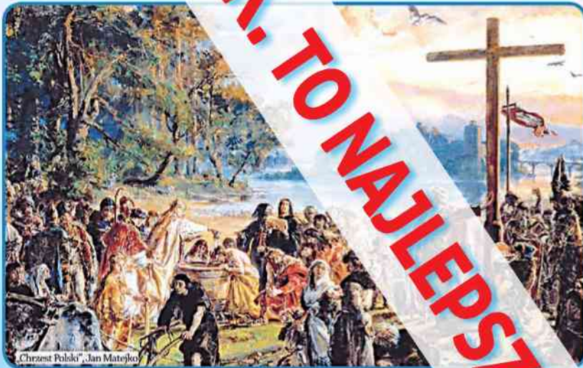
„Chrzest Polski”, Jan Matejko