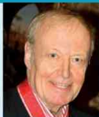
fol. A. Zawadzka