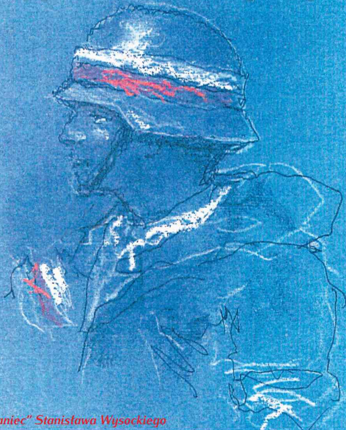
„Powstaniec” Stanisława Wysockiego

w rocznicę wybuchu Powstania Warszawskiego - 1 sierpnia 1944 r.