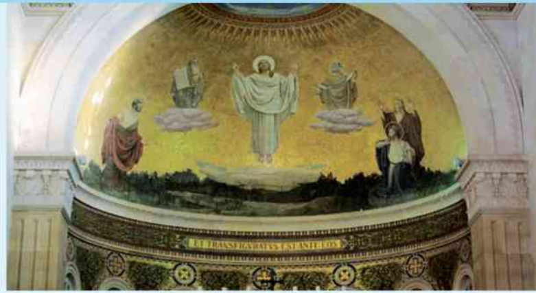
Bazylika Przemienienia Pańskiego

Najmilsi: Nie za wymyślonymi, bowiem mitami postępowa- liśmy wtedy, gdy daliśmy wam poznać moc i przyjście Pana naszego Jezusa Chrystusa, ale nauczaliśmy, jako naocni świad- kowie Jego wielkości. Otrzymał, bowiem od Boga Ojca cześć i chwałę, gdy taki oto głos Go doszedł od wspaniałego Maje- statu: „To jest mój Syn umiłowany, w którym mam upodobanie”. I słyszeliśmy, jak ten głos doszedł z nieba, kiedy z Nim razem byliśmy na górze świętej. Mamy jednak mocniejszą, prorocką mowę, a dobrze zrobicie, jeżeli będziecie przy niej trwali jak