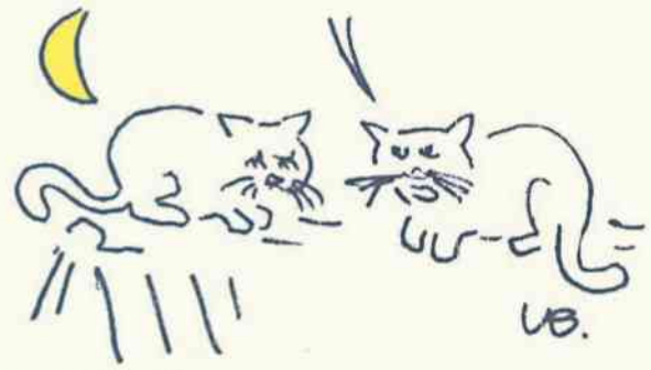
rys. Leszek Biernacki