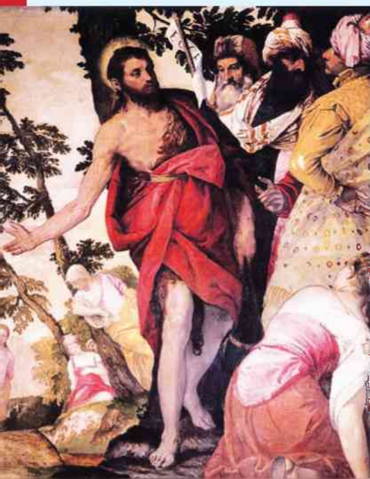
P. Veronese - św. Jan Chrzciciel