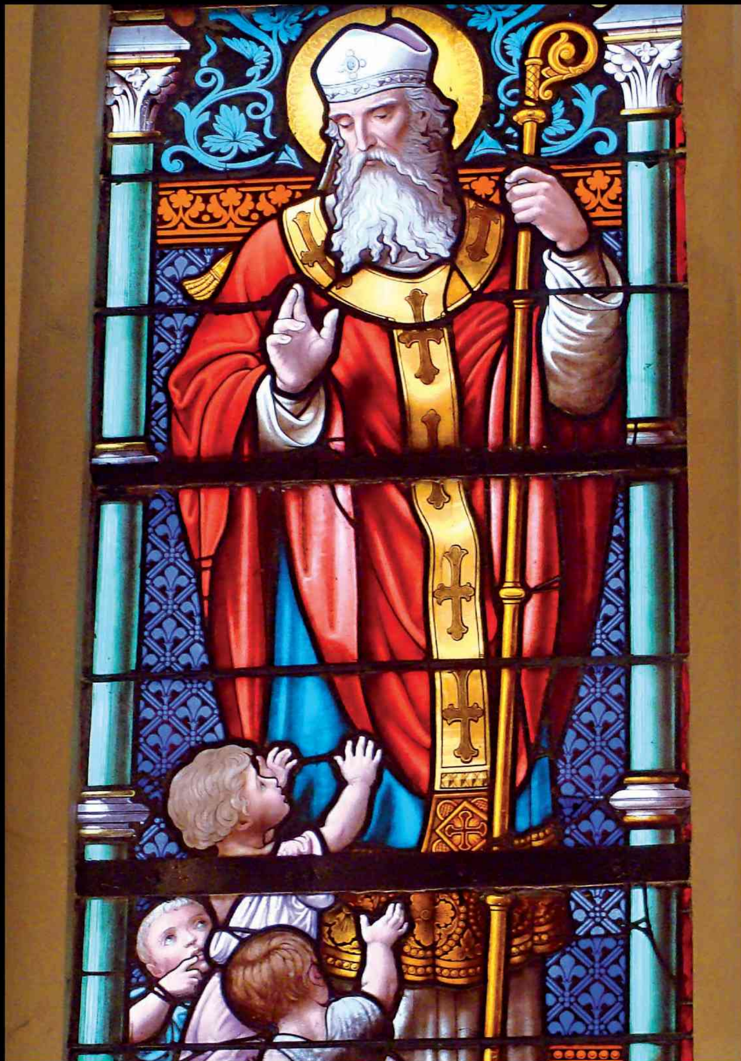
Saint-Nicolas, L'Hôpital (vitrai)