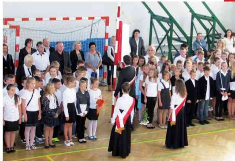
Zespół Szkół Miejskich nr. 3 w Hrubieszowie